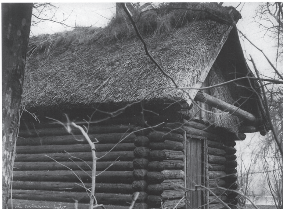
Fig. 3. Sehesteds træhus i parken ved Broholm opført med stenalderredskaber.

Sehested's log cabin was erected using Stone Age tools in the garden of the manor of Broholm.