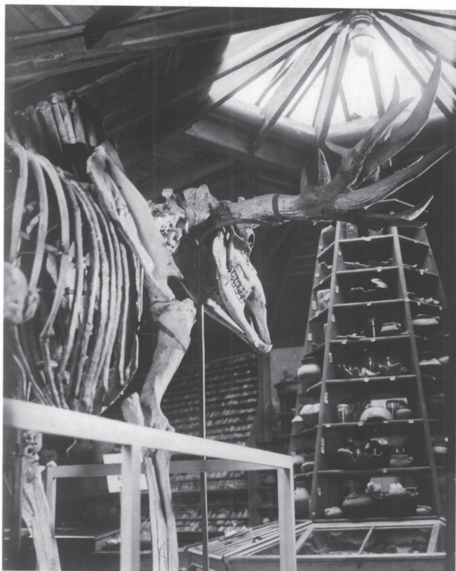
Fig. 2. Interiør fra kammerherre Sehesteds oldsagssamling på Broholm. Samlingen rummer hen ved 80.000 oldsager. Skelettet af den irske kæmpehjort fra Allerødtid, blev fundet i en mose på godsets jord.

The interior of Sehested's artefact collection at Broholm. The collection contains around 80.000 artefacts. The skeleton of the gigantic deer from the Allerød period was found in a bog on the manor.