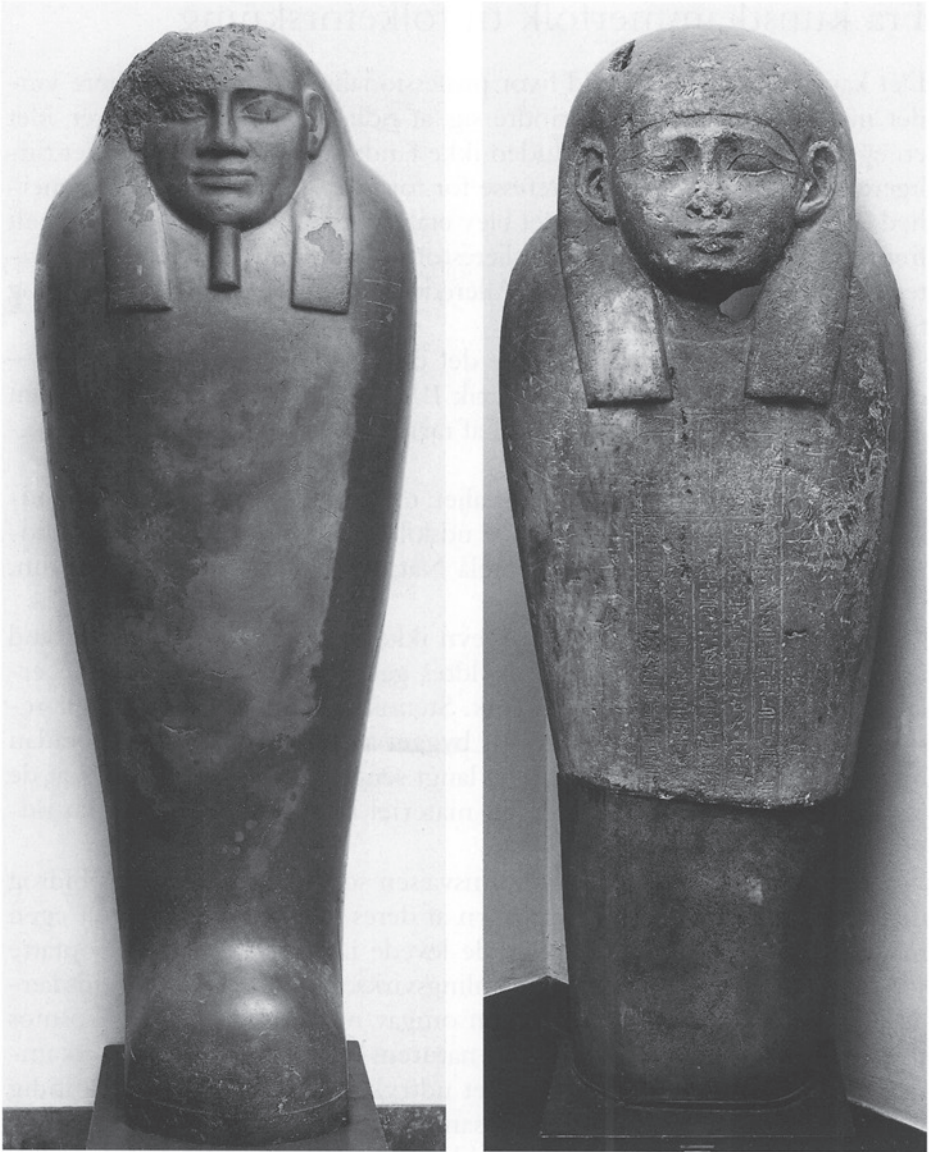
Fig. 1. De to sarkofaglåg fra Jesper Friis' kunstkammer på Ørbæklunde.

Two sarcophagus lids from Jesper Friis' kunstkammer at Ørbæklunde.