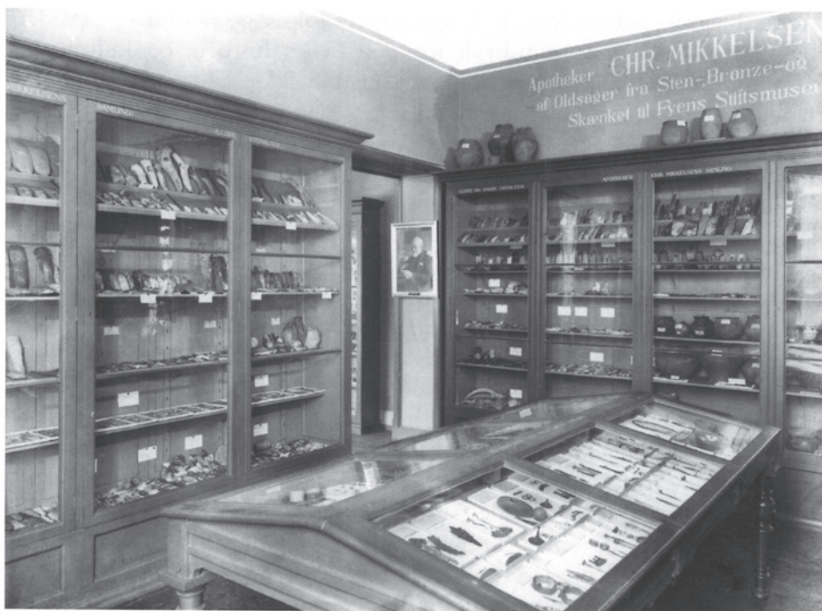
Fig. 4. Apoteker Christen Mikkelsens privatsamling opstillet i Fyens Stiftsmuseum.

The private collection of the chemist Christian Mikkelsen, displayed in the Fyens Stiftsmuseum.