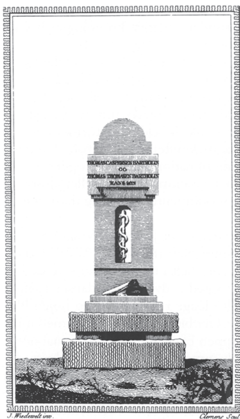
Fig. 3. I Jægerspris slotspark anlagdes omkring 1776 en mindelund for eksemplariske danske borgere. Her ses mindestenen for lægen Thomas C. Bartholin og hans søn antikvaren Thomas T. Bartholin. Bartholinernes virke er symboliseret ved en Asklepios-stav og en skriftrulle.

The park of Jægerspris Castle was laid out around 1776 as a memorial grove. Here are memorials of exemplary Danes such as (here) Thomas C. Bartholin, a doctor, and his son, Thomas T. Bartholin, an antiquarian. An Asclepius' staff and a scroll symbolize their work.