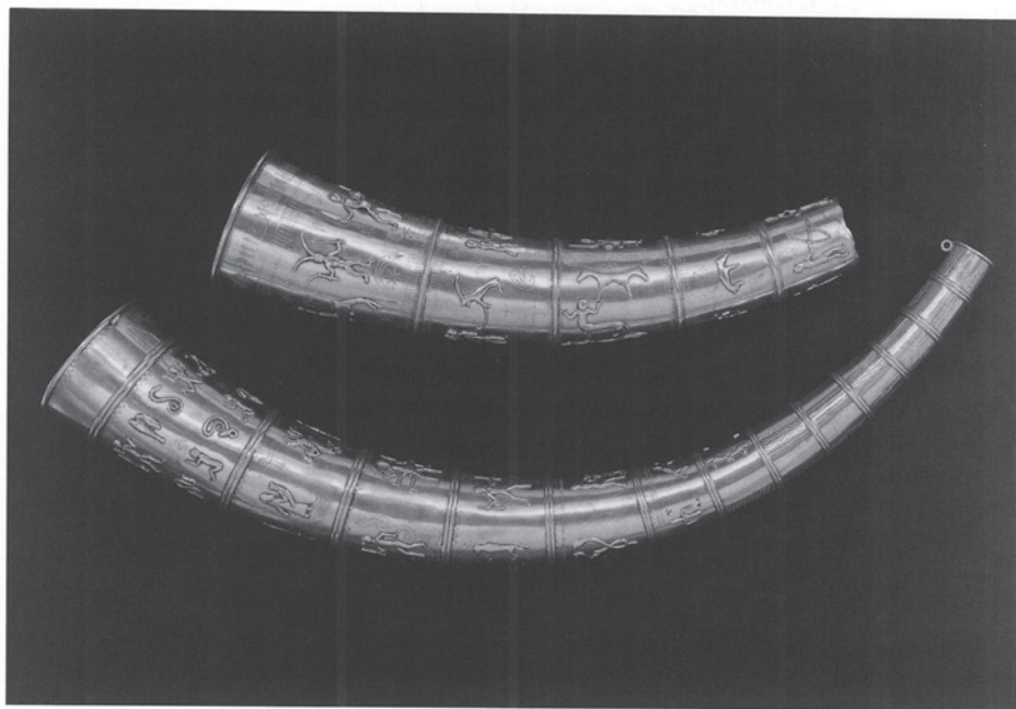
Fig. 12. Guldhornene blev i 1802 stjålet og omsmeltet. Figuren viser rekonstruktionen, som skabtes ud fra tegninger af de oprindelige horn. Med ødelæggelsen af guldhornene destrueredes den danske ånd, som efter samtidens opfattelse fandtes i oldsager og fremprovokerede Oehlenschlägers digt om tabet af hornene. Ud fra en moderne opfattelse af oldsagers kildeværdi er rekonstruktionerne og tegningerne alligevel værdifulde. Rekonstruktionerne er et levn fra deres egen tid, beskrivelserne er en beretning om hvorledes, man mente, hornene så ud.

The gold horns were stolen and melted in 1802. The figure shows a reconstruction based on drawings of the original horn. The destruction of the gold horns also destroyed the Danish spirit, which according to contemporary belief was contained in artefacts. It provoked Oehlenschläger to write a poem about the loss of the horns. From a modern conception of the source value in artefacts, the reconstruction drawings are valuable. The reconstructions are remnants of their own time, and the descriptions are an account of the contemporary interpretation of the horns' appearance.