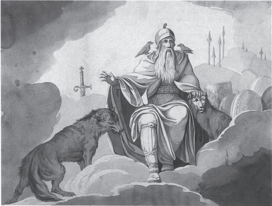
Fig. 5. I 1770'erne og 80'erne udførte Johannes Wiedewelt en række tegninger af de nordiske sagnguder. Denne tegning af Odin er blevet til ud fra den samtidige historiker Suhms beskrivelser af den danske oldtid. Suhm opfattede Odin som en historisk person, der bl.a. havde indført jernet til Danmark. Skjoldet i baggrunden er inspireret af den store Jellingsten. – Kunstakademiets Bibliotek.

In the 1770s and 1780s, Johannes Wiedewelt executed a number of drawings depicting Nordic legendary gods. This Odin drawing was made according to the contemporary historian Suhm's descriptions of the Danish past. Suhm saw Odin as a historic person, who had – among other things – introduced iron into Denmark. The shield at the back was inspired by the large Jelling Stone.