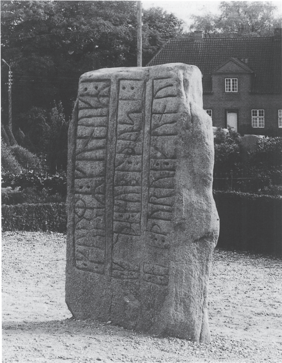
Fig. 10. Den lille Jellingstens vidnesbyrd var et yndet eksempel på oldtidens kildepotentiale for 1800-tallets arkæologer og historikere. Spørgsmålet var blot, om man kunne regne med indskriften, som modsat Saxo angiver, at Dronning Thyra døde før Kong Gorm den Gamle. Om end historikerne begyndte at acceptere indskriftens kildeværdi, var det dog indskriften og ikke stenen i sig selv, der blev betragtet som historisk kilde.

Between archaeologists and historians, the testimony of the small Jelling Stone was a popular example of the source potential of prehistory. However, the question was whether or not to take the inscription for granted, as it – as opposed to Saxo – states that Queen Thyra died before King Gorm. Although historians began to accept the source value of the inscription, it was the written message and not the stone that was considered a historical source.