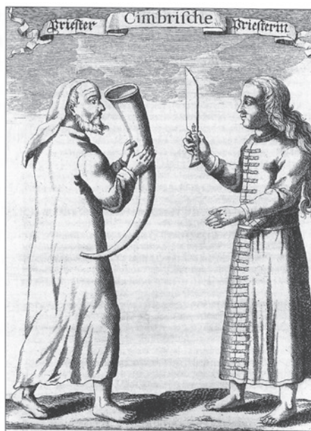
Fig. 1. Da Trogillius Arnkiel i 1702 udgav bogen Cimbrische Heyden-Religion, illustrerede han hedensk religion med eksempler fra det lange guldhorn, der blev fundet i Gallehus i 1639. Her ses en præstinde, der offerer et menneske samt en cimbrisk præst og præstinde.

When in 1702 Trogillius Arnkiel published his “Cimbrische Heyden-Religion”, he used the depictions on the golden horn found at Gallehus in 1639 to illustrate pagan religion. Here are a priestess sacrificing a human being, and a Cimbrer priest and priestess.