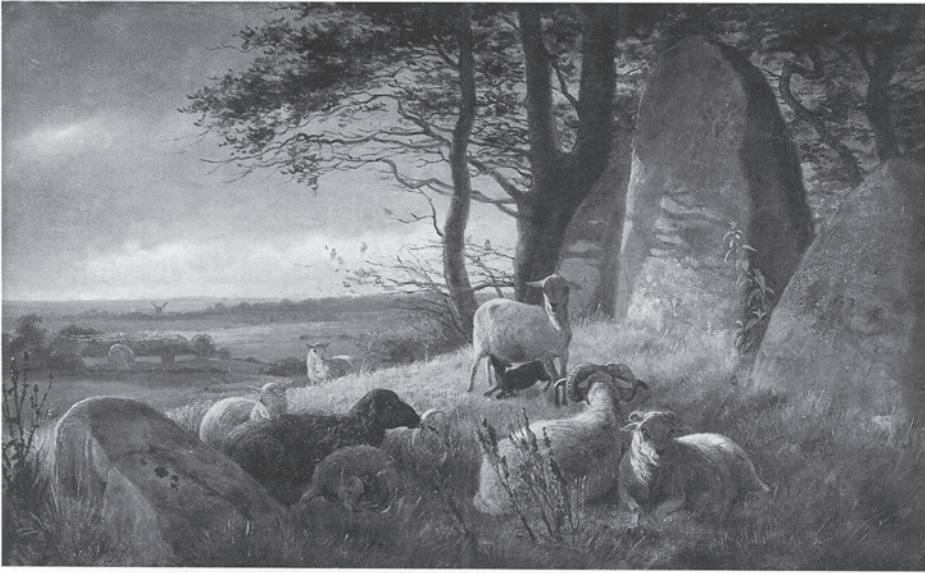
Fig. 7. I første halvdel af 1800-tallet var det romantiske landskab et yndet motiv for guldaldermalerne. Fortidsminder – og især kæmpehøje – var et udbredt motiv, der forenede kultur og natur og understregede den danske histories ælde og dens nære tilknytning til det fysiske landskab. En af de guldaldermalere, der hyppigst brugte fortidsminderne i sine billeder var Johan Thomas Lundbye. Her ses billedet “Aftenlandskab med Får på en Kæmpehøj” fra 1845. – Statens Museum for Kunst. Foto: Hans Petersen.

The romantic landscape was a popular subject of the Golden Age painting during the first half of the 19th century. Relics of the past – barrows or “giant’s mounts” – were a widespread motif, which united culture and nature and stressed the old age of the Danish history and its close affiliation to the physical landscape. One of the Golden Age painters who often depicted antique monuments was Johan Thomas Lundbye. This painting, “Evening landscape with sheep on a barrow” dates from 1845.