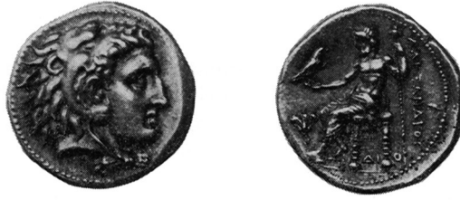
Fig. 4. Alexander den Store. Alexandria i Ægypten. C. 325 f. C. Tetradrachme. 1:1. Alexander the Great. Alexandria i Egypt. Circa 325 BC. Tetradrachma. 1:1.