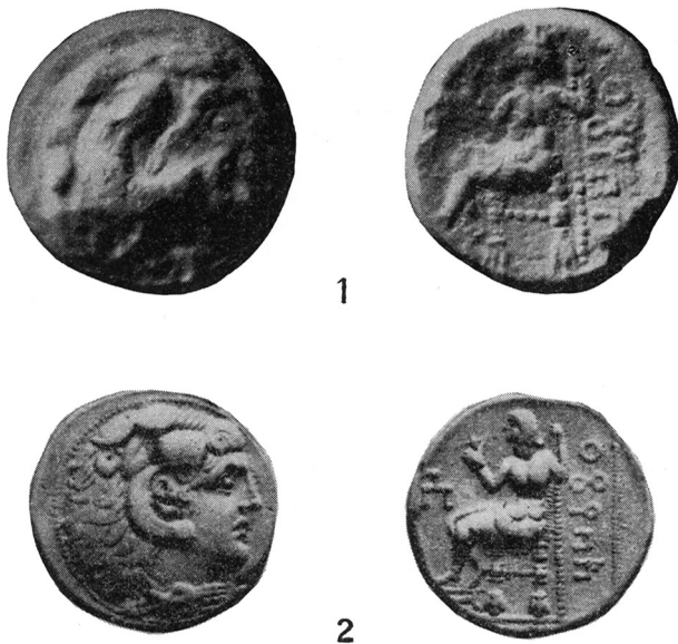
Fig. 5. 1: Drachme slået af Minaeerne c. 150 f. C. 2:1. 2: Tetradrachme af samme type i Aberdeen (efter British Museum Catalogue of Greek Coins, Arabia, Mesopotamia, Persia, pl. 50,5). 1:1.

Særlig interesse har denne mønt i kraft af sin store sjældenhed. Tidligere kendtes denne udmøntning kun fra en i alle enkeltheder identisk tetradrachme i Aberdeen, som er afbildet fig. 5, 2. Der er atter tale om en efterligning af Alexander den Stores typer, men den græske indskrift er her erstattet af kongenavnet Abyatha, skrevet med oldarabiske skrifttegn. Vi ved intet om denne Abyathas' regeringstid, men af stilistiske grunde vil man være tilbøjelig til at placere disse to mønter omkring 150 f. K. Stilen er i øvrigt væsentligt mere græsk end på de ca. 60 år ældre Alexanderefterligninger i møntskatten, således at disse ikke kan have tjent som forbillede for Minaeernes stempelskærere. Inspi-