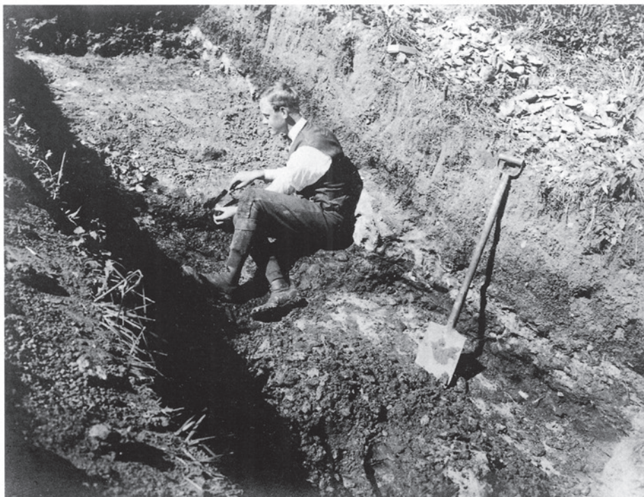
Fig. 1. Den 20-årige forskerspire i gang med sin første store feltindsats, udgravningen på Bloksbjerg-bopladsen, maj 1921 – påklædt i overensstemmelse med tidens mode og hans sociale baggrund. – Foto: Erik Westerby, Nationalmuseet.

The young researcher, aged 20, performing his first large field investigation, the excavation of the Bloksbjerg settlement, dressed according to contemporary fashion and his social background, 1921.