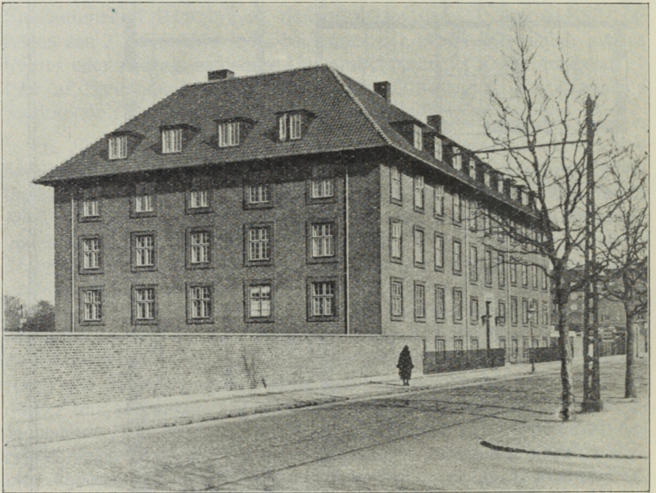
Kvinderegensen. Façade mod Amager Boulevard.