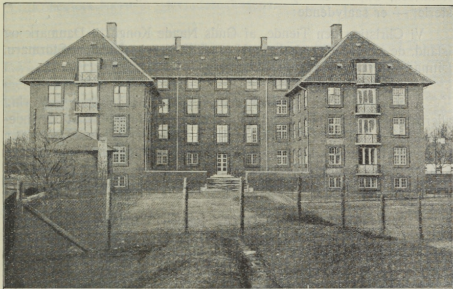
Kvinderegensen. Set fra Enveloppevej.