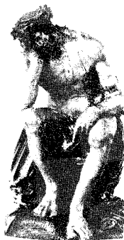
Fig. 3 Til venstre: Albrecht Dürer: »Siddende mand i sorg« (titelblad, førstekorrektur) fra Die kleine Passion , 1511 i ; gengivet efter Karl-Adolf Knappe, Dürer: The Complete Engravings, Etchings, and Woodcuts , London, 1965, p.254.