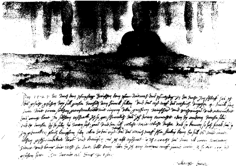
Fig. 5. Albrecht Dürer: »Syn af syndfloden,« 1525. Akvarel og manuskript, Wien, Kunsthistorisches Museum.

Lad os repetere, at det monument, vi har betragtet i Unterweisung der Messung , befinder sig mellem den høje heroiske tribut til militær sejr og den ironisk-heroiske fejring af drukkenbolten, førstnævnte svarende til tragedie og sidstnævnte til komedie. Hvad betyder den mellemliggende position? Jeg vil mene, at et monument til at hylde en sejr over oprørske bønder skabte et genproblem, et problem, som Dürer var særdeles opmærksom på, eftersom han - som vi har set - allerede nærede en munter tvivl om det mere konventionelle sejrsmonument. Dürer kan faktisk have gennemtænkt problemet såvel som fundet en løsning på det, fordi hans bog handlede om problemløsning: skitsen står ved siden af spørgsmål så som, hvordan man sammenbinder to blokke af samme størrelse, sådan at ét punkt i hvert enkelt tilfælde gennemskærer den tilsvarende flade på den anden blok. 15