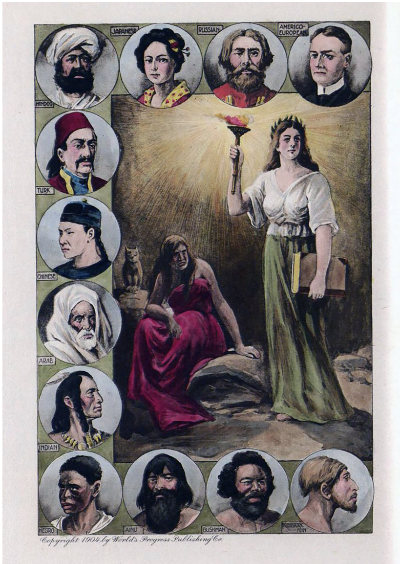
Fig. 1. Mennesketyper og deres udvikling. Planche illustration fra J.W. Buel, Ph.D., Louisiana and the Fair , v. 5, (St. Louis: World's Progress Publishing CO., 1904). i, ii.