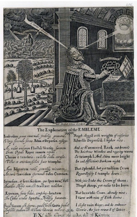
Fig. 3. Frontispice til første udgave af Eikon Basilike, William Marshall, 1649

stor del af befolkningen boede langt fra hovedstaden, hvor der ikke endnu var nogen moderne presse, hvor en stor del af befolkningen var analfabeter, og hvor der ikke var moderne politiske institutioner, var kongens magt og autoritet nødt til at blive performet og medieret i prædikener, oplæsninger af kongelige dekretter eller igennem visuelle medier såsom graveringer, træsnit eller frontispicer (Syme). Tekster såsom Eikon Basilike , der kombinerer visualitet og retorik, var derfor på afgørende vis med til at præge opfattelsen af kongens eftermæle i tiden efter henrettelsen og sikre, at kongens autoritet overlevede, skønt England officielt var blevet en republik. Historikeren Richard Cust argumenterer endda for, at det er Eikon Basilikes fortjeneste, at monarkiet genindsættes relativt genidningsfrit i 1660 (465).