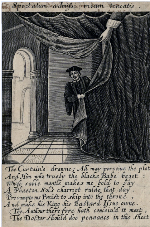
Fig. 5. Frontispice til Eikon Alethine med medfølgende digt, ukendt kunstner, 1649, wikimedia commons

ved gentagne gange at betone, at Eikon Basilikes ikonografiske fremstilling af Charles er fiktion, en forfalskning skabt af republikkens fjender, her symboliseret ved den anglikanske kirke, for at tilrane sig den suverænitets, der ligger hos folket og parlamentet. Kirken har som Phaeton usurperet republikkens magt, og hvis ikke dette standses, så vil nationen gå under. Den sakrosankte majestæt er en fiktion skabt af kirken for at få magt. Dermed undermineres det absolutistiske suverænitetsbegreb og billedet af Charles som martyr.