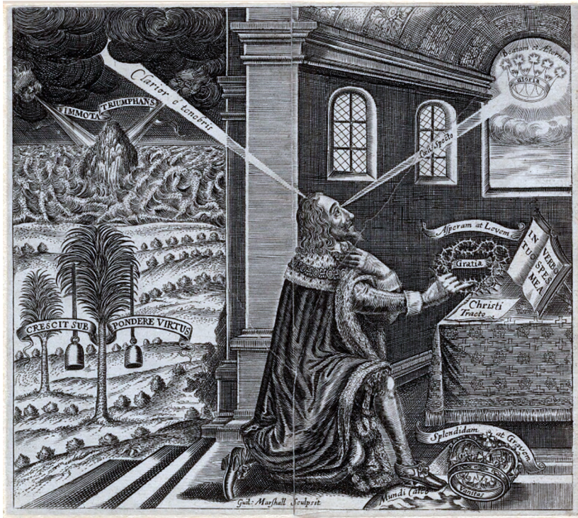
Fig. 4. Frontispice til efterfølgende udgaver af Eikon Basilike, William Marshall, 1649, Wikimedia commons

Selvom mange i 1649 mente, at Charles var den sande forfatter til værket, er der i dag bred enighed om, at han ikke var forfatteren, men der hersker en vis uenighed om, hvem den rigtige forfatter er. Marshalls frontispice findes i to forskellige versioner, der er næsten ens, bortset fra at den oprindelige (figur 3) blev ledsaget af en kort tekst på latin og engelsk med overskriften "The Explanation of the EMBLEME", samt at Charles i de efterfølgende udgaver afbildes i profil (figur 4). Begge versioner af Marshalls gravering placerer Charles centralt i billedet og fremstiller ham, mens han knæler foran et alter, som var han i bøn.