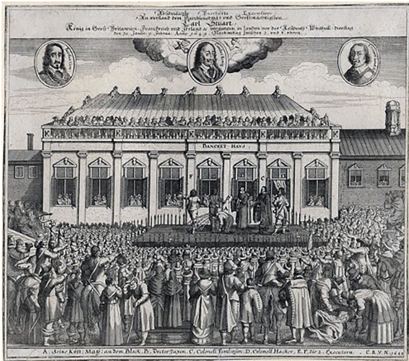
Fig. 1. Charles 1.'s henrettelse, ukendt kunstner, 1649

Visions of Politics 288-289). Det er ganske vist henrettelsen af Charles, der er årsagen til billedkonflikten i 1649, men det er de to suverænitetsbegreber, der er dens indhold.