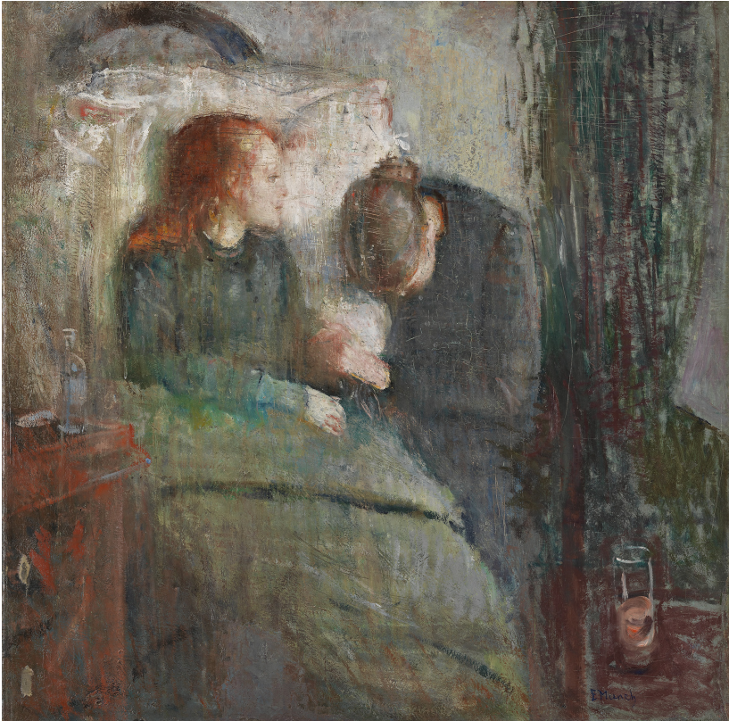
Fig. 1. Edvard Munch, Det syge barn . 1885-86, olie på lærred, 119,5 x 118,5 cm, Nasjonalmuseet for kunst, arkitektur og design, Oslo.

Da Munchs syge pige blev udstillet i 1886 vakte det et ramaskrig blandt datidens anmeldere. De var dog mere optaget af hans malestil end af motivet, som flere af kritikerne fandt bevægende, uagtet at de ikke brød sig om hans stil (H.J. 1886; H.S. 1886; S.S.1886). Man kan argumentere for, at Munchs version af den syge pige adskiller sig fra andre værker med syge piger, idet han tager udgangspunkt i en personlig oplevelse. Dette kom til