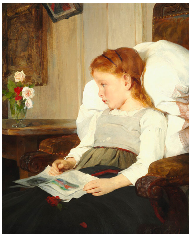
Fig. 7. Bertha Wegmann, Et sygt barn. 1873, olie på lærred, 75 x 60 cm, privateje.