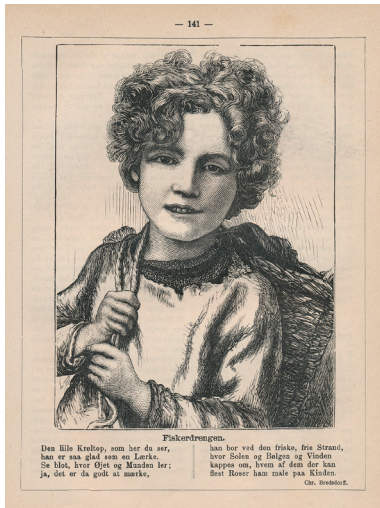
Fig. 9. "Fiskerdrengen", Nordisk Illustreret Børneblad. 15 12 (25. marts 1888).