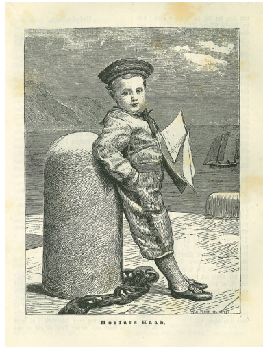
Fig. 10. "Morfare Haab", Nordisk Illustreret Børneblad. 2 1 (oktober 1874).

med landbefolkningen, kunne enhver dreng iføre sig matrostøj, og hermed iklæde sig nogle af de egenskaber, der blev forbundet med matroser og skibsdrenge: dristige, kække, muntre ligesom der var en snert af eventyr over deres liv (Tonn-Petersen 6). Matrostøjet blev ligeledes associeret med fritid og leg, men i flere tidsskrifter ses matrosdrengen også på stranden, og dermed bliver han også forbundet med det rekreative og sunde liv. Hermed låner drengen – og pigen – iklædt matrostøj også noget af den sundhed, der associeres med den veltrænede krop. Mange af samtidens bøger om gymnastik var netop skrevet af militærfolk, der fungerede som garanter for den sunde og veltrænede krop, og dermed lånte deres autoritet på området fra den militære sfære (Hovgaard; Petersen; Christensen). Billederne af drenge iklædt matrostøj, ofte placeret på stranden og somme tider med et legetøjsskib i hånden, refererer altså ikke kun til et modefænomen, men også til idéen om, at det barn, der har matrostøjet på, er i besiddelse af en