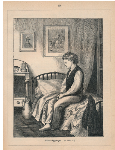
Fig. 3. "Efter Sygelejet", Nordisk illustreret Børneblad. 14 4 (november 1886).

uheld, typisk fremprovokeret af vild og tankeløs leg, 2. en smitsom sygdom, der gerne rammer flere i omgangskredsen/familien, 3. en pludselig opstået og ikke-diagnosticeret sygdom. Derimod beskrives den syge eller den sunde krop ikke direkte, i stedet præsenterer bladet deres læsere for illustrationer, hvor den sunde og aktive krop vises i naturen, mens den syge, passive krop er gengivet liggende eller siddende i et interiør. Mens den aktive krop vises i mange forskellige situationer er skildringerne af den syge krop meget ens: kroppen er bundet til et møbel, en seng eller en stol, placeret i et interiør, hvor der foruden den liggende eller siddende syge person også ofte er blomster, vandglas, medicinflasker og en bog, som den syge er i færd med at læse i.