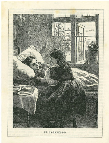
Fig. 6. "Et Sygebesøg", Nordisk illustreret Børneblad. 3 17 (juni 1876).

der er ingen spor på natbordet efter medicinflasker eller den obligatoriske blomsterbuket, der ses på en stor del af malerierne med de syge piger. Begge de syge drenge, der præsenteres, er på et stadie i deres sygdom, hvor de kan betegnes som rekonvalescenter, mens det samme ikke er tilfældet med de syge piger.