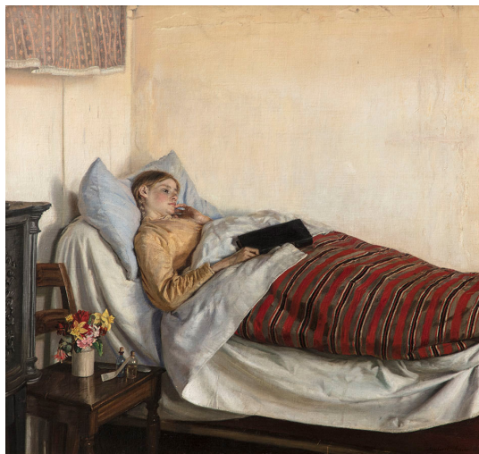
Fig. 8. Michael Ancher, En syg ung pige. 1883, olie på lærred, 81 x 90 cm, Den Hirschsprungske Samling.

synes dermed ikke at være nogen forskel på den syge pige, der præsenteres i Nordisk illustreret Børneblad og i periodens maleri. Det ses eksempelvis også hos kunstnerne Bertha Wegmann og Michael Ancher, der i slutningen af 1800-tallet malede syge piger, der ligesom Lydia har lagt deres læsestof fra sig og i stedet kigger ud i luften med et fraværende blik. Flere andre af periodens syge piger er skildret på samme måde. 12