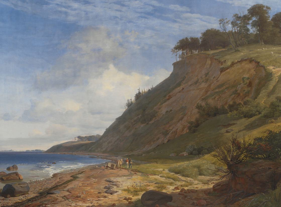
Fig. 4. J.Th. Lundbye: En dansk kyst. Motiv fra Kitnæs ved Roskilde, 1843. Olie på lærred, 185,5 x 255,5 cm. Statens Museum for Kunst (KMS412), www.smk.dk , public domain. Udstillet på Charlottenborg 1843.

sagt, er der stort set ingen billeder fra den syd- og sønderjyske marskegn, hvor der er bevoksede strandenge, Altså et eksempel på grønne strande men også karakteriserede ved at være fladt sletteland, et landskab der ikke bliver tilvalgt i 1800-tallet. Det er også et landskab, der står i klar modsætning til de klitter, der pludselig viser sig i titlerne i 80'erne.