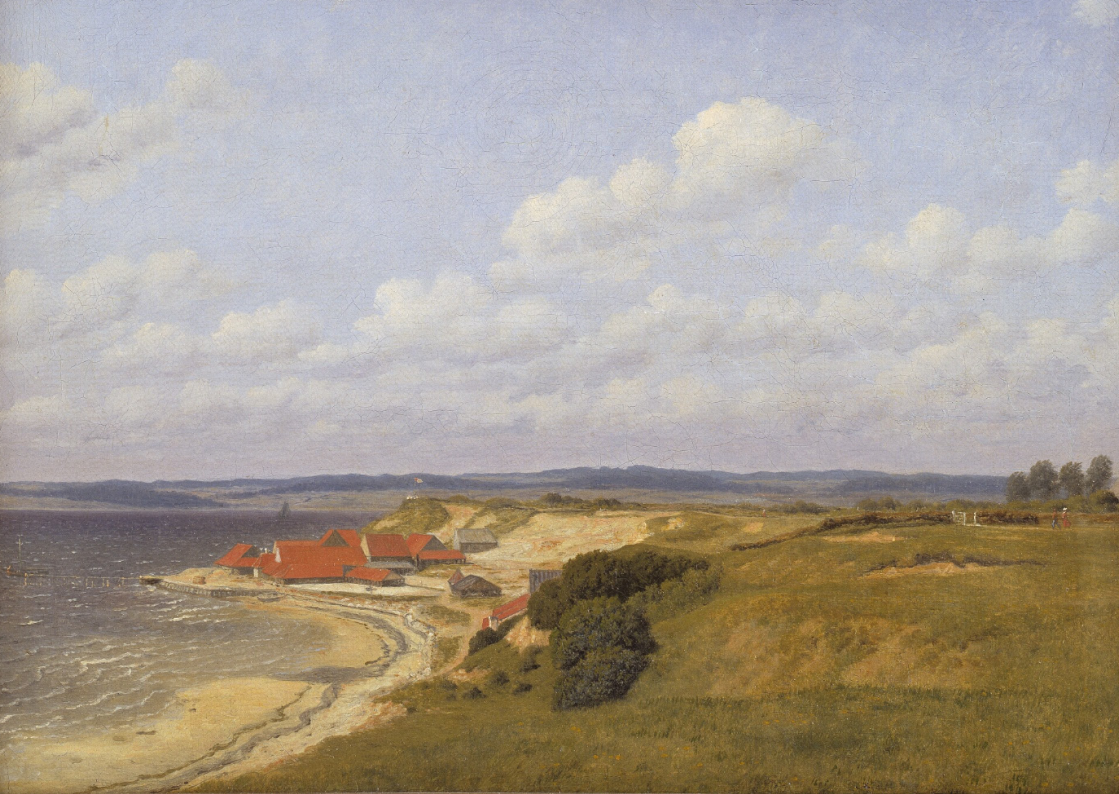
Fig. 7. C.W. Eckersberg: Teglværket Renbjærg ved Flensborg Fjord, 1830. Olie på lærred, 22,5 x 32,5 cm. Statens Museum for Kunst (KMS1350), www.smk.dk , public domain. Udstillet på Charlottenborg 1831 som "Prospekt af Teglværket Reenberg ved Egersund".

geografiske strandbegreb. De geografier, der blev skildret, indbefatter de bevoksede kyster og strandenge, såvel som klintekysterne. 1800-tallets landskabsmaleri kan også påvise den gryende interesse for sandstrandene, og hvordan den bliver meget markant i de sidste årtier af århundredet. Ligeledes kan billederne være med til at dokumentere, at den ikke-faggeografiske betydning af "strand" har ændret sig markant, og at i slutningen af århundredet tegner der sig en association til sand fremfor andre strandmaterialer, ligesom klitlandskaberne inddrages mere.