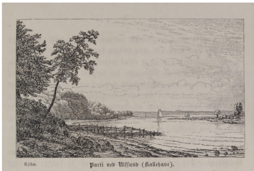
Fig. 2. Illustration i Erslevs Den Danske Stat (1) af Vilhelm Kyhn: Parti ved Ulfund (Kallehave).

E. Erslevs Den Danske Stat, En Almen Geografisk Skildring for Folket (Christiansen 396). I bogen, som er illustreret af tidens landskabsmalere, udpeges kysterne til at være den centrale, særligt typiske, danske geografi. Parallelt med udgivelsen er kunstnerne begyndt i langt højere grad at skildre strande og kyster, især en kunstner som Vilhelm Kyhn (Oelsner, Overblik og grænser 161-62). Senere i århundredet er der den kendte kunstnerkoloni på Skagen med utallige strandmotiver (Bøgh Jensen). På baggrund af, at 1800-tallets landskabsmaleri så klart viser et tilvalg af strande, som de ses ved Skagen, vil denne artikel efterspørge, om landskabsmaleriets udvikling i århundredet også kan pege på, hvad der sker med de andre mulige forståelser af strande, der kendes sprogligt og geografisk.