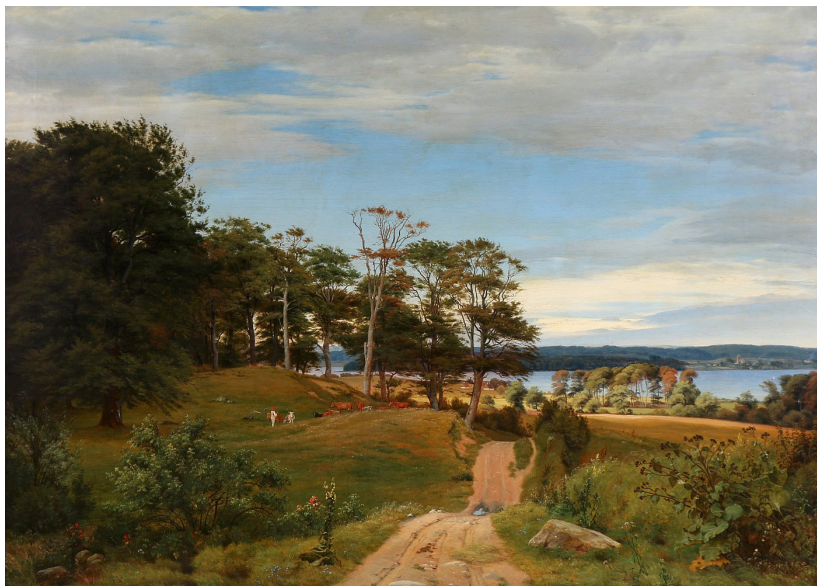
Fig. 1. P.C. Skovgaard: Et sjællandsk Landskab, hvortil Motivet er taget ved Fredensborg, 1841. Olie på lærred, 116 x 160 cm. Skovgaardmuseet (inv.nr. 19.985), public domain. Udstillet på Charlottenborg 1842.

Det er også relevant at spørge, hvordan disse fravalgte geografier opfattes i dag: Hvis de anses som uattraktive, er det så en konvention fra 1800-tallets landskabsideal, som det er på tide at gøre op med?