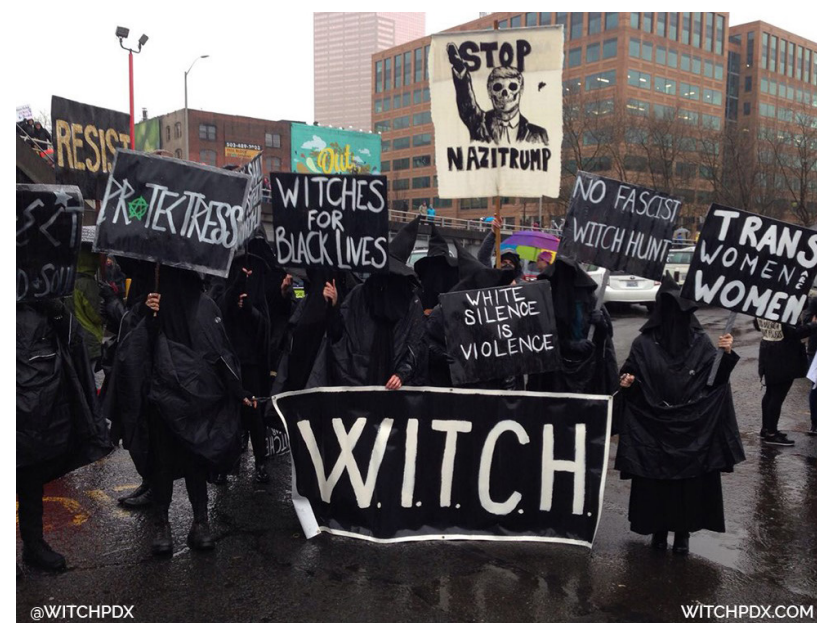
Fig. 2. W.I.T.C.H.

Samtidig er den okkulte eller mere præcist den vestlige, esoteriske tradition en garant for kontinuitet. Den er netop ikke et radikalt brud med