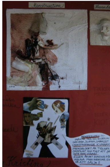
Fig. 1. AnnBritt Ryde. Mens- tåvlan. 1973. © Monica Englund.