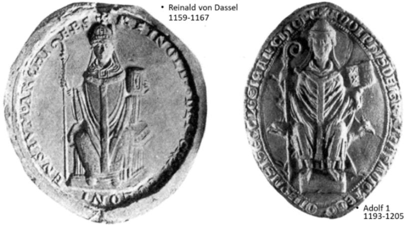
Fig. 9. Rigskansler Rainald von Dassels seglaftryk som ærkebiskop af Köln, 1159-1167, samt seglet for en af hans efterfølgere, Adolf 1., 1193-1205, 1212-1216.

et personligt kendetegn, er der f.eks. Bruno 3. von Berg (1191-1193), der til tegn på sin valfart til Jerusalem sidder med en palmegren i hånden. 134