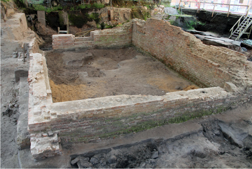
Fig. 6. Resterne af teglhuset syd for Ribe Domkirke, set mod øst.

i forbindelse med en embedsbesættelse uklar i en sådan grad, at de kom i nævekamp, og kannikkerne pryglede løs på bl.a. biskoppen, som fik flænget sit tøj. 115 Kannikkerne appellerede til ærkebiskop Eskil, men Radulf fik i 1169 udvirket en skarp pavelig reprimande til kannikkerne fra Alexander 3., der blev læst op ved kirkefesten i Ringsted 1170. Da Radulf døde kort derefter, skete der ifølge Krøniken ikke videre hverken i denne eller andre sager, men pavens brev foreligger som afskrift i krøniken. 116