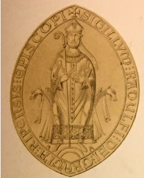
Fig. 1. Radulfs segl som biskop af Ribe, spejlvendt gengivelse af motivet på seglstampen (fig. 7) og dermed lig stampens ca. 9 cm høje aftryk i voks, hvoraf der ikke er noget eksempel bevaret. Indskriften lyder: »Sigillum Radulfi Dei gratia Ripensis episcopi – Radulfs segl, af Guds nåde Ribes biskop«. Efter: Henry Petersen 1886.