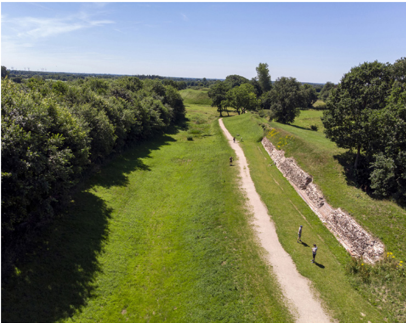
Fig. 2. En frilagt strækning af Danevirkes lange teglmur, vest for porten, der førte gennem muren.

Centrale personer er på scenen, først og fremmest kong Valdemar den Store (1157-1182) og Roskildebiskoppen, den senere ærkebiskop Absalon (Roskilde 1158-1192, Lund 1178-1201) samt i en muligvis undervurderet rolle dennes forgænger, Eskil (1137-1177). Som praktisk