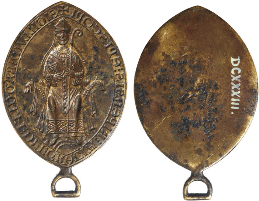
Fig. 7. Radulfs seglstampe, for- samt bagside, med bæresøken, som skulle vende nedad, når stampen blev trykket ind i vokset (jf. fig. 1). mus. nr. DCXXXIII.

Den spidsovale seglstampe (højde 9,6, bredde 6,2 cm, vægt 134,088 g) med den stignøgleformede øsken til ophæng forneden har været på Nationalmuseet i 200 år, siden den daværende Oldsagskommission byttede sig til den i løbet af perioden fra 1820 til 1822. 123 Hvor stampen var før