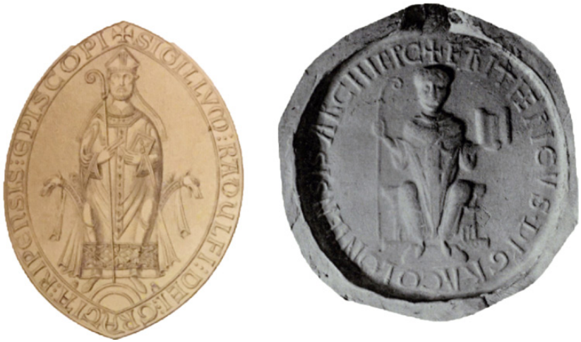
Fig. 8. Kölns ærkebiskop Frederik 1.'s anden segltype, brugt fra 1105.