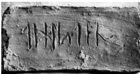
Fig. 3. To runebeskrevne munkesten, den ene med ordet »tihlsten« på dansk fra Nr. Løgum Kirke; den anden fra Lösen Kirke i Blekinge fortæller på latin: »eko sum lapis – jeg er en sten«.