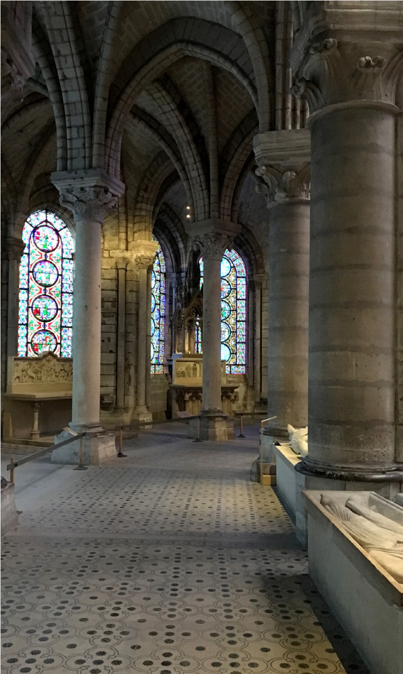
Fig. 4. Saint-Denis, udsnit af østpartiets indre.