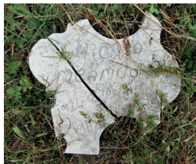
En ituslået gravmarkør.

Institute for War and Peace Reporting 27. April 2012, "The Forgotten", https://www.youtube.com/watch?v=6-Uc-stQm-A (hentet 30.10.2023).