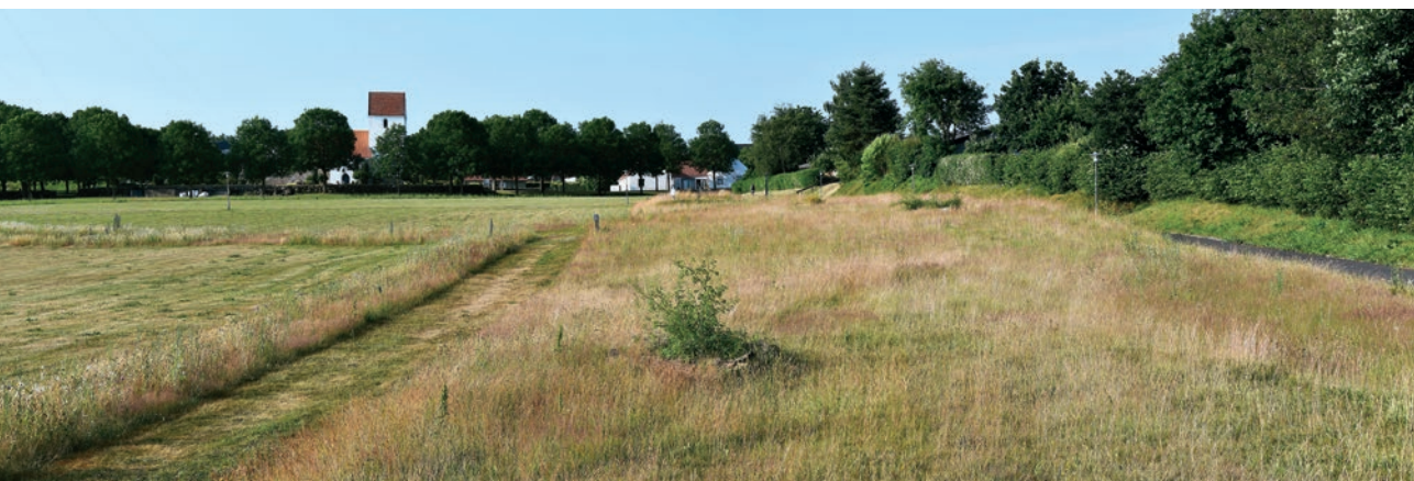
Frejlev Kirke. Aalborg Stiftsøvrighed fremsatte i 1998 en indsigelse mod et lokalplanforslag for et boligområde nord for Frejlev Kirke. Skov- og Naturstyrelsen havde ligeledes fremsat en indsigelse. Lokalplanen blev ændret således, at der blev friholdt en kile i bebyggelsen, der gav fri indsiget til kirken fra Ny Nibevej. For at medvirke til at opnå en helhed i planen købte kirken et af planområdets arealer øst for kirken. Det erhvervede område sikrer yderligere indsyn til kirken og anvendes som rekreativt område. Fra området er der udsyn mod Limfjorden.

Af de ca. 2.350 folkekirker må langt de fleste betegnes som landsbykirker eller landkirker. Mange af dem er fra mid-