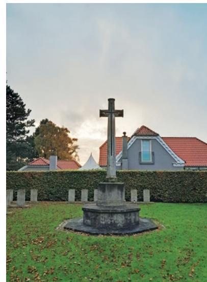
Cross of Sacrifice i Aalborg.

De ovenfor nævnte jubilæumsmarkeringer var bare nogle få ud af mange anno 1950. I Jyllands-Posten blev der den 6. maj under overskriften "I Gaar gik Tankerne til dem, der gav