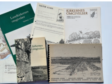
I sidste halvdel af 1900-tallet blev der gjort en stor indsats for at sikre kirkerne i landskabet.