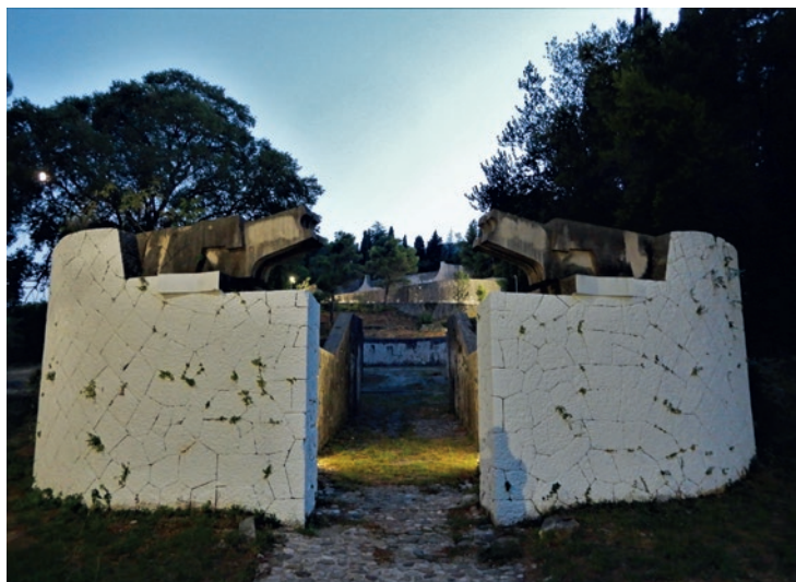
Indgangspartiet er for nylig kalket hvidt for at skjule påmalede Ustaša-U'er.