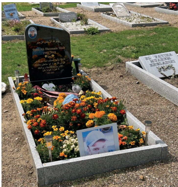
Gravsted for en 31-årig muslimsk mand dekoreret med billeder af afdøde, både i bestandigt og ikke-bestandigt materiale, den blå kasket, afdøde bærer på billedet, placeret midt på graven blandt blomster, hjerter og fire solcellelamper, der lyser graven op i mørke.

Hvis vi skifter det islamiske perspektiv ud med en mere vestligt orienteret mindekultur, bliver læsningen af Omar El-Husseins grav en anden, for her spiller gravsten og kendskabet til afdødes navn ifølge forskningen en vigtig rolle. En gravsten kan med et sprogvidenskabeligt udtryk beskrives som et indeksikalt sign, dvs. et tegn (her i form af en genstand), hvis betydning afhænger af, hvor det er placeret, og hvad det i den givne kontekst "peger på": En gravsten, der er placeret på et gravsted, peger således ned i rum (mod afdøde, der ligger begravet på stedet) og tilbage i tid (svarende til den periode, afdøde var i live), og netop fordi gravstenens raison d'être er at informere om den person, stenen refererer