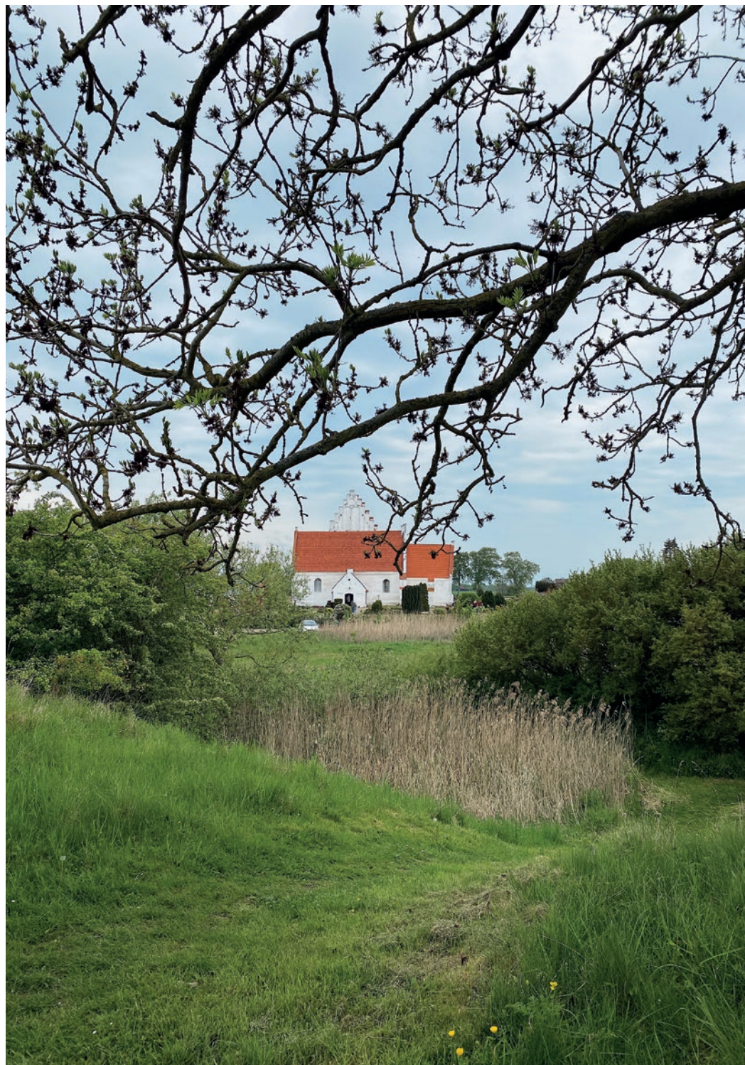
Jungshoved Kirkegård, fra årsmødet 2023.