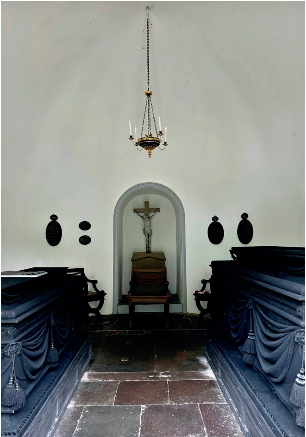
Von Scholtens mausoleum indeni. Foruden kisterne med de to ægtefolk ses bl.a. et krucifiks, to stole samt en række kisteplader for medlemmer af slægten, hvis kister tidligere har været indsat i mausoleet.