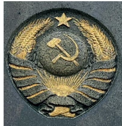
Hammer og segl, Den Russiske Kirkegård i Allinge, Bornholm, 2022.

Allerede fra 1942 og de følgende år fik Aarhus Kommunes Kirkegårdsforvaltning nye og meget omfattende opgaver: begravelser af omkomne RAF-flyvere og i foråret 1945 hundredvis af døde tyske flygtninge og soldater, enkelte krigsfanger fra Holland og Frankrig og i hundredvis fra Polen – og Sovjetrusland. Ved jordfæstelsen i foråret 1942 af en ilanddrevne britisk RAF-flyver iscenesatte byens nazistiske Standortkommandantur en pompøs ceremoni med deltagelse af en