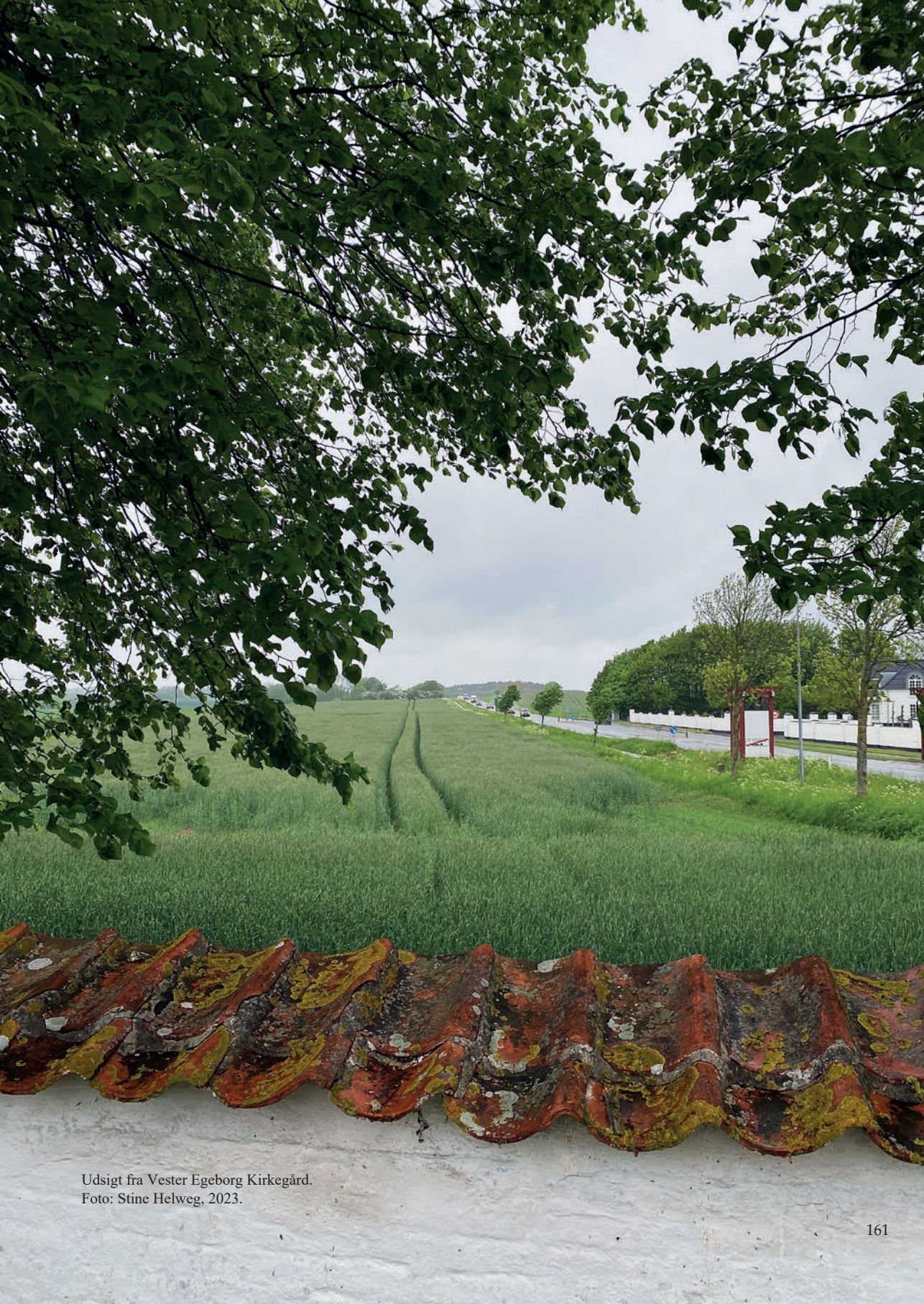
Udsigt fra Vester Egeborg Kirkegård. Foto: Stine Helweg, 2023.