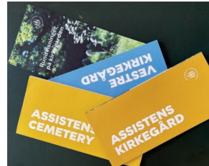
Et udvalg af brochurer relateret til kulturformidlingen på Københavns Kirkegårde. Foruden brochureernes indhold og rundvisningernes emner er valg angående skiltningen/fremhævelsen af ”seværdige grave” typisk dét, der giver reaktioner fra publikum. Foto: Stine Helweg, 2023.

Når vi skilte seværdige gravsteder på Københavns Kirkegårde, sker det med udgangspunkt i de gravsten, som Nationalmuseet har udpeget som bevaringsværdige. Vi skilte ikke kun grave omfattet af kriterium 4 (hvor afdøde er fortjenstfuld, hvilket ofte er det samme som at være en slags kendt), men de dominerer selvfølgelig, da det typisk er disse gravsten, der er størst offentlig interesse for.