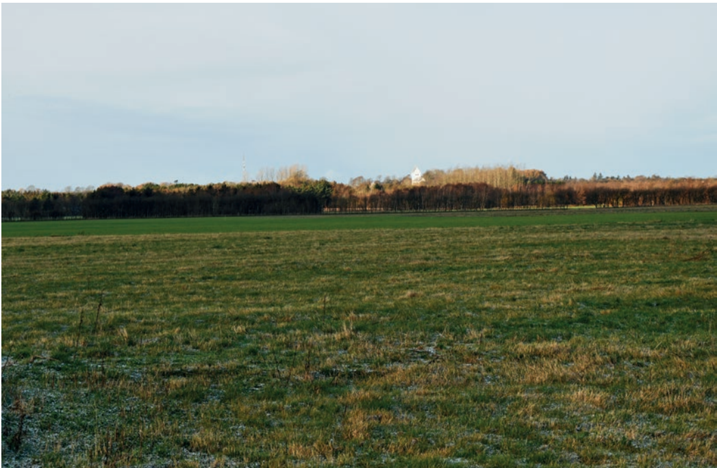
Biersted Kirke. I 2022 blev et område til skovrejsning ikke godkendt, fordi der i Jammerbugt Kommunes Kommuneplan21 var et areal, der ligger i et område, der er udpeget til uønsket for skovrejsning. Baggrunden herfor er, at arealet er beliggende inden for en indsigtskile omkring Biersted Kirke. For kirken findes en aftaleplan, som har dannet baggrund for, at området er uønsket for skovrejsning.

I perioden, hvor der blev udarbejdet aftaleplaner, var der en meget positiv stemning omkring arbejdet, både fagligt og politisk. Det gjaldt ikke blot hos de arkitektfirmaer, der udarbejdede faglige oplæg, men i høj grad også politisk hos amtsråd og menighedsråd og i nogen grad også hos kommunerne. Under behandling af sagerne blev de i en periode korrigeret på detaljer som taghældninger, nedgravning af bygninger m.m., selv om bygningerne ikke lå umiddelbart op mod kirkegården. Denne begejstring og omhu blev gradvist nedtonet, og det er fornemmelsen, at det nu opfattes som besværligt og måske unødvendigt at håndtere det fysiske miljø omkring kirkerne.