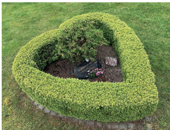
Vester Egesborg Kirkegård.