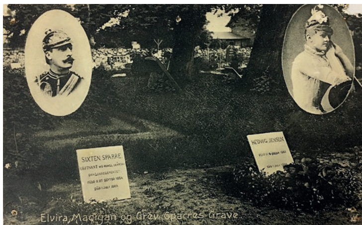
Elvira, Madigan og Sixten Sparres Grave

Ældre foto af Landet Kirkegård, der viser den oprindelige grav. Begge gravplader er lyse med tydeligt optegnet skrift. Det tyder på, at der er foretaget en retouchering af billedet. Postkort fra 1908, Taasinge Lokalhistoriske Arkiv.