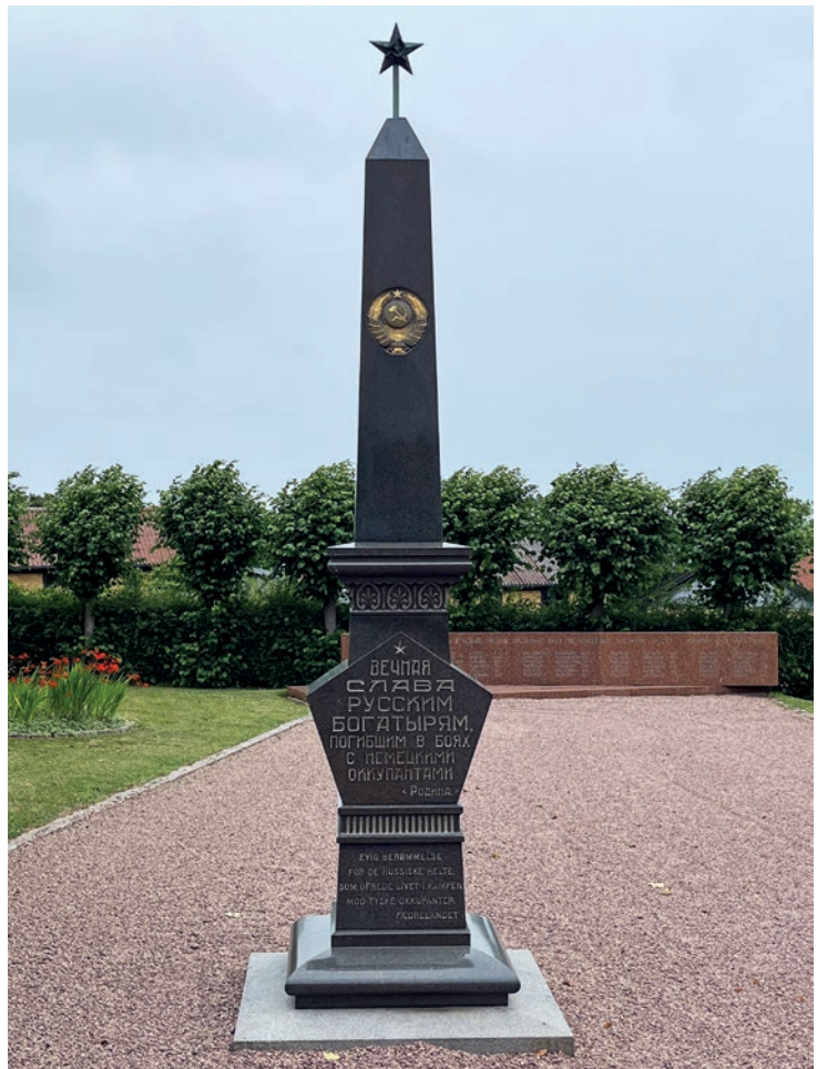
Obelisk i granit, Den Russiske Kirkegård i Allinge, Bornholm, 2022.

Gravstederne vandaliseres af politiske årsager, og en ny dimension føjes til betydningen – de er blevet en politisk kampplads. Men handlingen giver også anledning til at se