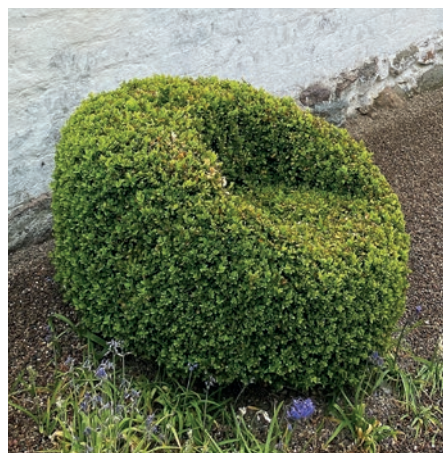
Beldringe Kirkegård.