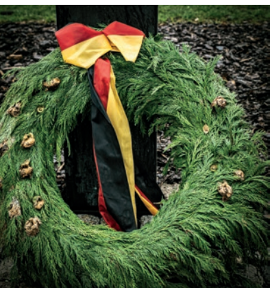
Krans på tysk krigsgrav på Vestre Kirkegård i København.

ter som "... fra øst og vest nedkæmpede nazismen". 31 Fokusset på den bornholmske mindehøjtidelighed var sandsynligvis en slet skjult kritik af det øvrige Danmarks ensidige fokus på de vestallierede.