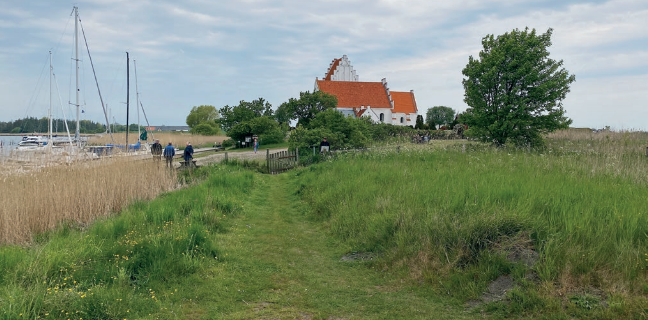
Jungshoved Kirkegård.