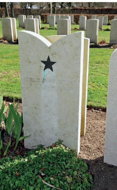
Sovjetisk krigsgrav i Fovrfeld Gravlund.