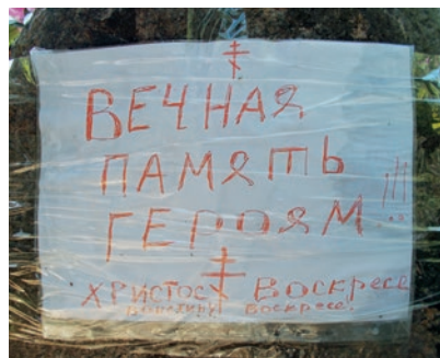
Evigt minde til heltene!!! Kristus er i sandhed opstanden!

Den russiske ambassade er blevet grundigt orienteret af Teknik og Miljø, Aarhus Kommunes Kirkegårde, om sagen og