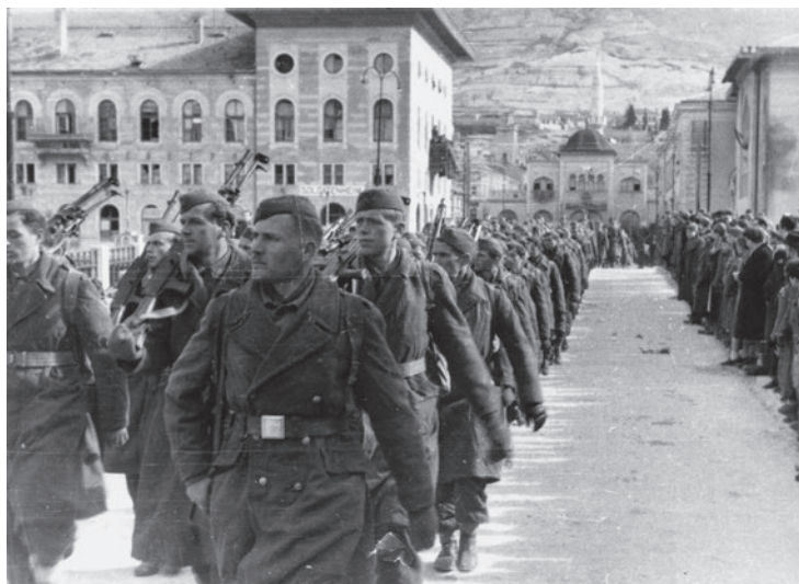
Medlemmer af det 8. korps af partisaner fra Jugoslaviens nationale befrielseshær (NOVJ) marcherer gennem det befriede Mostar i februar 1945.

partisanerne bl.a. syv franciskanere og smed ligene i Neretva-floden, der går gennem byen. Efter krigen genopstod Jugoslavien som en kommunistisk føderation, hvor kroatisk nationalisme på lige fod med al anden nationalisme blev holdt nede. Partisanernes helterolle stod ikke til diskussion, og i 1965 var tiden kommet til, at Mostars faldne partisaner skulle æres med et monument.