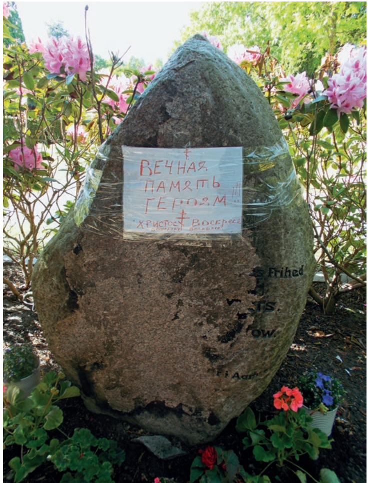
Det ødelagte oprindelige gravminde over to sovjetrussiske krigsfanger med ny tekst, maj 2023.

delte han, at ambassaden ville lade opstille to officielle formstøbte gravsten med de afdødes data. Som sagt, så gjort; men det ses ikke i sagen, om stenene blev opstillet 1951 eller året efter. De to sten indgik i 1950'erne sammen med tusindvis af andre autoriserede gravsten i USSR's kampagne i Vesteuropa for at cementere den sovjetrussiske andel i sejren over fascismen. Særligt i Norge på NATO's nordflanke blev det meget magtpåliggende for ambassaden at opstille gravsten på de tusinder af sovjetiske krigsfangegrave langs "Blodvejen". Samtidig gav opstillingen de sovjetiske ansatte mulighed for at tage fotografier af nærliggende norske militærinstallationer. I Danmark befandt sig også en del sovjetiske krigsfangegrave, som uden tvivl har givet ambassaden lejlighed til at se på militære anlæg. Når man nu alligevel var kørt til Jylland. I ugen omkring den 8. maj 2014 befandt den ene af artiklens forfattere sig en lørdag tilfældigvis i nærheden af rus-