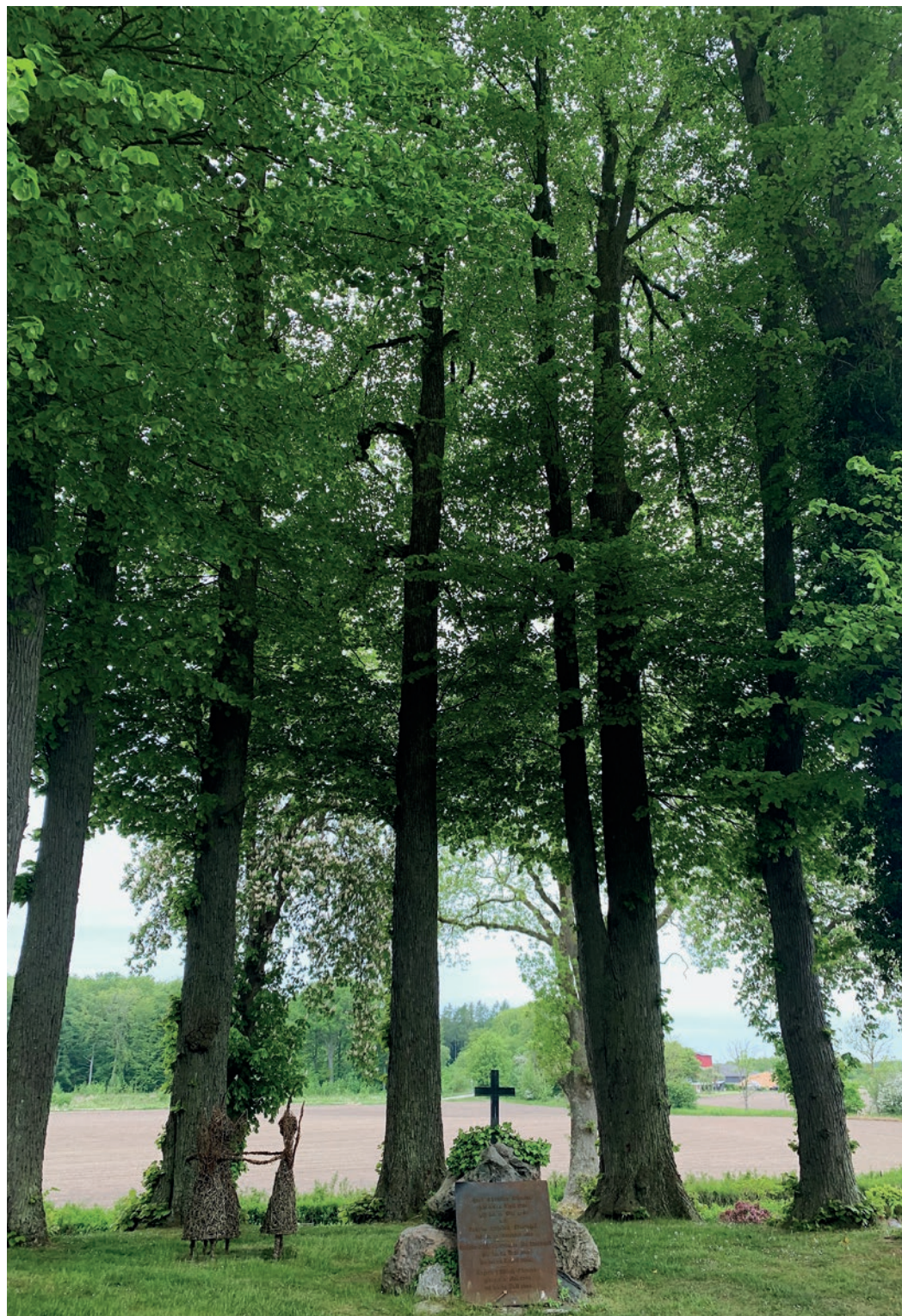
Herlufsholm Kirkegård, linderotunde. Fra årsmødet 2023.