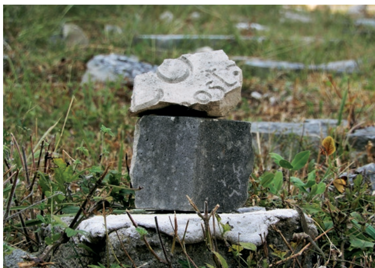
En lille rest af en gravmarkør.

en delt by. På den muslimske side hedder hovedgaden Ulica Maršala Tita , mens flere gader i den kroatisk del er opkaldt efter prominente Ustaša'er. De fleste kroater og muslimer i Mostar undgår hinanden. Børnene går i forskellige skoler og læser forskellige historiebøger. En generation efter den sidste krig kan det derfor heller ikke undre, at unge fodboldfans er hovedmistænkt for at stå bag angrebet på partisankirkegården i sommeren 2022. En lokal bosnisk kroat beskrev gerningsmændene som "Ustašas børnebørn".