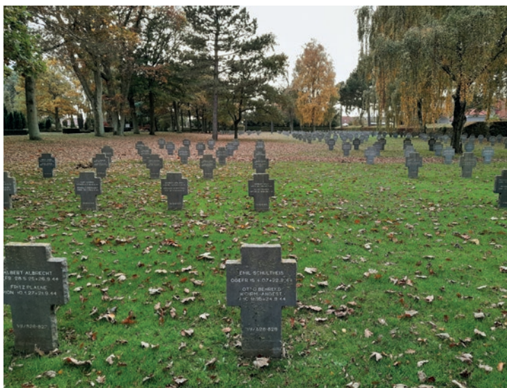
Tyske krigsgrave i Frederikshavn.

De markeringer, som oftest finder sted ved de tyske grave, er, når tyske teenagere gør gravene rene. I 1985 berettede