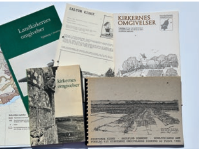
I sidste halvdel af 1900-tallet blev der gjort en stor indsats for at sikre kirkerne i landskabet.