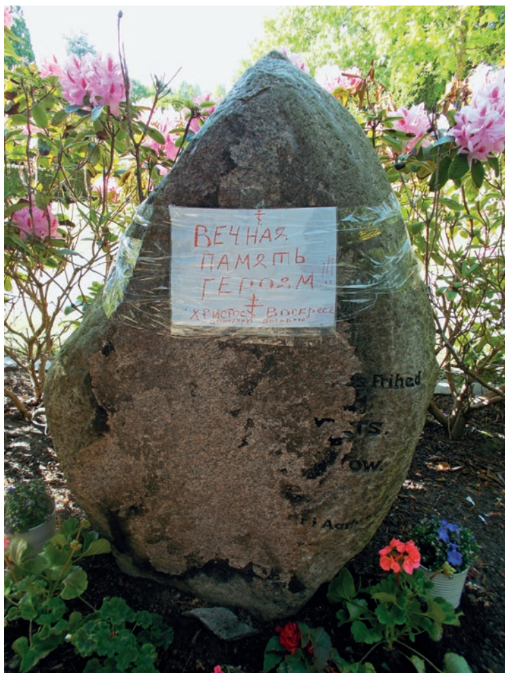
Det ødelagte oprindelige gravminde over to sovjetrussiske krigsfanger med ny tekst, maj 2023.

delte han, at ambassaden ville lade opstille to officielle formstøbte gravsten med de afdødes data. Som sagt, så gjort; men det ses ikke i sagen, om stenene blev opstillet 1951 eller året efter. De to sten indgik i 1950'erne sammen med tusindvis af andre autoriserede gravsten i USSR's kampagne i Vesteuropa for at cementere den sovjetrussiske andel i sejren over fascismen. Særligt i Norge på NATO's nordflanke blev det meget magtpåliggende for ambassaden at opstille gravsten på de tusinder af sovjetiske krigsfangegrave langs "Blodvejen". Samtidig gav opstillingen de sovjetiske ansatte mulighed for at tage fotografier af nærliggende norske militærinstallationer. I Danmark befandt sig også en del sovjetiske krigsfangegrave, som uden tvivl har givet ambassaden lejlighed til at se på militære anlæg. Når man nu alligevel var kørt til Jylland. I ugen omkring den 8. maj 2014 befandt den ene af artiklens forfattere sig en lørdag tilfældigvis i nærheden af rus-