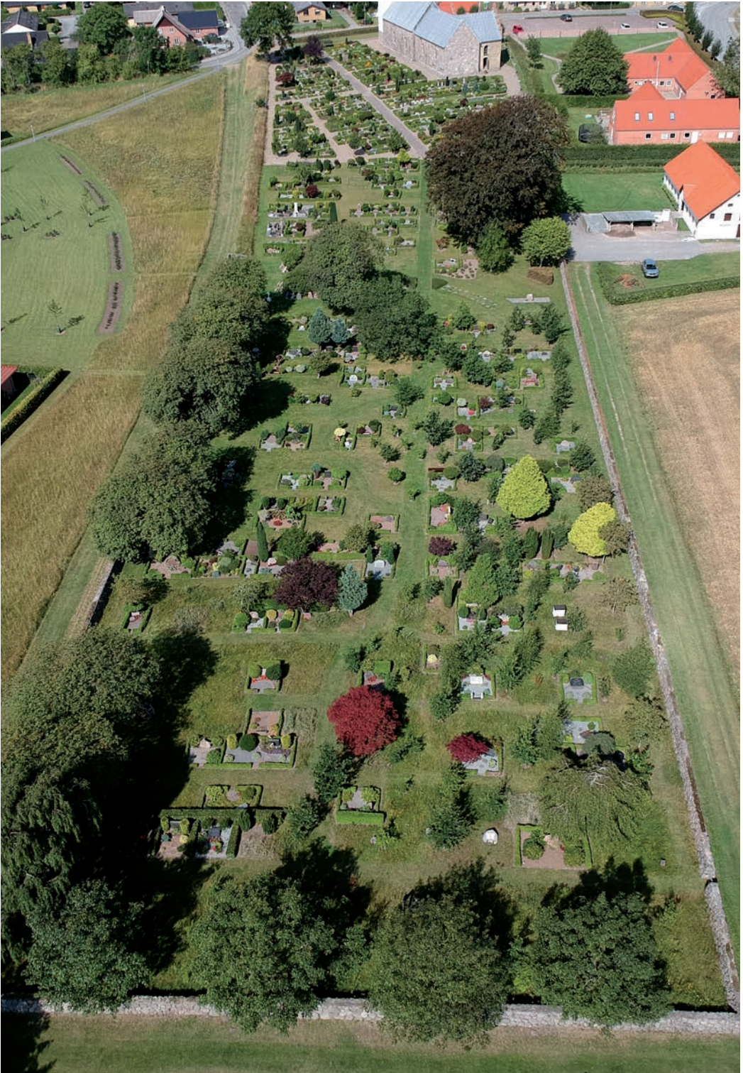
Vester Hassing Kirkegård, dronefoto. Foto: Jens Peter Christensen, 2022.