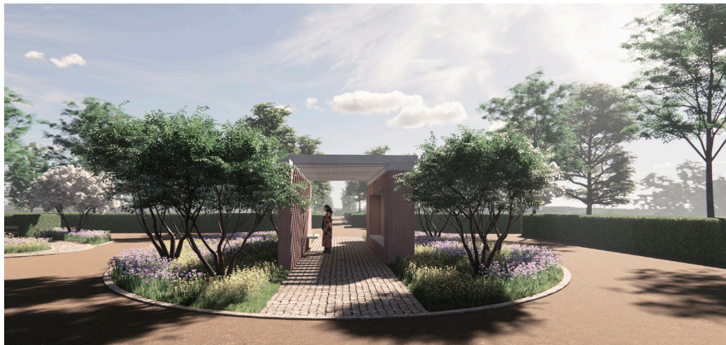
Mindestedet. Illustration: Landskabsarkitekt MAA Birgitte Henningsen/VBM Arkitekter, 2021.

blomsterkranse og større buketter kan anbringes. Korset stikker ud fra facaden over mod kapellet, hvor det fremstår som en ensartet flade i beton.