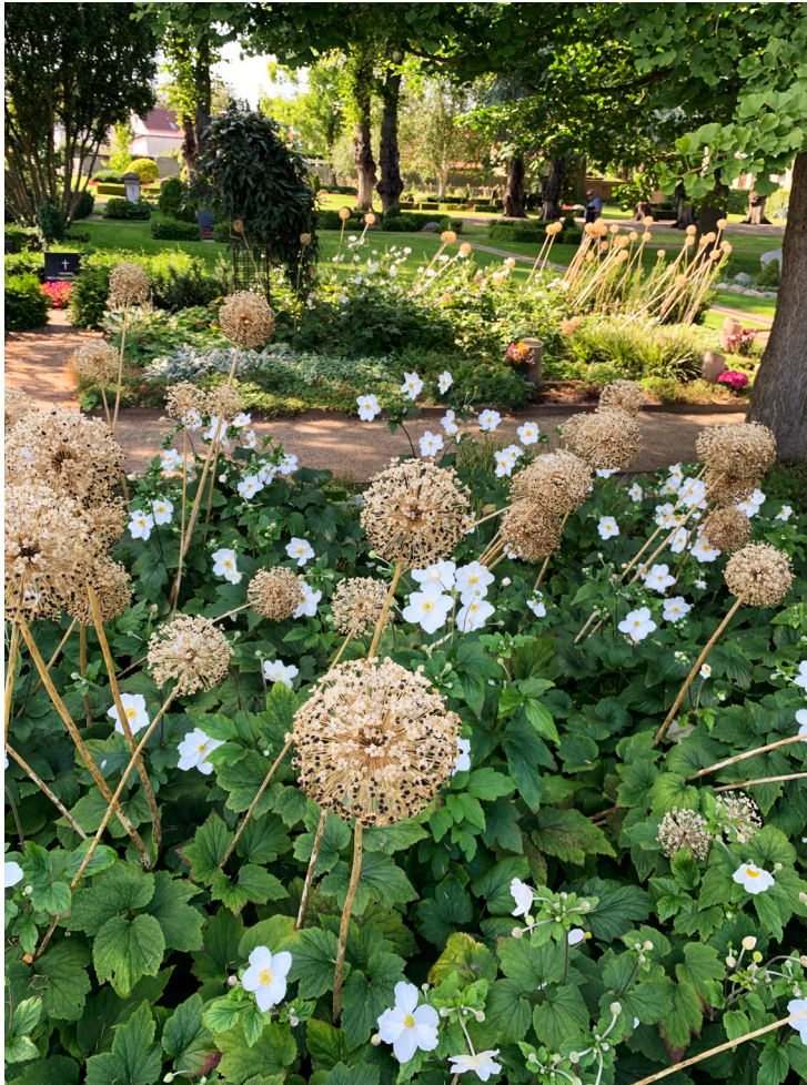
Frödige staudebede i nye gravstedsområder på Nyborg Kirkegård. Fra årsmødet 2021.