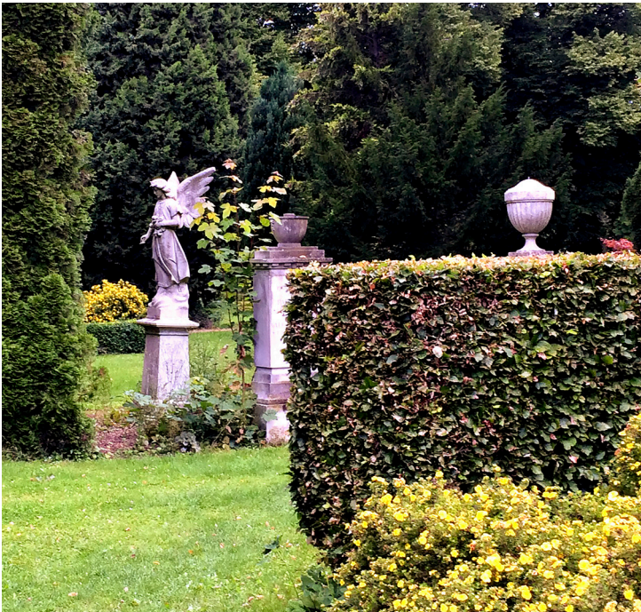
Gravstenen med den stående engel er en af de mest bemærkelsesværdige og stemningssættende gravsten på Sundby Kirkegård. Englen var i flere år "væk", da træer og buske havde vokset sig store omkring den. Under en større beskæring blev gravstenen genfundet, og pludselig kunne en af de rutinerede driftsmedarbejdere godt huske den bemærkelsesværdige gravsten fra tidligere. Sundby Kirkegård gl. afdeling. Foto: Områdefornyelsen Sundby, august 2016.

I samtalerne med projektudviklingsgruppens medlemmer blev det tydeligt, at der var nogle temaer, som gik igen, når de beskrev stemningen, og at det er summen af disse temaer, som er grundtonen for stemningen på Sundby Kirkegård. Løbende har områdefornyelsen haft et tæt samarbejde med