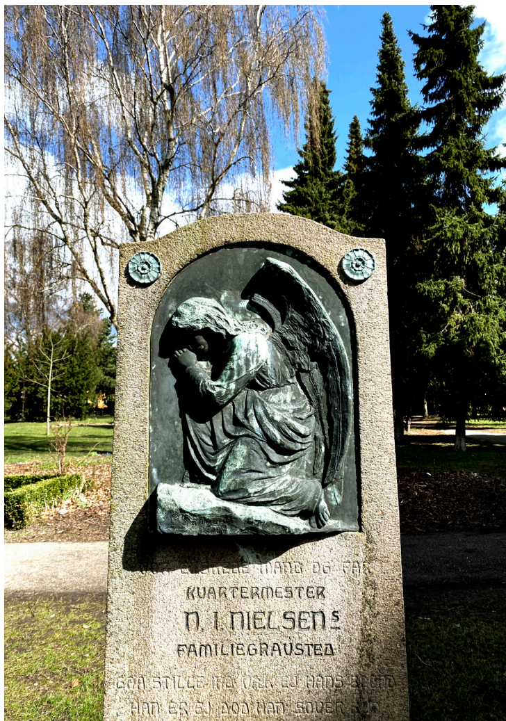
Sundby Kirkegård gl. afdeling. Foto: Områdefornyelsen Sundby, april 2021.

Ud over de ukendte sundbyboere, som er begravet på Sundby Kirkegård, ligger der også markante historiske personer. De, som oftest bliver fremhævet, er de 12 frihedskæmpere, som under krigen holdt til i området nær Sundby Kirkegård. De mistede deres liv i forbindelse med deres modstandskamp. I lokalområdet er der stor stolthed over de begravede frihedskæmpere, der ud over at minde den forbipasserende om frihedskæmpernes vigtige indsats og voldsomme skæbne også minder om, at den by, man bor og lever sit frie liv