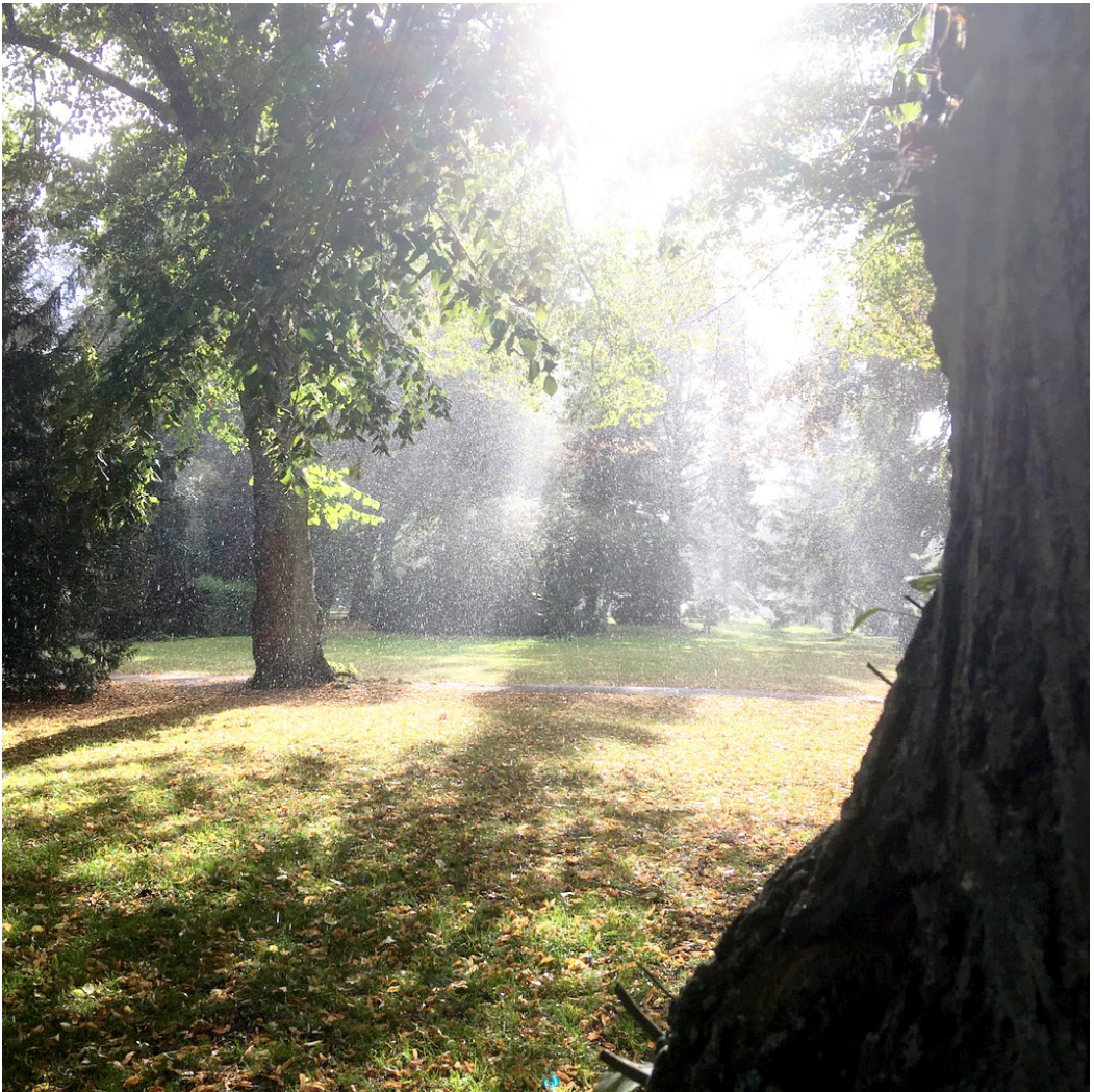
Sundby Kirkegård, gl. afdeling. Foto: Områdefornyelsen Sundby, 2019.