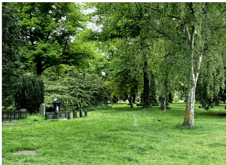
Sundby Kirkegårds ældste afdeling. Foto: Områdeformyelsen Sundby, juni 2021.

Et andet sted på Sundby Kirkegård, hvor den nuværende stemning kan leve videre, vil være Sundby Kirkegårds askefællesgrav, hvor pårørende stadig lægger blomster og tænder lys. Her har de pårørende aldrig været vant til eller haft behov for varige fysiske påmindelser om deres tab og savn, her er rummet og minderne i sig selv nok. Erfaringerne fra andre askefællesgrave, som er blevet taget ud af brug i Københavns Kommune, viser, at pårørende, også mange år efter en afvikling, stadig lægger blomster og sætter lys. Det forventer vi også vil ske på Sundby Kirkegård.