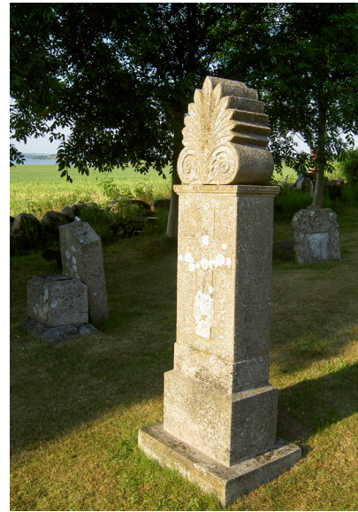
Gravsten fra 1801 i form af en obelisk kronet med en akroterion, som oprindeligt var et ornament placeret på græske tempelgavle. Foto: Anne Marie Møller, 2013.

Løjtnant, Bernt, "Reliktplanter, levende fortidsminder", Botanisk Forening, 2017. https://botaniskforening.dk/wp-content/uploads/2018/04/Rettet-RELIKTPANTER.pdf .