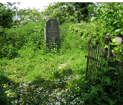
Stærkt patineret gravgitter.

jer, som sjældent ses i det omfang på en landsbykirkegård. Tilknytningen til Rolsøgård er ligeledes bemærkelsesværdig, idet langt de fleste af Rolsøgårds ejere i perioden fra 1816 og til i dag ligger begravet her. Gravmindernes tilstand varierer fra velbevarede til meget forfaldne.