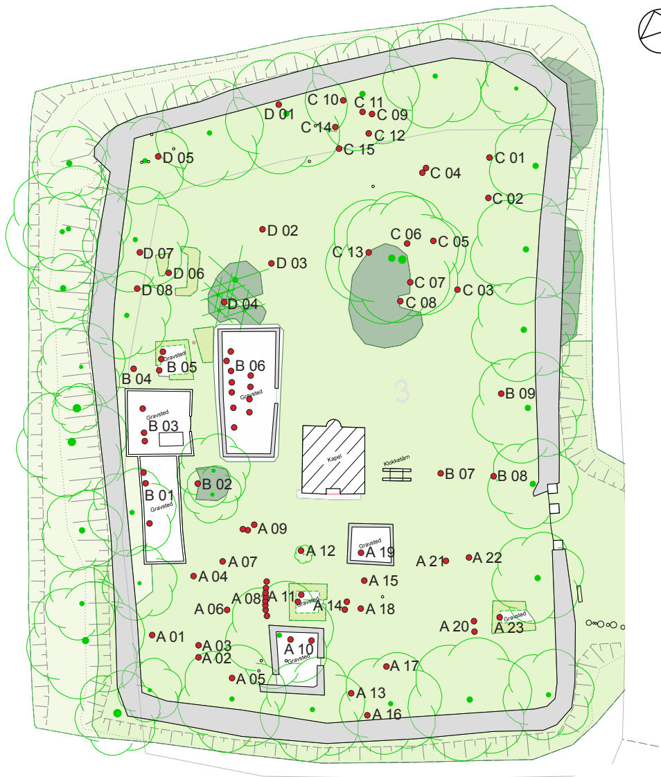
Rolso Kirkegård, kort over gamle gravminder, mål 1:500. Numre henviser til en udførlig registrant. Møller & Fauerskov Landskabsarkitekter, august 2020.