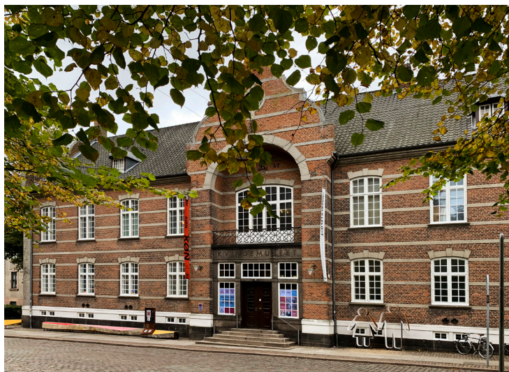
Det gamle rådhus i Aarhus.

delsen." Det fremgik af referatet fra mødet i Aarhus Stiftstidende dagen efter.