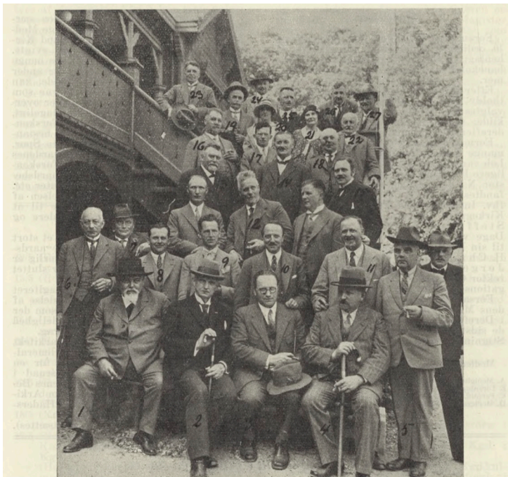
Nogle af Deltagerne i Rundturen til Roskilde, fotograferet ved Boserup Pavillon.

Deltagere i årsmødet i Roskilde 1932. Fra Vore Kirkegårde 1932.