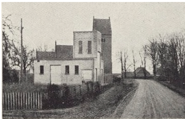
Fig. 107. Majbølle, Musse Herred, Ny Bebyggelse ved Kirken (Transfor- matorstation).

Kirkernes omgivelser. Illustration fra Vore Kirke- gaarde 1944-46.