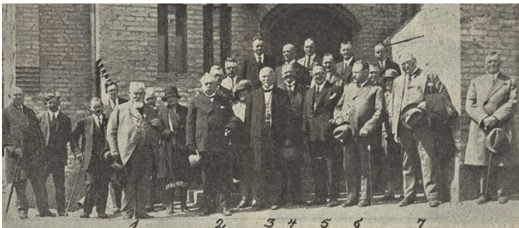
Deltagerne i Rundturen i Odense d. 17. Juni, fotograferet ved Fredens Kirke.

Deltagere i årsmødet i Odense 17. juni 1929. Fra Vore Kirkegaarde 1929.