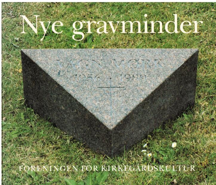
Forsiden af Nye gravminder 1992.

Desuden udskrev foreningen i 1991 en gravmindekonkurrence, hvor en del af de indsendte forslag blev publiceret i bogen Nye gravminder .