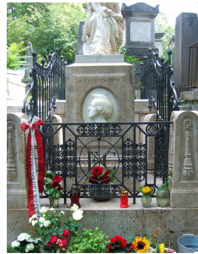
Frédéric Chopins grav på Père-Lachaise kirkegården i Paris.