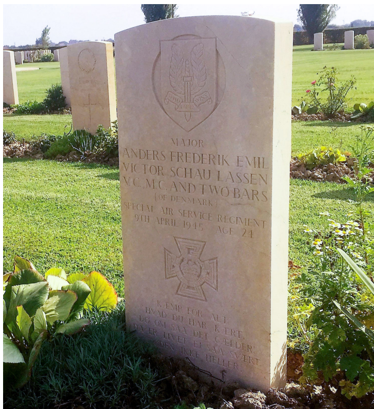
Anders Lassens grav i Argenta.

På østsiden mod Adriaterhavet var de tyske styrker stationeret ved byen Comacchio og på den smalle landtange tæt ved Comacchio by.