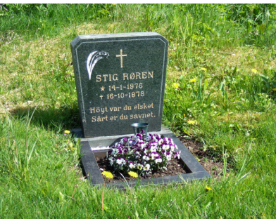
Barnegrav på øen Harøy i Norge.

Når jeg er i Paris, besøger jeg altid P.A. Heibergs grav og ser hans gravsten fra begge sider. Jeg følger sønnens forslag og dvæler et øjeblik.