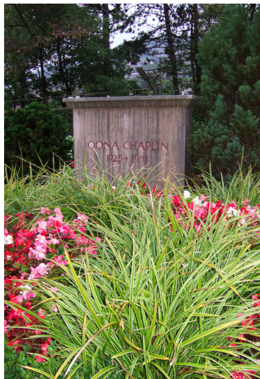
Oona o'Neils grav i Vevey/Corsier, Schweiz.

sende børneflokk. I landsbyen Corsier i kanton Vaud fandt de et stort og velbeliggende hus på en meget stor grund, som blev rammen om familiens liv i resten af Chaplins levetid. Charles Chaplin døde 25.12.1977 og blev begravet på den lokale kirkegård. Oona døde i 1991 – kun 65 år gammel og blev begravet ved siden af sin mand. Jeg fotograferede gravene i 2012.