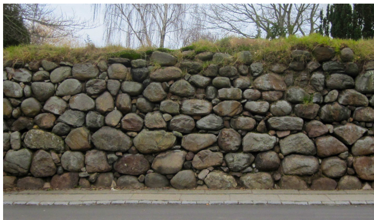
Odder Kirke, Østjylland. Højt dige med ”støbt” kerne. Skiftegang i områder og små sten stoppet ind i ”hjørner”.