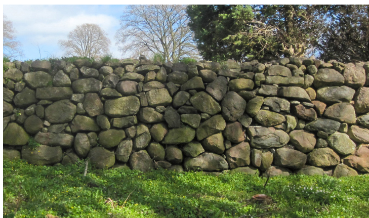
Lyngby Kirke, Øst-Djurs- land. Højt dige med mørtel i kernen som i middelal- dermurværk. Områder med skiftegang og med små sten stoppet ind i ”hjørner”.

afgrænsning af kirkegården. Indimellem viser der sig overraskende forhold, – som i Hørning, hvor der under diget og de synlige bundsten lå et dybt ”fundament” i meget store marksten, der endda var mørtlet sammen med en kalkmørtel – og der var intet i historien eller forholdene på stedet, der kunne forklare formålet med et så formidabelt fundament.