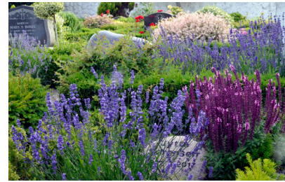
Gravsted med salvie og lavendel. Foto: Mette Fauerskov, 2019.