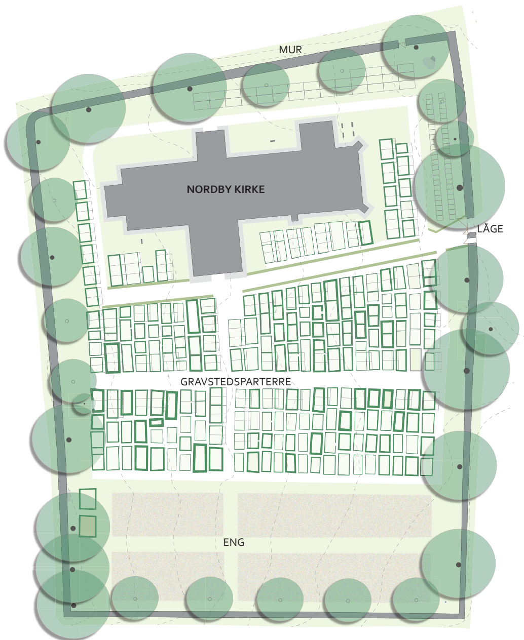
Bevaringsplan for Nordby Kirkegård, mål 1:600, nord opad. Gravstedsstrukturen på de ældste dele af kirkegården fastholdes med hække af varierende bredde og smalle stier, der ikke er retlinede. Den sydligste udvidelse fra 1930-31 omlægges efterhånden til naturgræs. Møller & Fauerskov Landskabsarkitekter, 2019.