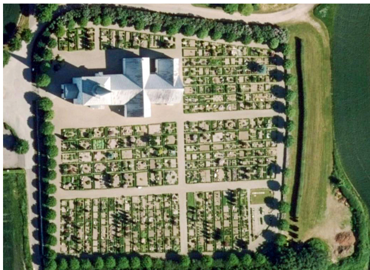
Vilstrup Kirkegård er den eneste anden kirkegård med denne gravstedsstruktur, men her er de smalle stier gennemgående i både nord-sydgående og i øst-vest-gående retning.

Med den nuværende lovgivning kan sikring af kirkegårdenes kulturværdier kun ske på lokalt niveau og med provstiets opbakning. I Nordby indgår bevaringsplanen nu som en del af kirkegårdens vedtægter og er dermed bindende for nuværende og kommende menighedsråd og driftspersonale. Det er et meget stort skridt. Men bestemmelser i kirkegårdsvedtægterne sikrer kun anlægget, indtil et nyt menighedsråd og provsti måtte beslutte noget andet.