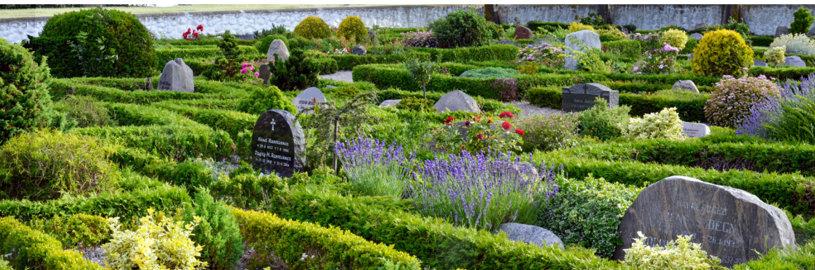
Gravstedsstrukturer er én af de mest sårbare værdier på kirkegårdene. Nordby Kirkegård. Foto: Mette Fauerskov, 2019.

Sikring af de kulturhistoriske og landskabelige værdier de relativt få steder i landet, hvor de endnu findes så helstøbte, har ikke kun lokal, men i høj grad også national interesse. Derfor er det ønskeligt, at der i den kirkelige lovgivning åbnes mulighed for en slags fredning af disse umistelige og yderst sårbare, grønne anlæg.