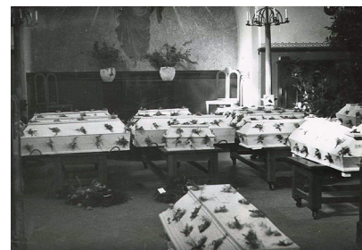
Kister med tyske flygtninge i Vestre Kirkegårds Kapel, 1945.

Du må gerne gå forrest og fortælle kolleger, medarbejdere og frivillige om de initiativer, du har medvirket til, og du må også forsøge at skabe løbende plads til de muligheder, du ønsker afprøvet på sigt. Giv tid til at lade de frivilliges virke-trang slå rod og vær med til løbende at understøtte deres ildhu.