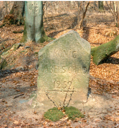
Fig. 7. Mindesten over Kong Abel i Pøl Hegn ved Gttorp Slot.