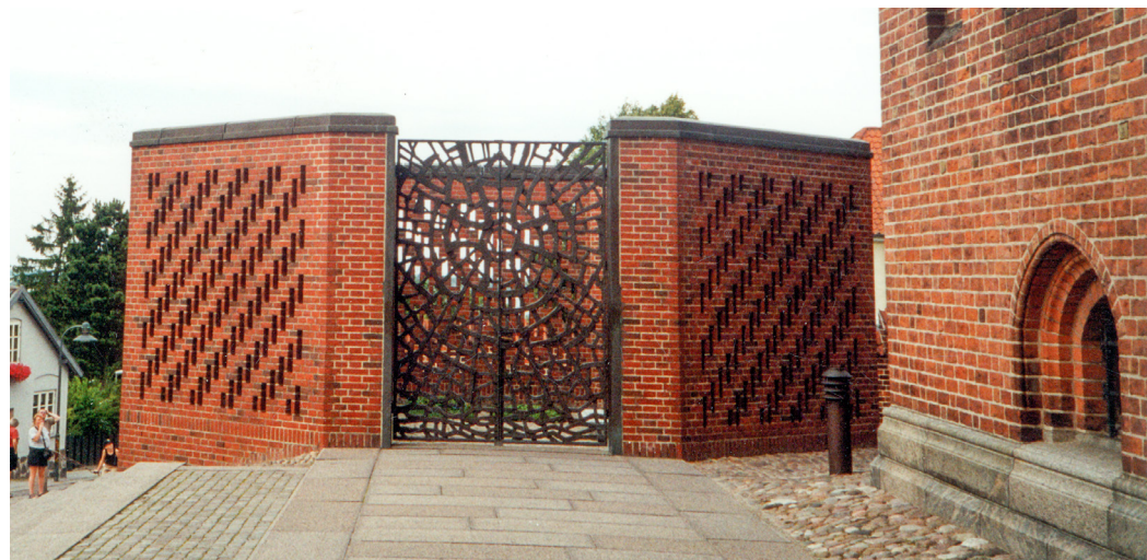
Fig. 12. Kong Frederik og Dronning Ingrid's åbne gravkapel ved Roskilde Domkirke. Foto: Karin Kryger 2002.