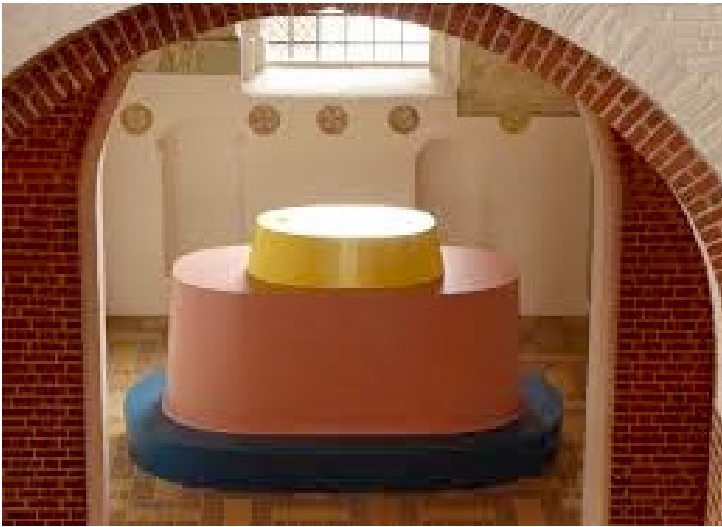
Fig. 3. Sarkofagens tildækning.

ner over den underordnede rolle, han som prinsgemal spillede i forholdet til sin hustru, frustrationer som såvel Storbritanniens Dronning Victorias gemal Prins Albert og Dronning Elizabeths gemal Prins Philip har lidt under, dog ikke med så dramatiske konsekvenser.