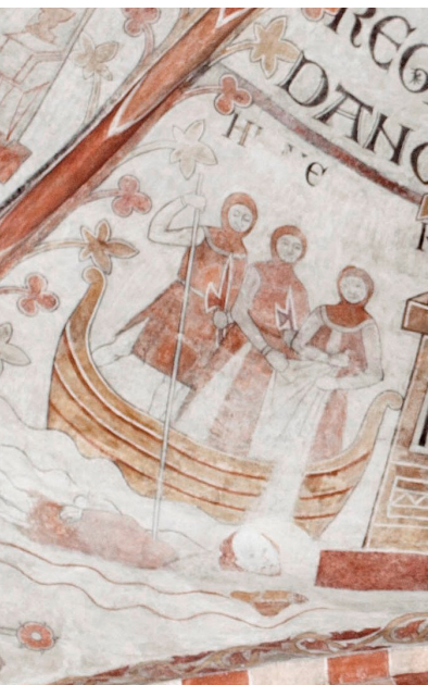
Fig. 5. Mordet på Erik Plovpenning. Kalkmaleri i korsskæringen Ringsted S. Bendt.

døde på Kensington Palace i 1939, 91 år gammel efter et begivenhedsrigt liv (fig. 4). Hun blev bisat med sit brudeslør, uagtet forholdet til ægtefællen ikke altid havde været eksemplarisk. 1 På grund af krigen var ceremonien meget enkel. Hendes jordiske rester blev kremeret, og hendes aske blev i første omgang anbragt i en egekiste i den kongelige gravkrypt i St. George's Chapel på Windsor Castle, hvor mange medlemmer af såvel den kongelige som slægten Argyll er begravet. Men kort tid efter blev hendes aske flyttet til den kongelige begravelsesplads ved Frogmore Kapellet, nær Windsor. Kapellet var bygget som Dronning Victoria og Prins Alberts gravkapel. Jeg har ingen oplysninger om, hvad der var prinsessens bevæggrunde for at lade sig kremere, men da hendes liv havde været temmelig exceptionelt, er det ikke overraskende, at hendes bisættelse også var det.