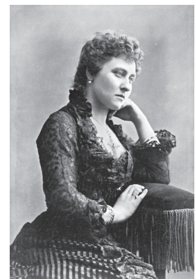
Fig. 4. Prinsesse Louise, hertuginde af Argyll.

Man må rette blikket mod Storbritannien for at få øje på andre kongelige kremeringer. Den første, der i det engelske kongehus blev kremeret, var Prinsesse Louise, Hertuginde af Argyll, datter af Dronning Victoria og Prins Albert. Hun