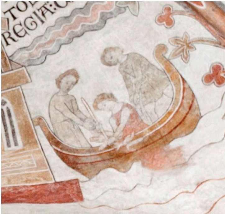
Fig. 6. Fundet af Erik Plovpennings lig. Kalkmaleri i korsskæringen Ringsted St. Bendt.

Kong Abel, der stod bag drabet på sin ældre broder Kong Erik Plovpenning i 1250, faldt i kamp mod nordfriserne to år efter udåden. Mordet er skildret i kalkmalerierne i korshvælvingen i Ringsted St. Bendts (fig. 5 og 6). Angiveligt blev han begravet i Slesvig Domkirke, og den lokale tradition i Slesvig fortæller, at liget i forståelse med Enkedronning Mechtilde blev flyttet fra kirken til et sumpet skovområde bag Gottorp Borg, hvor det blev nedsænket og fik rammet en pæl igen-