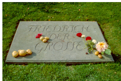
Fig. 11. Frederik den Stores grav i Sanssouci. Foto: Jens Fleischer 2004.

Frederik IX's begravelses anlæg stod færdigt i 1985, 13 år efter kongens død i 1972 (fig. 12). Den oktagonale begravelsesplads er tegnet af Vilhelm Wohlert og er anlagt umiddelbart vest for Glücksborgernes Kapel, der rummer kongens