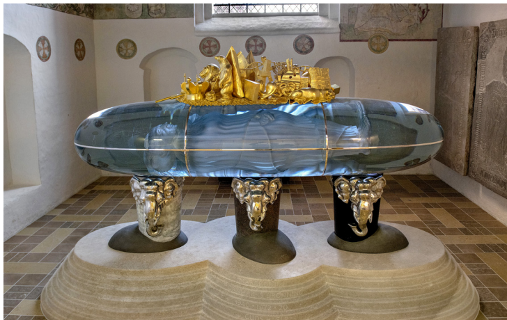
Fig. 1. Hendes Majestæt Dronning Margrethe og Hans Kongelige Højhed Prins Henriks sarkofag i Roskilde Domkirke.

krypt, der var indrettet i kong Frederik den IX's og dronning Ingrid's åbne begravelseskapel ved Roskilde Domkirke. Det havde været forventningen, at Frederik den IX's nærmeste efterkommer også skulle gravlægges her. Jeg vil ikke her komme ind på, hvilke forklaringer, der har været bragt til torvs i den anledning, men meget tyder på, at regentparret har haft et ønske om, at deres gravmæle skulle repræsentere et kunstnerisk udtryk, der var typisk for deres tid som regenter.