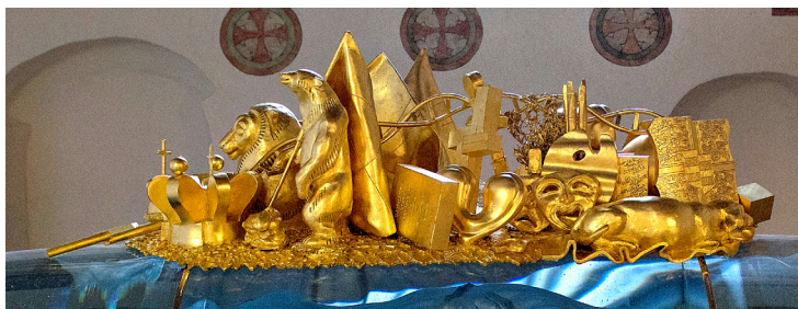
Fig. 2. Detalje af sarkofagens topstykke.

Udarbejdelsen af gravmælet har været undervejs siden 2003, hvor Bjørn Nørgaard fik opgaven med at udarbejde