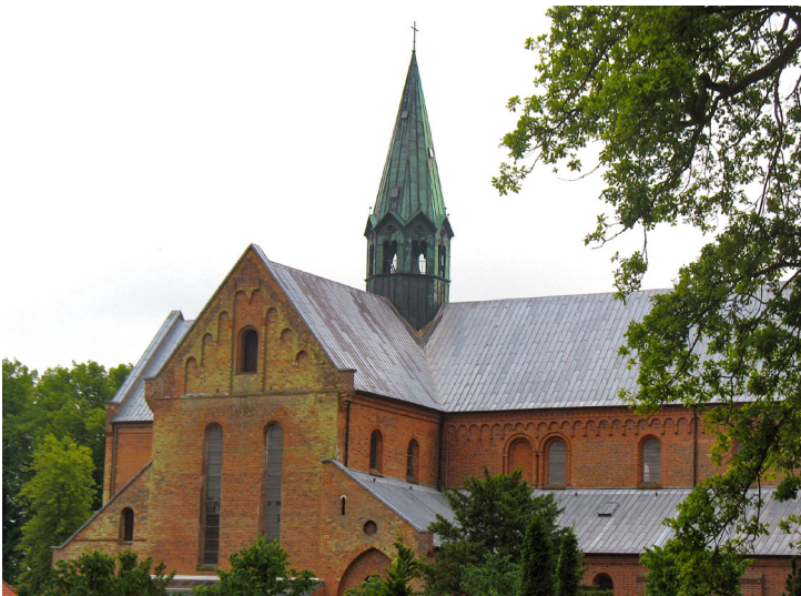
Fig. 9. Sorø Klosterkirke, hvor Kong Oluf II's legeme blev bisat.

1679 døde Kurfyrsten af Kleves statholder Fyrst Johann Moritz af Nassau-Siegen. Han havde allerede i 1663 ladet støbe en jerntumba, hvorunder blev indrettet en gravkrypt. Omkring tumbaen blev bygget to kvartcirkulære mure, hvori blev indfældet votivaltre med gravsten og askeurner (fig.