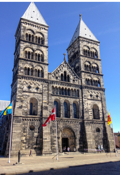
Fig. 8. Lunds Domkirke, hvor Kong Oluf II's indvolde blev bisat.

nem sig. Som grund til flytningen angives, at Kongen ikke kunne finde ro i graven på grund af sin forbrydelse, og at han som genganger skulle have forstyrret de kirkelige handlinger. I skoven skal han som deltager i den 'vilde jagt' være suset gennem luften på en hest ledsaget af hunde. Senere har denne sagnoverlevering bredt sig videre. I skovområdet Pøl Hegn nord for Gottorp Slot står der i dag – dog ikke på det originale sted – en mindesten med indskriften "Abels Grab 1252" (fig. 7). 3