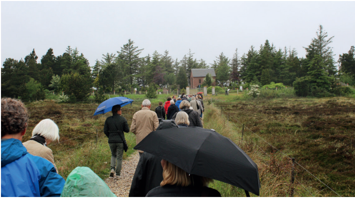
Årsmødedeltagere på Gl. Vorupør Kirkegård. Foto: Hans Mikkelsen 2017.