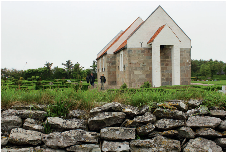
Hanstholm Kirkegård. Foto: Hans Mikkelsen 2017.