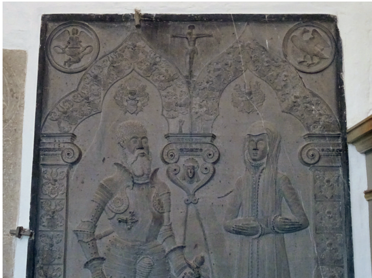
Den korsfæstede Kristus. Detalje fra gravstenen over Oluf Munk og Drude Rantzau i Hjerm Kirke.

Gravstenen er i hjørnerne udstyret med evangelistsymboler. Foroven ses Mattæus (tv.) og Johannes (th.) og nederst ses Markus (tv.) og Lukas (th.). I begge sider ses otte aneskjolde, ligesom der i begge sider ses et kranie som et memento mori. 13 Indskriften i fodfeltet lyder: