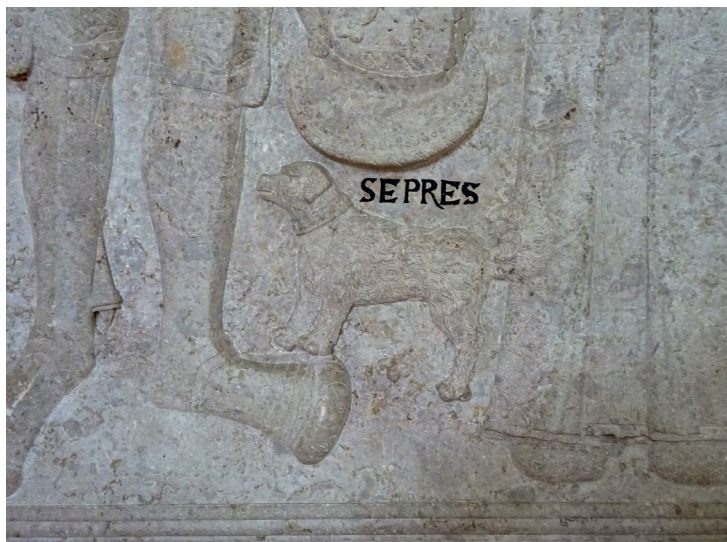
Heltehunden Sepres. Detalje fra gravstenen i Flynder Kirke.

natten var omme, var 14 linjeskibe slået til vrag og omkring 7.000 søfolk og soldater druknet – heriblandt tre admiraler. 22 At Christen Juel slap med livet i behold i forbindelse med flådens tilnærmelsesvis udslettelse den skæbnesvangre nat, skyldes hans og andre skibschefers ulydighed. De trodsede den givne ordre om ikke at stikke i søen for der at ride stormen af, skønt det kunne have kostet dem livet for lydighedsnægtelse. 23