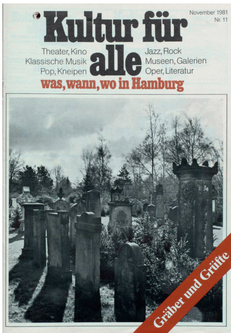
Fig. 5. Forside på magasinet 'Kultur für alle' (November 1981).

Som et af verdens største gravmælegallerier er kirkegården beskrevet som et museum. Jaegers motiv, gravmælegalleri, er ikke grundlæggende nyt. Eksempelvis handler også en tredjedel af Austs bog fra 1954 om kirkegårdens skulpturer. En række af de forskellige Ohlsdorf-guides betegner ligefrem Ohlsdorf som en skulpturpark. 19 Centralt er det, at ingen af Kultur für alle ni artikler handler om kirkegården som et sted for sørgende. Kirkegården er i 1980er-bladet blevet genstand