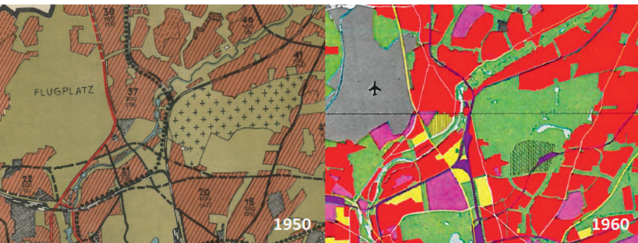
Fig. 4. Kortudsnit over Ohlsdorf fra 'Aufbaupläne' 1950 og 1960.

anses for at være et grønt område. Cordes ville formentlig selv have malet Ohlsdorf grøn ved anlæggelsen i 1877. Men kortet afspejler, at Ohlsdorf lægger sig ind i mellem kategorierne 'grønt areal' og 'kirkegård'.