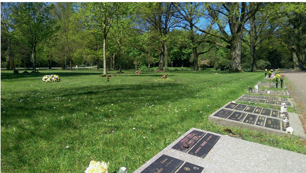
Fig. 6. Omfavnelser af nye begravelsesformer; Skovkirkegård på Ohlsdorf.

Strategipapiret Ohlsdorf Parkfriedhof 2050 indeholder et oprids af kirkegårdens udgangspunkt og tegner et billede af de ændringer, man påtænker at gennemføre for at tilpasse kirkegården til fremtiden. Belægningsfladen, den samlede flade af gravsteder på kirkegården, udgør i dag kun 11 % af kirkegårdens areal og forventes ifølge Ohlsdorfs eget strategipapir at falde med 2 % årligt. De rene grønne arealer udgør til sammenligning 52 %, og balancen vil de kommende år forskydes yderligere. Udviklingen skyldes primært, at andelen af pladskrævende kistebegravelser falder. Andelen af urnegravsteder er derimod i vækst og udgør nu omkring 80 % på de