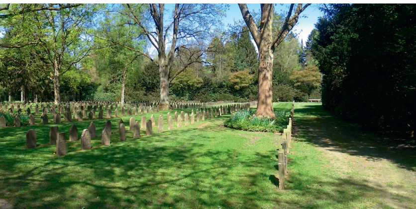
Fig. 2. Tyske krigergrave fra 1. verdenskrig på Ohlsdorf.

Gadamers beskrivelse af oplevelse, som det der sammen-smelter erfaring og liv, er rammende for Cordes: Han beskriver et ønske om en religiøs erfaring i naturen, som Gadamer formentlig har ret i, har sin klangbund i tysk idealisme og tysk romantik. På samme måde holdes kirkegårdens praktiske funktion som kirkegård for sørgende tilbage til fordel for den, der vil møde naturen. Det er en arkadisk version af kirkegården, et Gesamtkunstwerk , hvor man prøver at få de døde til at fylde mindre, mens de rekreative områder skal fylde mere. Cordes ønsker at tilbyde en oplevelse, og ønsket om at