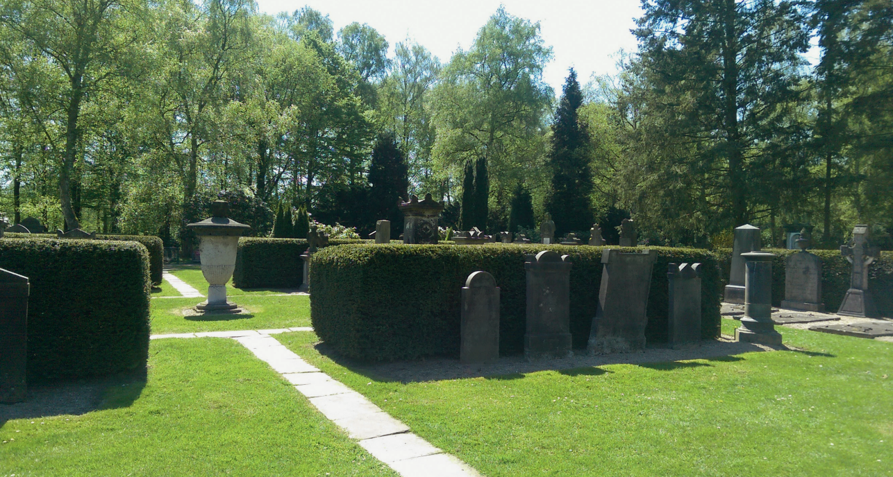
Fig. 3. Freilichtmuseet på Ohlsdorf.

tilbyde en oplevelse hører derfor ikke kun vores tid til, men ses allerede i spæde træk i det industrialiserede Hamborg.