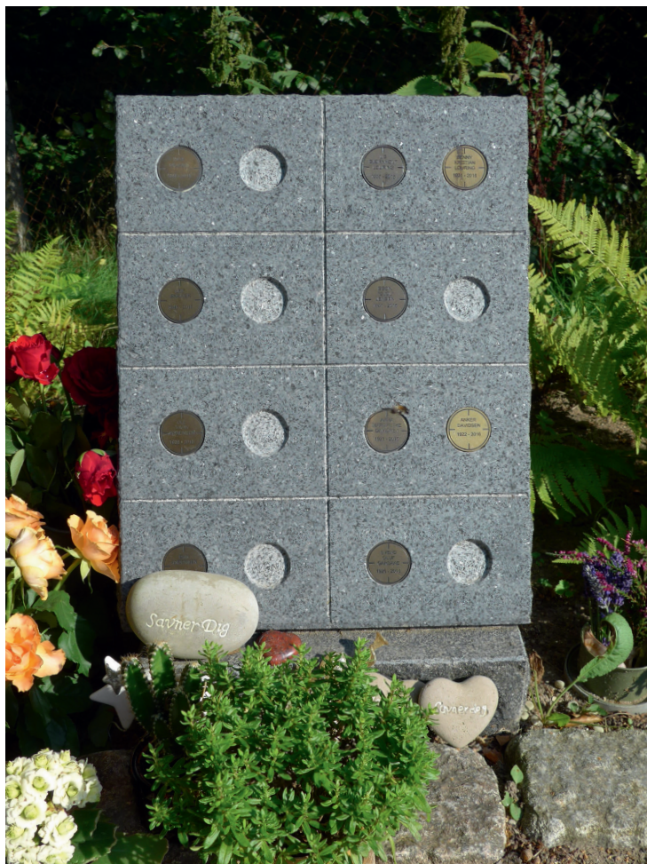
Fig. 3. På skovkirkegårds mindeplads kan pårørende lægge pynt og buketter. Navnemønterne er en tilvalgs mulighed, som vælges af knap halvdelen.

Hvor arealet er egnet til urnenedsættelser, er der et netværk med felter á 1,5 x 1,5 m. Ved hjælp af målepunkter i terrænet kan de enkelte felter, som er nummererede, udmåles. I hvert felt nedsættes 2 urner – træer og disse rødder er en udfordring, derfor anvendes ca. 1 m 2 pr. urne. Afgrænsede områder er udvalgt til salg af gravsteder.