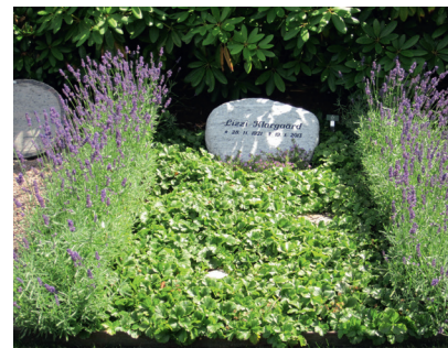
Gravsted med gulddjorbær og kant af lavendler. Gråbrødre Kirkegård, Roskilde Domprovsti.