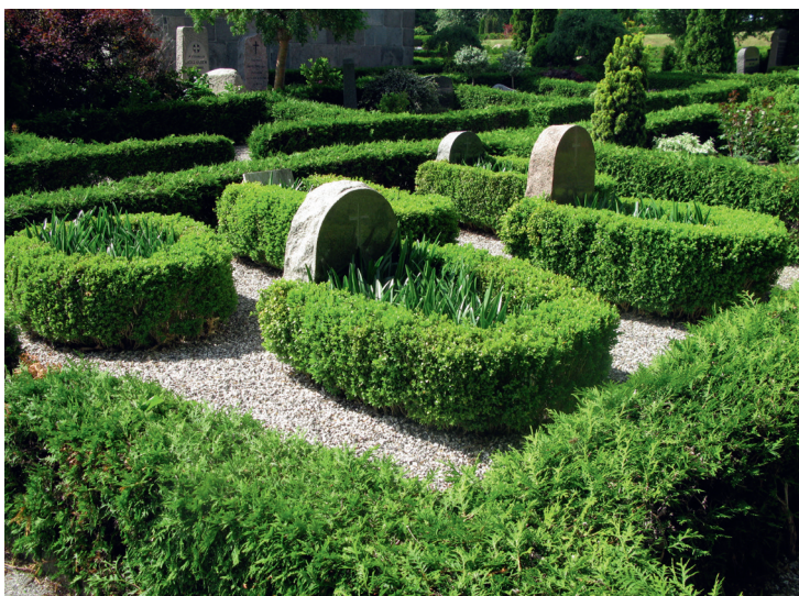
Bevaringsværdigt gravsted hvor de enkelte gravpladser fremstår som senge. Mørke Kirkegård, Århus Stift.

På Løgumkloster Kirkegård er stort set alle gravsteder plantedækkede, siden det i midten af 1980'erne blev indført i kirkegårdens vedtægter, at der ikke må anvendes grus på gravstederne. De enkelte gravsteder med deres store variation af planter udgør et stort tilskud til kirkegårdens dynamiske og frodige helhed først og fremmest til glæde for de besøgende, men også betydningsfuldt for fugle- og insektlivet. Grus anvendes nu kun på hovedstierne, mens de smalle stier mellem gravrækkerne er jorddækkede, hvilket yderligere bidrager til det haveprægede udtryk.