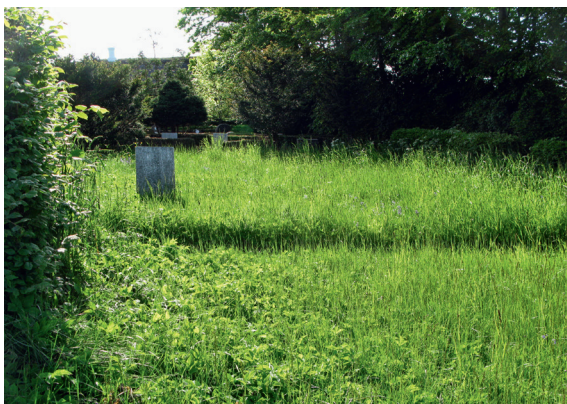
Den nordøstlige del af kirkegården er ikke i brug. Græsset klippes én gang om året. Sneum Kirkegård, Skads Provsti.