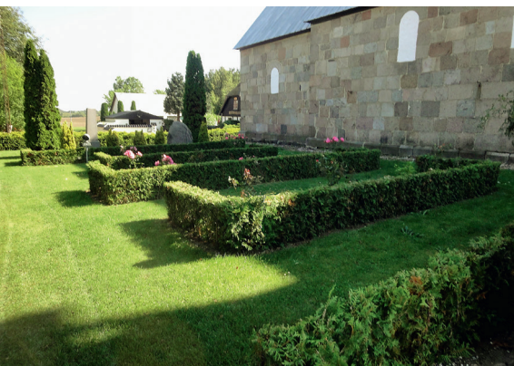
Korte gravsteder i en græsflade nord for kirken. Lyngby Kirkegård, Århus Vestre Provsti.