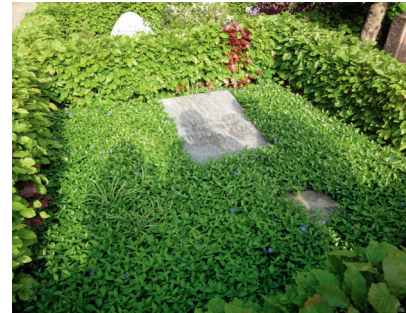
Et stringent formet gravsted med tæt bunddække af vintergrøn. Askov Kirkegård, Malt Provsti.