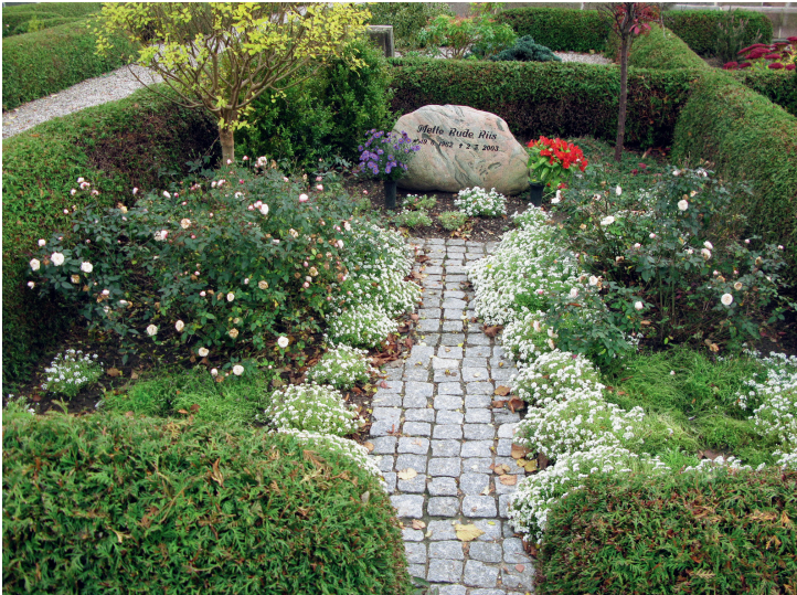
Et romantisk, grønt gravsted med roser og stauder. Mygind Kirkegård, Syd-djurs Provsti.

Der er uendelige variationsmuligheder i valg og sammenstilling af planter. Udbredelse og afprøvning af egnede planter og plantesammensætninger til den enkelte lokalitet er en spændende, gartnerfaglig opgave for graverne, der også er nøglepersoner ved rådgivning om gravstedernes indretning. Tiden er inde til at prøve at få gruset væk fra gravstederne. Eksempler på grønne gravsteder bør være synlige som en del af formidlingsopgaven på enhver kirkegård.