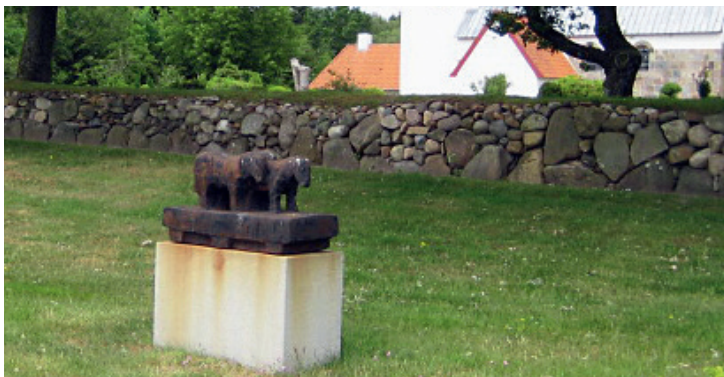
Hestene står uden for Husby Kirkegård. Skulptur af Sigrid Lütken.

Hvis kirkegården er en seng, er den et sted, hvor man kan forvente ro og ingen hast. Her har vi sat træskoene. Hestene står udenfor. Cyklisten cykler videre. Her er ro. Både den beskyttelse, som kirkegårdens hegn giver, og den visuelle harmoni har betydning for, at vi levende kan finde denne ro og være uforstyrrede tilstede.