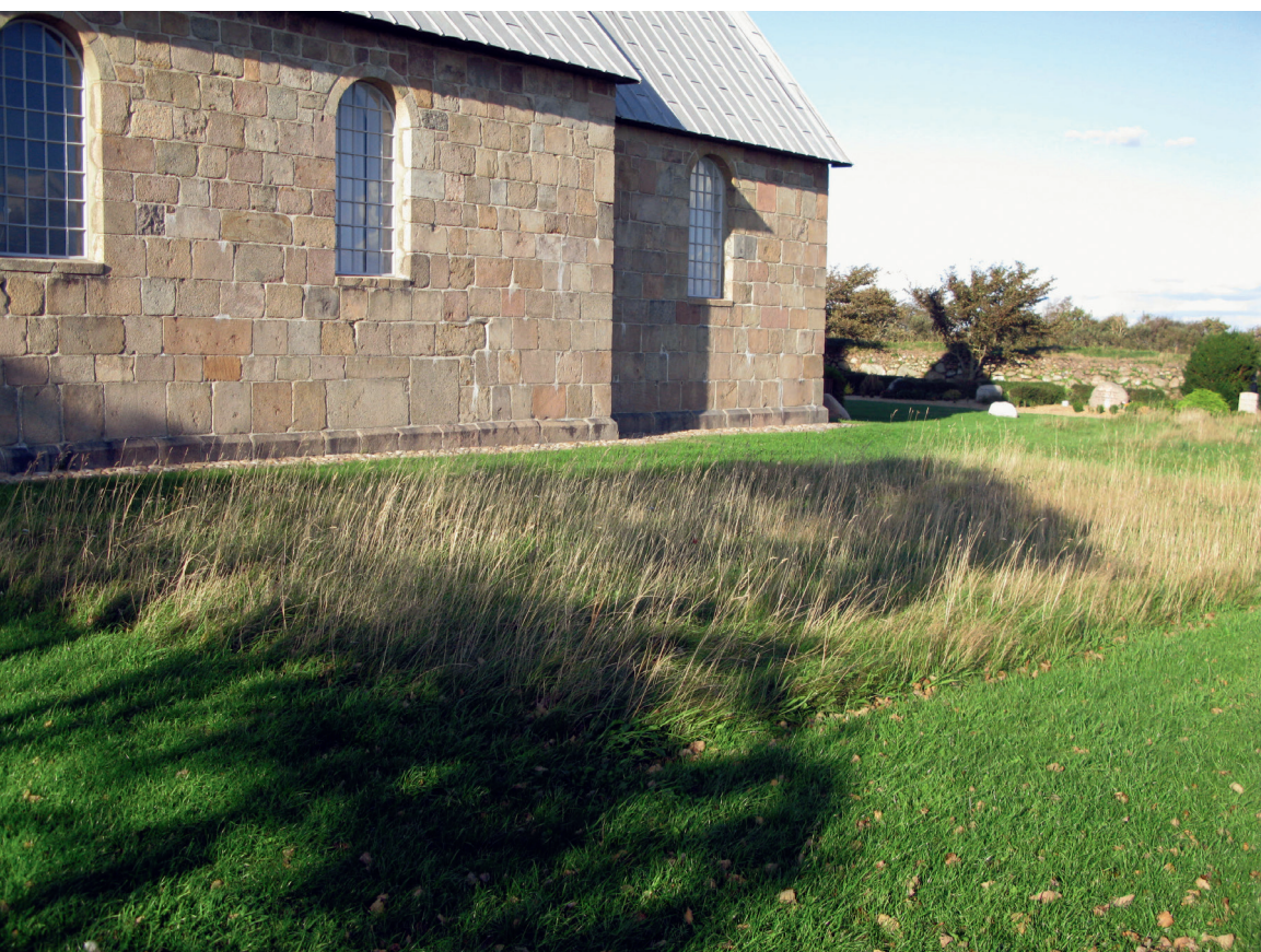
Et felt med højt græs omgivet af klippede græsstier på Gammel Sogn Kirkegård, Ringkøbing Provsti.