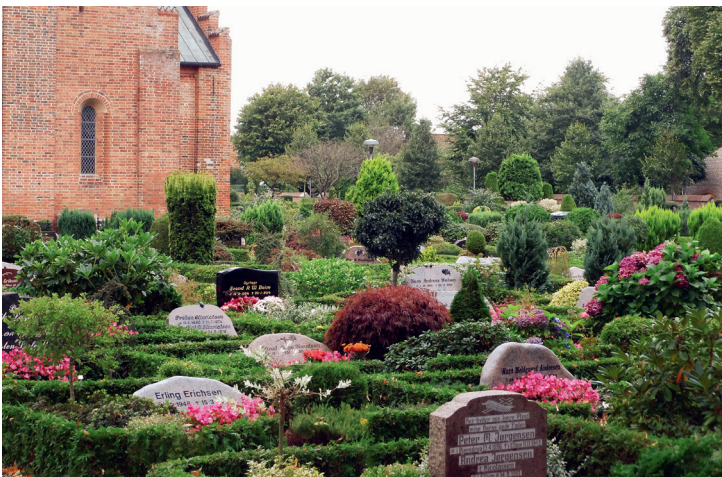
På Løgumkloster Kirkegård anvendes ikke grus på gravstederne. Gravstederne bidrager med megen frodighed og variation.