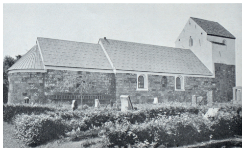
Sejerslev Kirkegård set fra nordøst 1936.