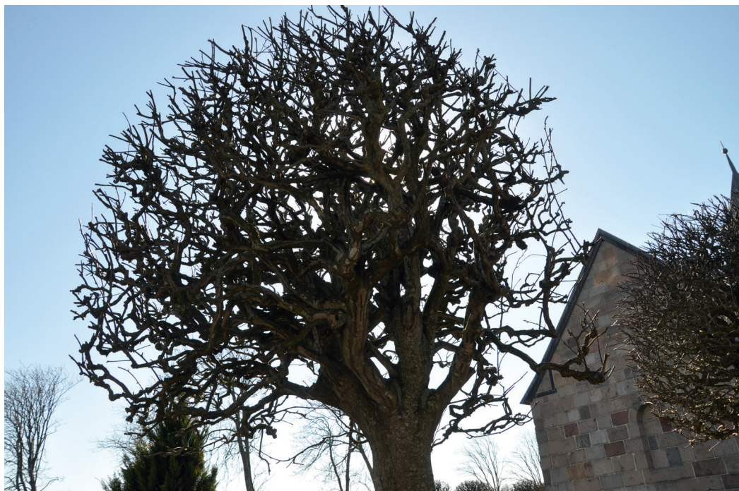
Nors Kirkegård. Aalborg Stift. Alléens kugleklippede kroner har skulpturel virkning året rundt.

i adskillige sogne først afsluttet sidst i 1940'erne. I gravrækkerne anlægges de rektangulære gravsteder, hvor familiens individuelle præg blev markeret med hensyn til gravstedets størrelse og udstyr. Det naturlige, ujævne terræn blev terrasseret således, at gravstedsparcellerne fik en plan flade. Gravminderne er gennemgående stenhuggerhåndværk på et meget højt niveau. Da befolkningstilvæksten i landsognene var på sit højeste, blev arealerne udnyttet maksimalt med gravsteder anlagt på alle skæve hjørner og helt op mod digerne. Ofte er kirkegårdene blevet udvidet. Udvidelserne har ikke altid været velovervejede, idet der alligevel ikke var behov for dem. Sognets senere faldende folketal kan også have bevirket, at behovet for kirkegårdsudvidelsen ikke længere er til stede.