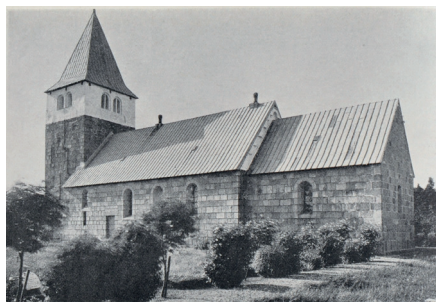
Nors Kirkegård 1935. Nyplantet allé.

Parcelkirkegårdens struktur er opbygget over stierne fra den endnu ældre kirkegårdstype fra før 1800. Det drejer sig om stier, som fører fra kirkegårdsindgangene til kirkedøren. Desuden er de øst – vestvendte rektangulære kistegrave og gravsteder, der er udlagt i to rækker for hver sti, grundlæggende for strukturen. Parcelleringen tog fart omkring 1900 og blev