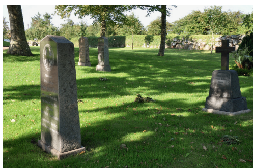
Vust Kirkegård 2015, Aalborg Stift. Hjemfaldne grave, hvor gravminder bevares for at undgå en næsten tom kirkegård.