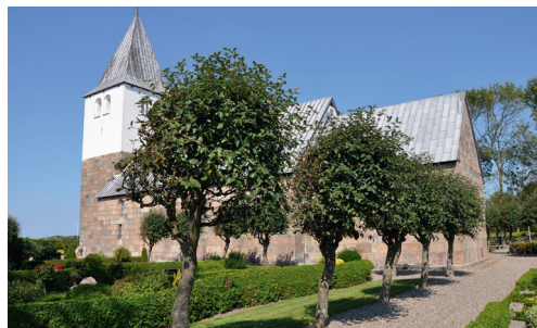
Nors Kirkegård 2015. Alléen godt 80 år efter plantningen.