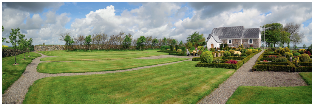
Alsted Kirkegård 2015, Aalborg Stift. Mange grave er nedlagt på kirkegårdens ydre områder. Stierne er endnu bevaret. Det overvejes, om fremtidige grave skal samles omkring kirkebygningen eller ligge spredt på kirkegården.