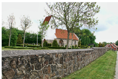
Tapdrup Kirkegård 2013, Viborg Stift. Nogle kirkegårdsmure af kløvet granit bør bevares.

ge lovgivningen. Der er tendens til, at alle hjemfaldne gravminder bliver set som det mest værdifulde på kirkegårdene, og at de samles i minikirkegårde og lunde eller omkring kirkegårdens hovedsti som et selvstændigt oplevelseselement. En sådan opstilling giver et falsk billede af kirkegårdens hovedfunktion som aktiv begravelsesplads. På kirkegårde med få grave kan gravsten fra hjemfaldne grave blive stående på det ryddede gravsted for derved at bevare mindet om en kirkegård, der tidligere har været mere anvendt, som det for eksempel ses på Vust Kirkegård.