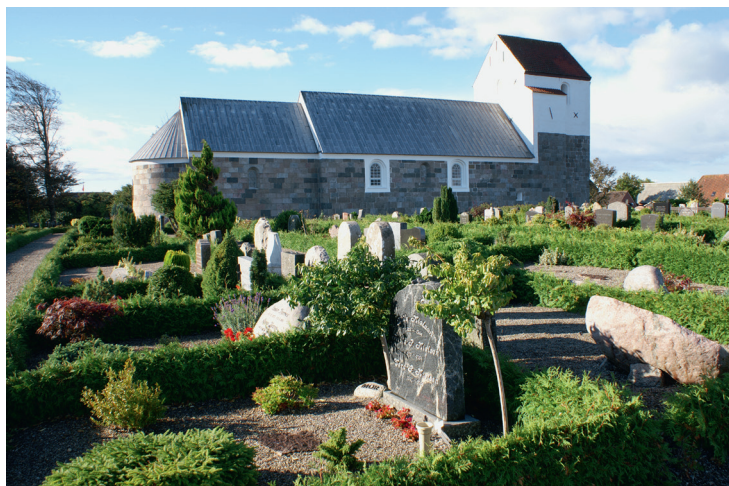
Sejerslev Kirkegård set fra nordøst 2013. Aalborg Stift.

forløbet over 140 år på Sejerslev Kirkegård. Endvidere er udgangspunktet, at kirkegårdene skal afspejle et langt historisk forløb, og at et udvalg af de mest værdifulde kulturværdier skal bevares. Målet om både at bevare og forny indeholder modsætninger, som det er en udfordring at forene på kirkegårdene.