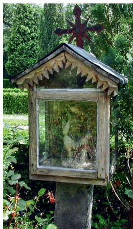
En af mange små detaljer på Maribo Kirkegård. En træfigur af Jesus i et lille glashus. Det er et supplement til et af de mange katolske gravsteder, som findes overalt på Lolland-Falsters kirkegårde. De vidner om Lolland-Falsters helt særlige historie med en stor polsk indvandring i årene omkring år 1900. Både gravsten og træfigur er bevaret.

udarbejdet en vejledning til arbejdet med at registrere gravminder. I den blev der opstillet en lang række udvælgelses-kriterier, der skal ligge til grund for udvælgelsen af gravminder, der må anses for at være bevaringsværdige. Der blev peget på 8 kriterierne, de er beskrevet i det følgende. Efter hvert kriterie er der beskrevet, hvordan vi har arbejdet med det pågældende kriterium i vores udvælgelse af gravminder på Lolland-Falsters kirkegårde.