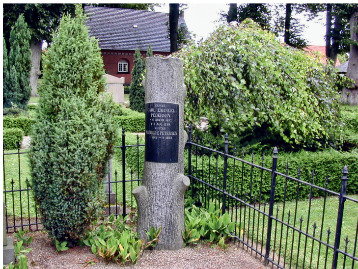
Et fint gravminde i formen livets træ over Kaj Munks biologiske forældre. Der er plads fornedet på pladen, efter sigende til den lille Kaj, der var et svageligt barn. Heldigvis blev der ikke brug for pladsen.

lokale arkiver arbejdet særligt med de afdødes historie, som dermed er kommet med i registreringerne.