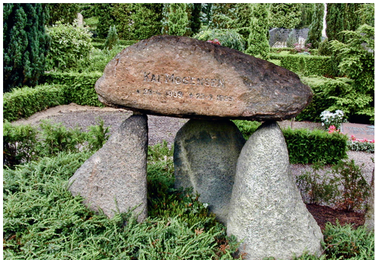
Et fint eksempel på et gravminde, som i sin udformning er meget særligt. Den klassiske stendysse, som i virkeligheden er symbol på oldtidens gravminder.

Museum Lolland-Falster kan med serviceeftersynets rapport i hånden nu konstatere, at en meget stor del af de gravminder, vi har udvalgt, ikke længere ville være blevet udpeget efter serviceeftersynets anbefalinger. Vi ville meget nødtigt have undværet den kulturhistoriske eller etnologiske dimension, som de to kriterier udgør. Det er vores opfattelse, at det samme gælder for de mange menighedsråd, vi har arbejdet sammen med. Netop de to kriterier er med til at sikre, at