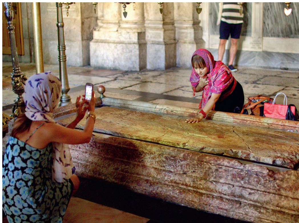
Fotosession ved Salvelsesstenen i Gravkirken.