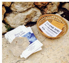
En opfordring til at donere penge i Gravhaven. De fremlagte salme hæfters opfordring til at synges er mere implicit.

Da jeg kommer tilbage, er mine kollegaer temmelig rastløse. Hvor jeg følte mig temmelig provokeret af præsternes adfærd i Gravkirken, er det nu deres tur. Særligt en af dem - hun synes, at der er sådan en provokerende ordentlighed, og at det hele er så kunstigt. Men det er jo bare en have, replicerer jeg, og kan ikke helt se det stærkt provokerende i, at der er stier, der bestemmer, hvor man må gå, og ind imel-