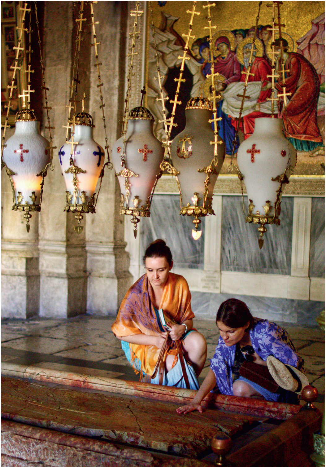
To besøgende i Gravkirken, den ene i dyb koncentration om berøring af Salvessesstenen.