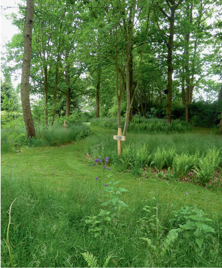
Fig. 3. Torpen Kirkegård, Helsingør stift. 1800 m 2 randbeplantning er i 2012 taget i brug til urnenedsætninger. Her er naturpræg med uklippet græs og bregner. Som gravminder bruges egetræskors.

Engholmkirken , Helsingør stift, er anlagt med skovkirkegård i 1994. Og den er delvist tilplantet med eg, hvorunder der er klippet græs og gravsteder.