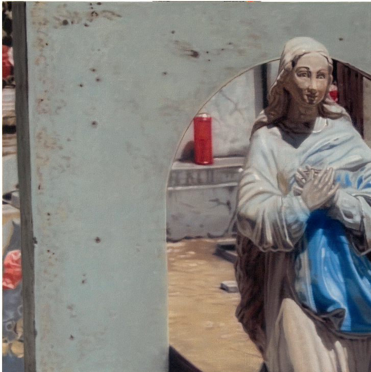
Alle: "Kirkegården i Olévano" af Bjarke Regn Svendsen.