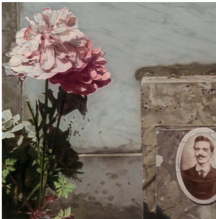
"Kirkegården i Olévano" af Bjarke Regn Svendsen.

I 1979 fik jeg lidt af en aha-oplevelelse, da jeg på Centre Georges Pompidou i Paris så en retrospektiv udstilling af