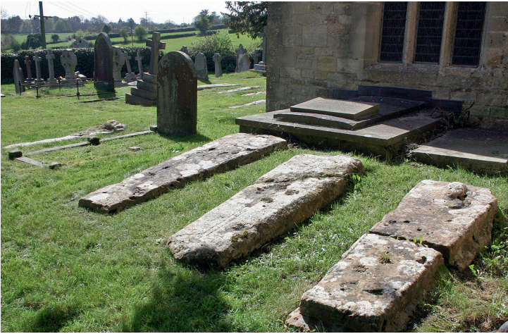
Fig. 7. Gravsten på kirkegården i Limpley Stoke.

ske kirkegårde og kan også forekomme på figursten som ved Leckhampton i Gloucestershire. En række monumenter fra middelalderen, herunder figurstene, ligger spredt blandt mere moderne mindesmærker på kirkegården omkring Durham Katedral. Det hænder, at man støder på monumenter i forbindelse med graves gravning eller byggearbejder. En hidtil ukendt sten kom for dagen i Barnack i Huntingdonshire i 2011, og i 1903 afdækkede gravningen af en grav den eneste bevarede stenplade fra middelalderen i Camery at Wells-katedralen i Somerset. Den blev lagt over det sted, den blev fundet. 17