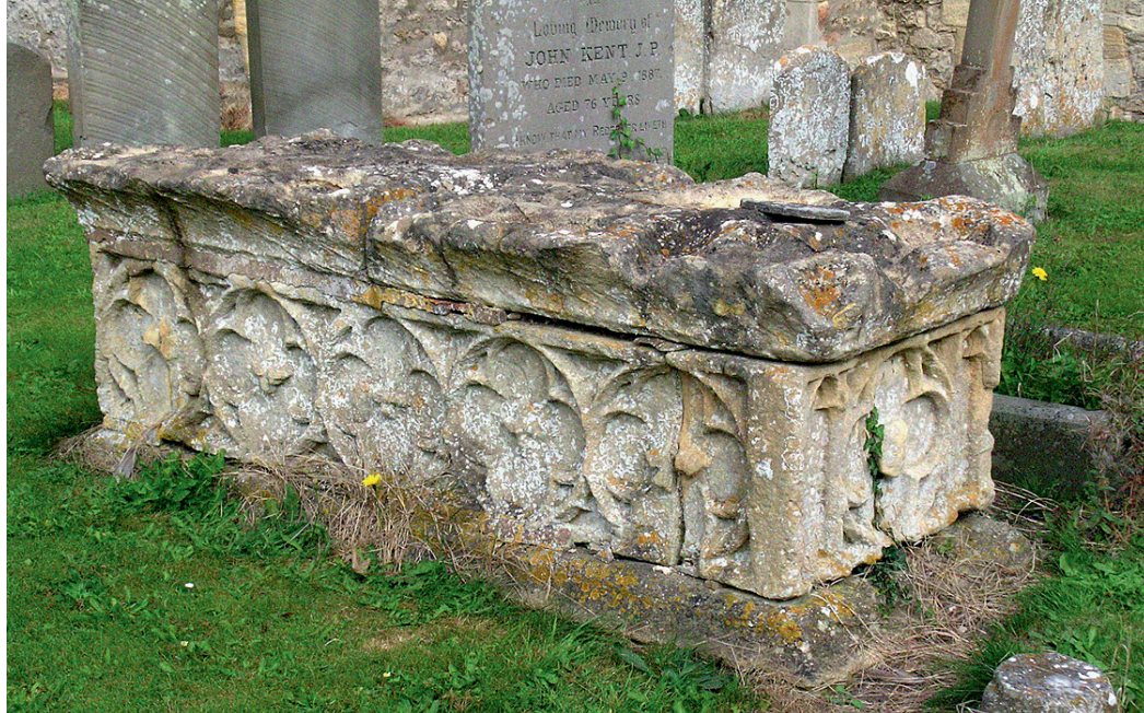
Fig. 13. 15. århundredes sarkofag ved Sutton Courtney.

ved South Cerney i Gloucestershire har en stor piedestal med sokkel formentlig understøttet et kors. En mere kompliceret konstruktion ses i forbindelse med en mandlig figur ved Tetbury i Gloucestershire. I de mange huller og fatninger skulle ekstra elementer anbringes – formentlig kors i hoved- og fodende, mens hullerne i siderne formentlig har været til en særlig, kistelignende bur-konstruktion kaldet en baldakin – det eneste udendørs eksempel, vi kender til (fig. 12). 24 Sarkofagerne kan være vanskelige at datere, men her kan udsmykningen nogen gange være en hjælp, som f.eks. 1300-tals-stavværket på et eksemplar i Loversall i Yorkshire. En sarkofag i Aldwinkle i Northamptonshire har et relief af et 1300-tals-kors på sit tunge læg, men de fleste stammer fra det 15. århundrede, med karakteristiske firkløver-dekorationer [quatrefoils]. Gode eksempler herpå omfatter Sutton Courtney i Berkshire (fig. 13) og et nyligt konserveret matchende par ved Ellington i Huntingdonshire.