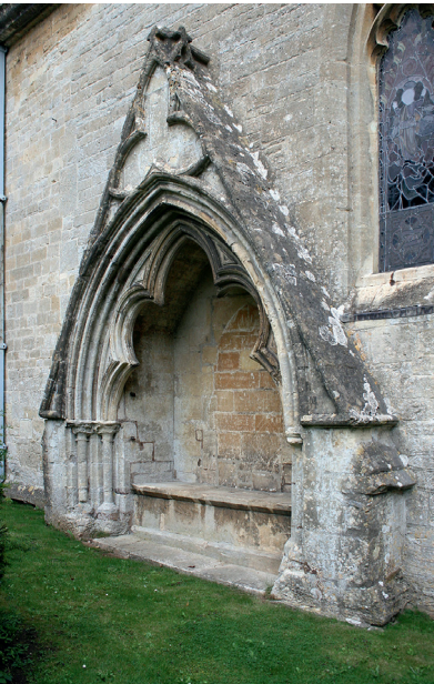
Fig. 14. 13. århundredes gravniche ved Bisley.

ombygninger. At bruge kirkegården er en anden måde at anvende det forhåndenværende, som Roger Elmesley gjorde det. En 1300-tals indskrift på vestsiden af Wells Cathedral beder forbipasserende bede for Johan de Puttenies sjæl (fig. 15). Fra samme tid stammer indskrift og stående skikkelse på tårnet i Water Newton i Huntingdonshire.