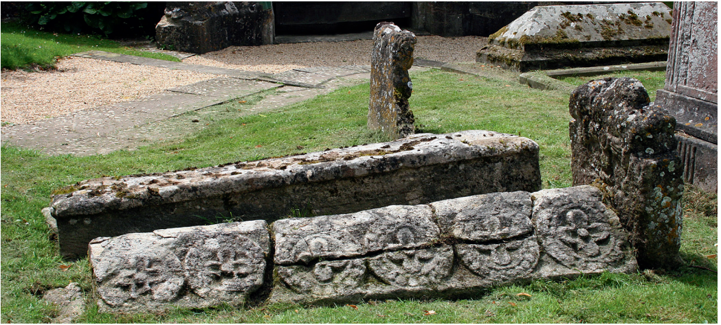
Fig. 8. 12. århundredes gravsten ved Haresfield.

middelalderens monumenttyper, herunder monumenter i messing. I sit testamente fra 1369 udbeder Joan Cobham sig at blive begravet i Southwark ved London "på kirkegården ... foran kirkedøren", under en marmorsten indlagt med messingkors og indskrift. 20