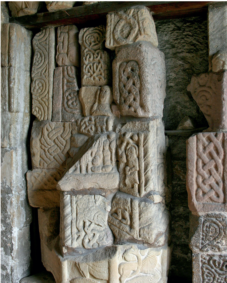
Fig. 5. Et par af stenene bevaret i våbenhuset ved Bakewell.

Kirkegårde kan forblive i brug i mange århundreder, hvor gamle monumenter jævnligt fjernes for at gøre plads til nye. Dette kan ske gradvist i takt med ældre monumenters ned-