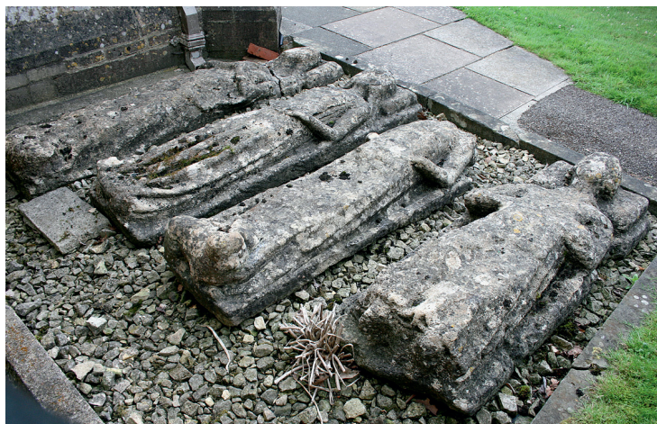
Fig. 11. Figursten på Leckhampton Kirkegård. Foto: B&M Gittos 2011.

en liggende gravsten, selv om både opretstående og flade former forekommer enkeltvis. Vikingetidens gravsten, de såkaldte 'hogbacks', er en særlig afart, der primært forekommer i den nordøstlige del af landet. 21