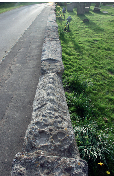
Fig. 6. Gravsten på kirkegårdsmuren i Skipwith.

Rydninger i middelalderen har ofte fundet sted i forbindelse med store byggearbejder, og mindesmærkerne blev nogle gange genbrugt i det nye byggeri. Rekonstruktion af korsarme og tårn i Bakewell i Derbyshire afslørede mere end 300 udskårne sten, der formentlig stammede fra kirkegården, som den så ud i det 13. århundrede. 16 Mange blev genbrugt, men ikke desto mindre er mere end 70 bevaret (fig. 5). Denne rest af den middelalderlige kirkegård viser, at der både var præ-normanniske kors og nyere stenplader. Den 300-400-årige periode, som gravminderne spænder over, svarer til, hvad vi ser på moderne britiske kirkegårde, og afspejler også fundene ved York Minster. Og selv om antallet af sten fundet ved Bakewell er exceptionelt, er der mange andre eksempler på middelalderkirkegårde med en repræsentation af både præ- og postnormanniske monumenter, f.eks. Barnard Castle i Durham med 43 stenplader og Gainford, også i Durham, med 33. Da St Brandon's Brancepeth nær Durham blev raseret af en brand i 1998 blotlagdes omkring 70 gravsten i murene, og 117 fragmenter fra mellem det 10. og det 14. århundrede blev bragt for en dag i forbindelse med nedrivningen og udgravningen af St Mark's i Lincoln. Arkæologerne anså størstedelen af fragmenterne som rester af udendørs monumenter med "tegn på slid og forvitring, der viser, at de har ligget udenfor (formentlig på jordoverfladen)".