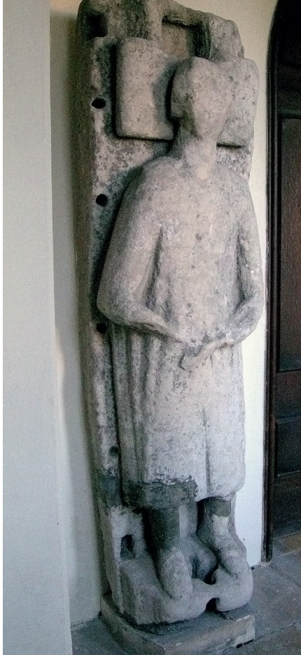
Fig. 12 (tv). Figursten med konstruktionshuller, Tetbury.

14. århundrede, hvilket afspejler den generelle monument-udvikling. De fire figurer ved Brympton D'Evercy i Somerset fandtes på kirkegården i 1757 og var allerede 'medtagne af tiden'. 23 En 1200-tals-stenplade ved Sutton Mandeville i Wiltshire viser Jomfru Maria og Jesusbarnet over afdødes skikkelse, afbildet bedende. Stenen står nu indenfor, men dens oprindelige placering på kirkegården fremgår tydeligt af de to store drænhuller til regnvand (fig. 10). Ved Glinton i Huntingdonshire er der i en 1300-tals-figursten for en skovfoged afbildet med både jagthorn og stav et afslørende drænhul under skovfogedens højre ankel. Hans kvindelige ledsager behøver ingen dræning, men er tilsvarende forvitret og må også stamme fra kirkegården. Ved siden af våbenhuset i Leckhampton er samlet fire figurstene fra det 14. århundrede (fig. 11) og ni andre gravsten. Størstedelen af denne imponerende samling kom for dagen, da man gravede ud til fundament for en udvidelse af kirken.