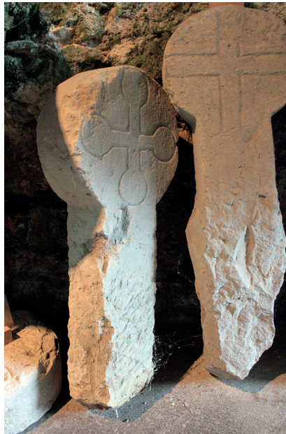
Fig. 10. Figursten med drænhuller, Sutton Man- deville.