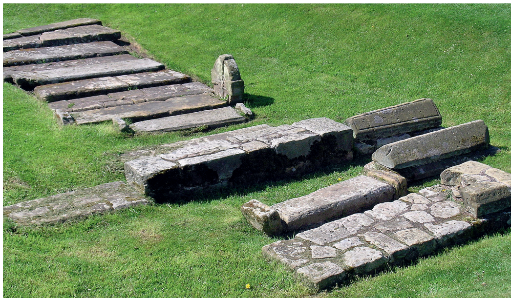
Fig. 4. Whitby Abbey, udgravede gravminder.

århundrede. 11 Omkring 36 begravelser havde spor af gravminder i form af både simple og dekorerede stenplader, uslebne sten lagt over graven samt opretstående kors, sten og stolper. Mange var bevaret, fordi de var blevet beskyttet af aflejringer af byggeaffald, men de ansås for repræsentative for, hvordan grave på den øvrige del af kirkegården har været markeret. Det er denne blanding af tilvirkede monumenter og helt simple gravminder i en række forskellige materialer, som vi mener har været karakteristisk for hele landet i middelalderen.