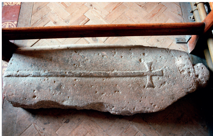
Fig. 2. Stenplade med tegn på udendørs placering, Bredwardine (Herefordshire).

og vi har registreret næsten 3000 genstande i alt. Desuden har vi foretaget sammenligninger i udlandet.