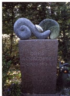
På Holmens Kirkegård har billedhuggeren Erik Varming skabt denne polykrome skulptur, som er udformet i sammenhæng med mindestenen.