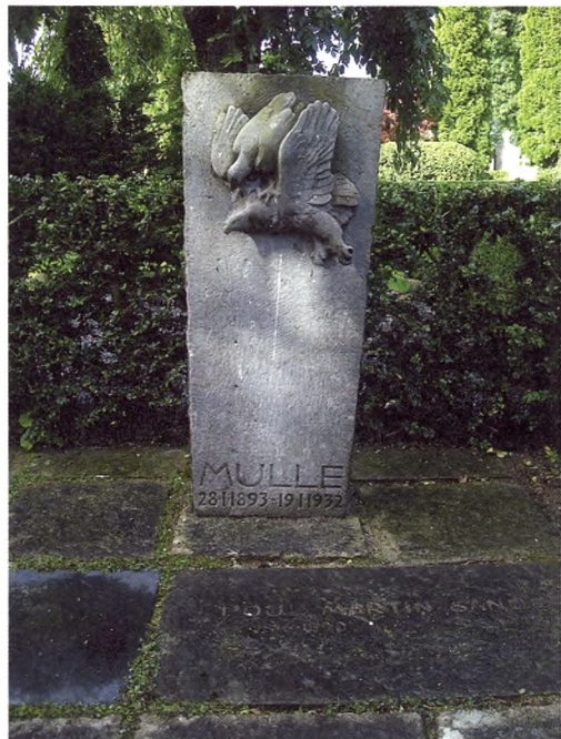
Billedhuggeren Mogens Bøggild har udført dette gravsted med et typisk motiv fra hans produktive liv.