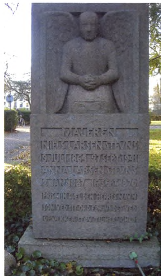
Billedhuggeren Astrid Noack har også skabt mindestenen for maleren Niels Larsen Stevns på Solbjerg Kirkegård.