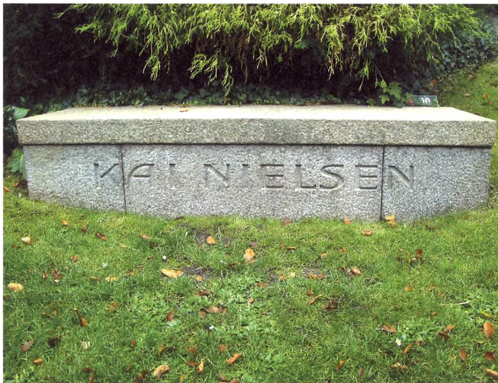
Danmarks store billedhugger, Kai Nielsen, har fået denne markante mindesten. På den kunne have været placeret for eksempel hans "Liggende Leda". Men nu står stenen der blot som en udfordring til fantasien – og et paradoks, da det havde været nærliggende at sætte en af hans egne skulpturer op.