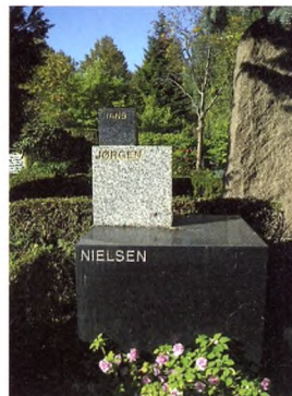
Forfatteren Hans-Jørgen Niensens gravsted på Holmens Kirkegård er udført af billedhuggeren Bjørn Nørgaard.