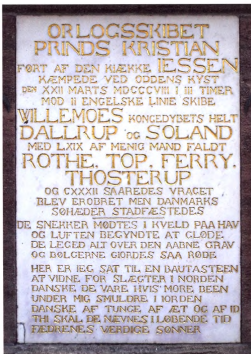
Grundtvigs mindeskript over de døde fra linjeskibet Prins Christian på Odden kirkegård.

ubehageligt for den følsomme kirkegårdsvandrer i 1800-tallet. Talestrømmen gik ad andre veje, om end Jeppe Aakjær, da han digtede om Jens Vejmand, ret behændigt kunne afslutte med kontrasten mellem liv og død, forbindelsen mellem liv og sten. Vejmandens liv var fuld af sten, men på hans grav i døden, man gav ham aldrig en. Da må man jo indrømme, at verden er hård og ufølsom som – sten.