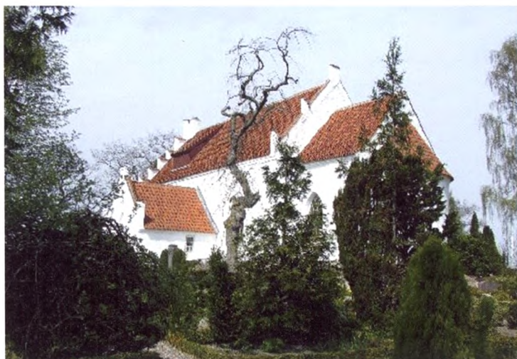
Butterup Kirke og Kirkegård.

Her er et kirkegårdsanlæg med tornerose-stemning – for-