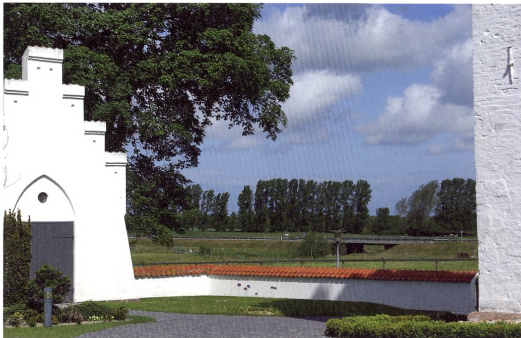
Tuse Kirke og kapel med græsenge anlagt indenfor kirkegårdsmuren – kirkegårdsmuren opleves visuelt som rejsende sig op af landskabet.