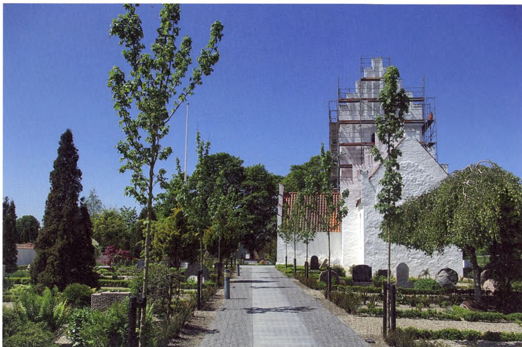
Kig op gennem den nye allé af Acer campestre "Elsrijk" med blå rønne-granitbelægning.