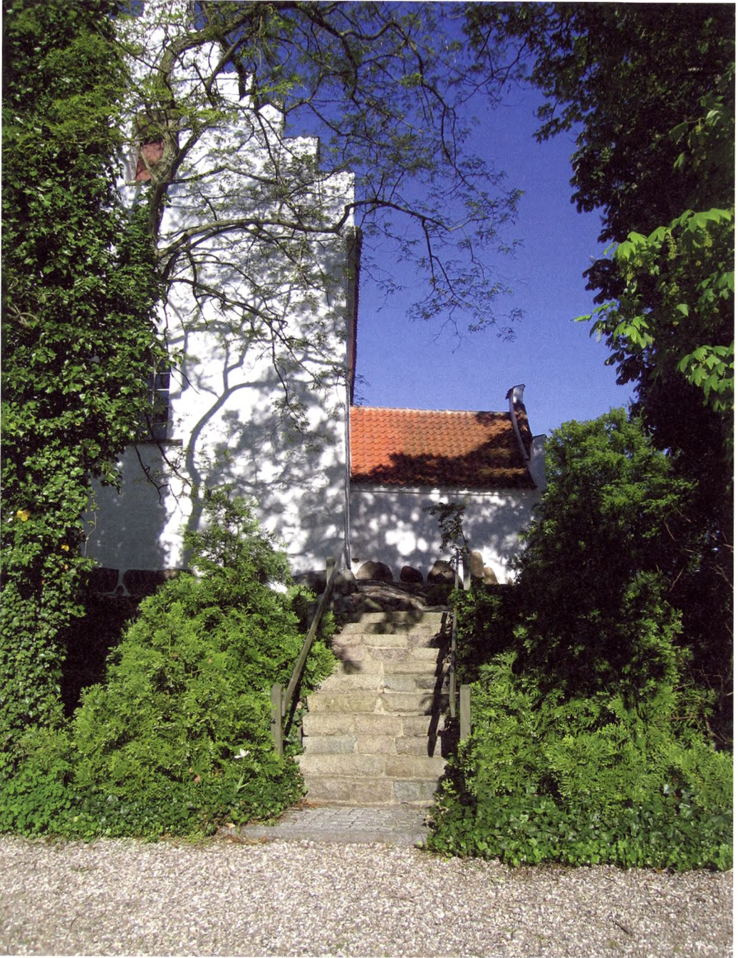
Butterup Kirke – hele kirkegården ligger hævet over det omgivende terræn. Adgang via det smalle trappeanlæg.