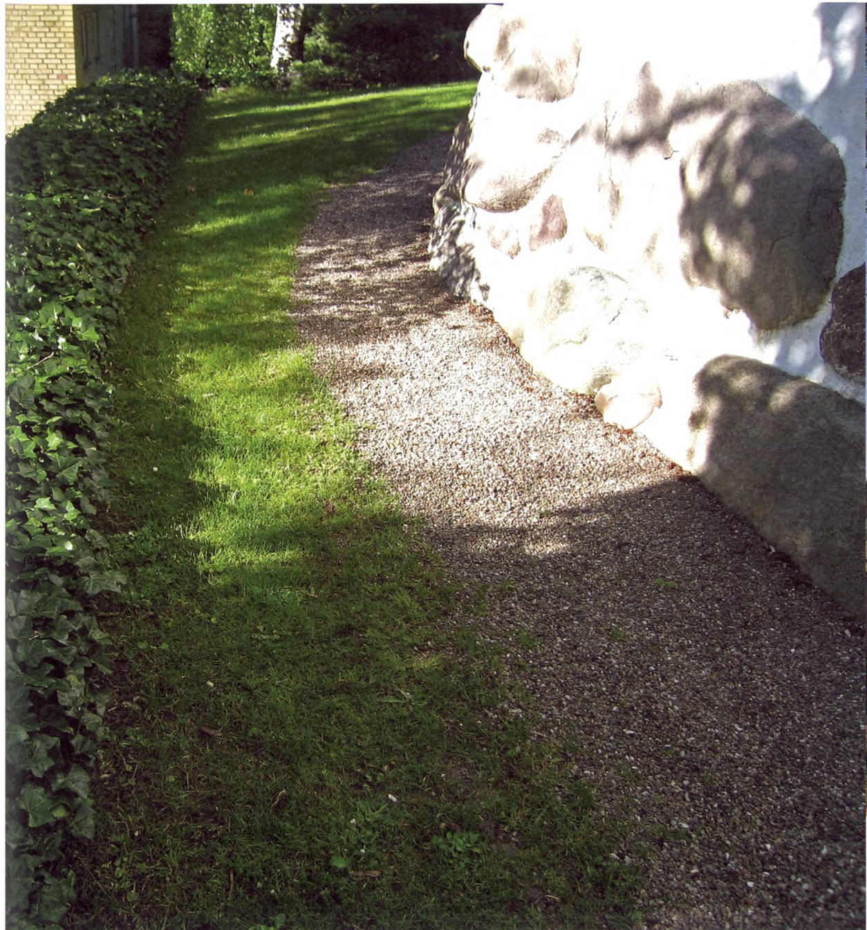
Smuk og meget smal sti omkring Butterup Kirke med gærdet overgroet af vedbend – Hedera helix.