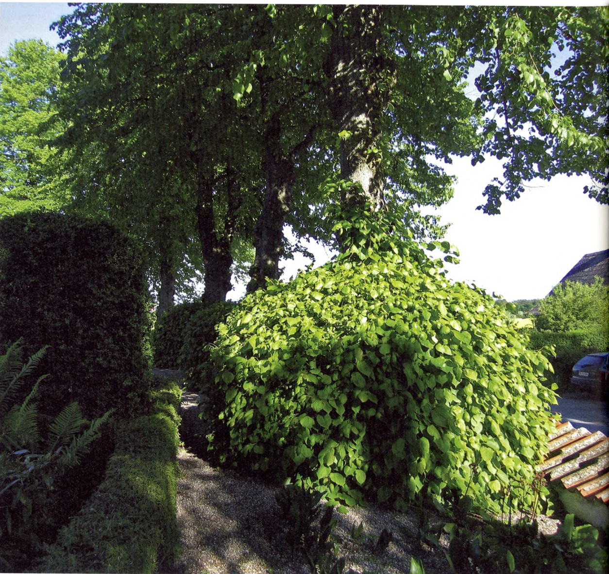
Gamle skovlinde med kransklippet manchete mod den høje kirkegårdsmur.