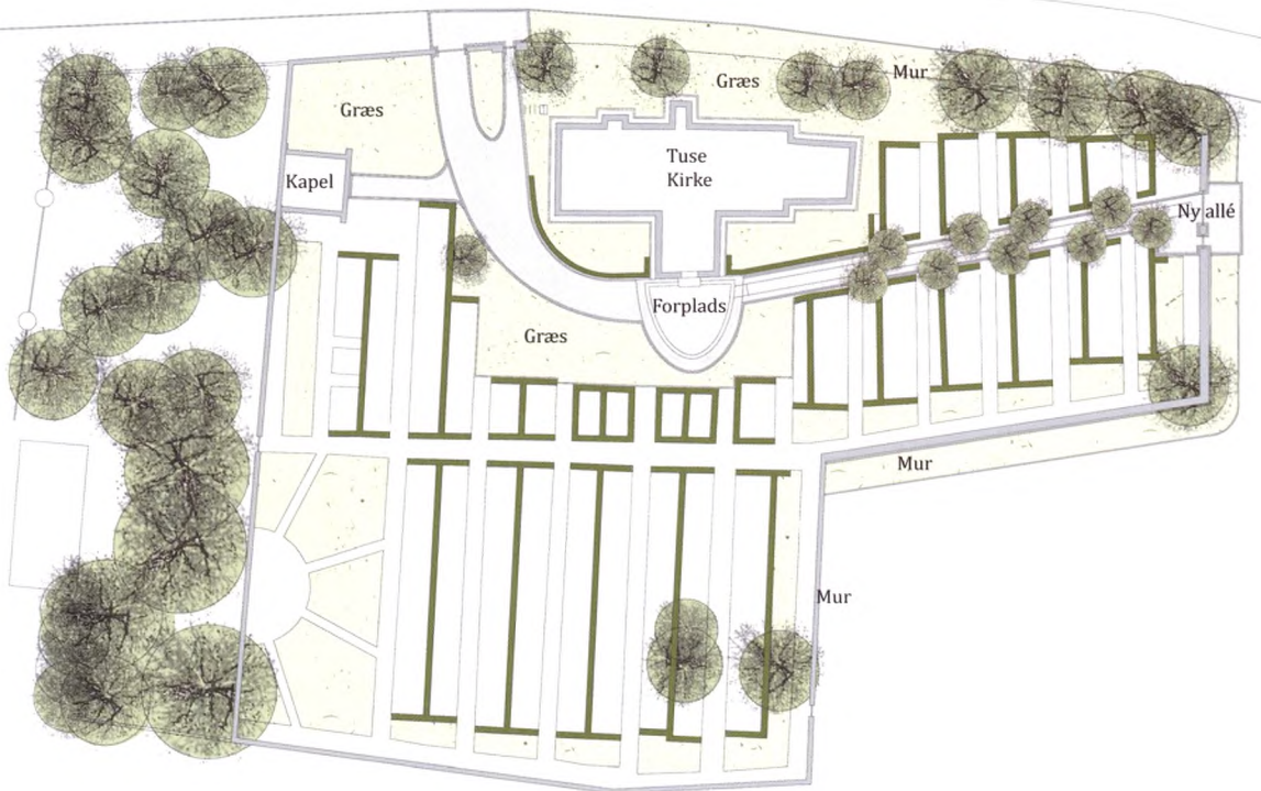
Tuse Kirke og Kirkegård – plantegning.

Der kommer årligt mange besøgende til Tuse kirke – kirkens udsmykning er vidt berømt.