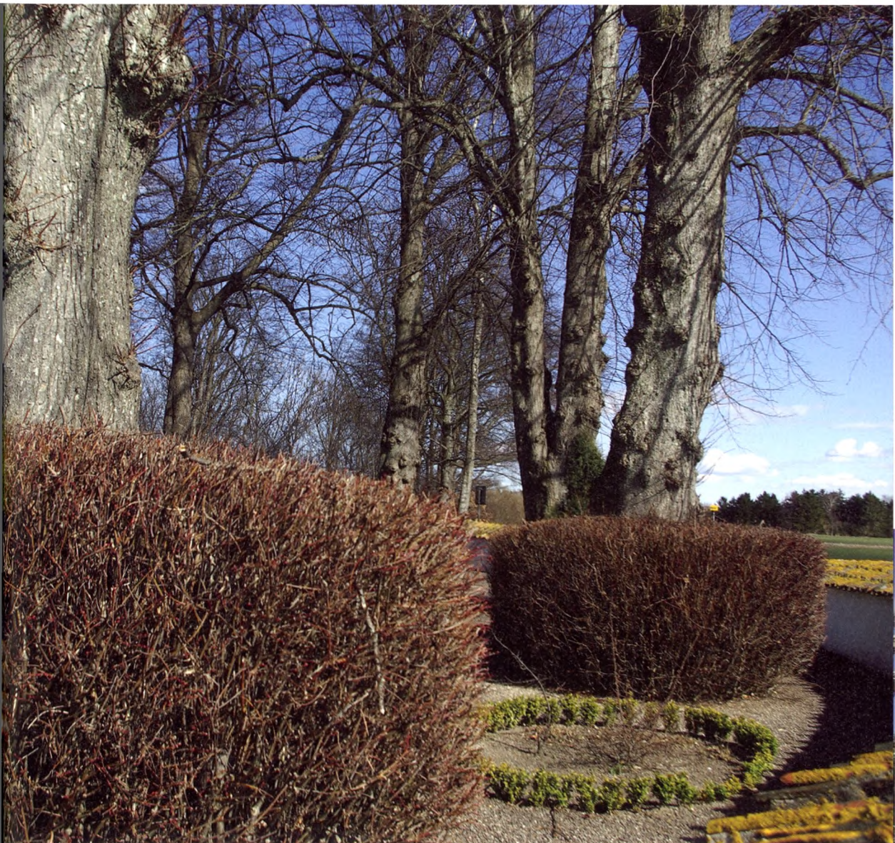
Samme lindetræer i vintertilstand.