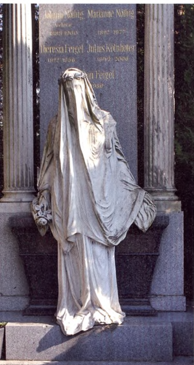
Kvinde med slør, gravminde, Wien Zentralfriedhof.

kirker eller kapeller. De er bygget udelukkende til den funktion at sige farvel til den døde.