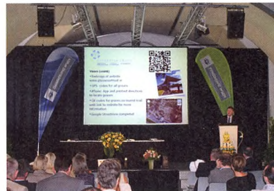
Årsmøde i ASCE i Wien.

Besøget på Wiens Zentralfriedhof var i den sammenhæng en berigende oplevelse. Denne kirkegård bærer præg af byens store historiske betydning som hovedstad i det Østrig-Ungarske rige. Og det er måske netop den mentale arv fra det gamle imperium, som har gjort det let for kirkegårdsledelsen at give plads til kirkegårdens mange grupperinger, forskellige religioner og nationaliteter. Udviklingen på Wien Zentralfriedhof er for mig at se forbilledlig, for så vidt man inden for kirkegårdens samlede areal har fundet plads til afsnit for mange for forskellige trosretninger. Wiens Zentralfriedhof kan således fortsat afspejle hele byen og dens befolkning. Det er en stor værdi, og jeg vil mene, at vi i dansk kirkegårdskultur, i de store byer, godt kan lade os inspirere af en sådan wienerisk løsning.