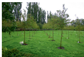
Lunden med rækker af kirsebær og paradisæbler.