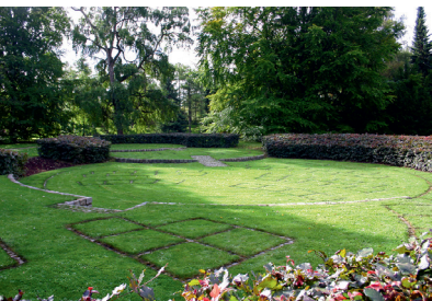
I Cirkelen er gravstederne anlagt i forskudte niveauer.

Ligeledes på Bispebjerg Kirkegård blev der i 2006 anlagt en ny urneafdeling, som rummer godt 150 gravsteder fordelt på 4 cirkler i tre forskellige niveauer. De to små cirkler yderst til højre og venstre ligger i almindeligt niveau, hvorimod de to større cirkler i midten af afdelingen er gravet 30 og 50 cm ned i forhold til det omliggende areal. De 4 cirkler er snoet ind i hinanden og graver sig dybere og dybere ned. Alle gravsteder er lagt ud i græs og er markeret af en chausséstenskant. For at skabe tilgængelighed er to af tre trapper erstattet af ramper, og kantstenen ned til vejen er sænket. Den traditionelle afdelingshæk er erstattet af et pur af blodbøg, plantet på en skråning. Dermed opleves niveauforskellen meget større end den i virkeligheden er, og bygningsomkostninger mht. støttemure kunne holdes lave. Nogle steder er purret erstattet af lave, bunddækkende stauder for at give orienterings- og udsynsmuligheder og undgå, at besøgende føler usikkerhed eller ubehag. Afdelingen er lige blevet frigivet til salg efter en veloverstået etableringsfase og skal snart beplantes færdig inde i cirklerne med lave, selvrensende roser. Jeg er meget spændt på, hvilken modtagelse dette nyeste skud på stammen vil få, men er selv helt fascineret af farvespillet og den virkning, niveauforskellen har, og derfor meget fortrøstningsfuld.