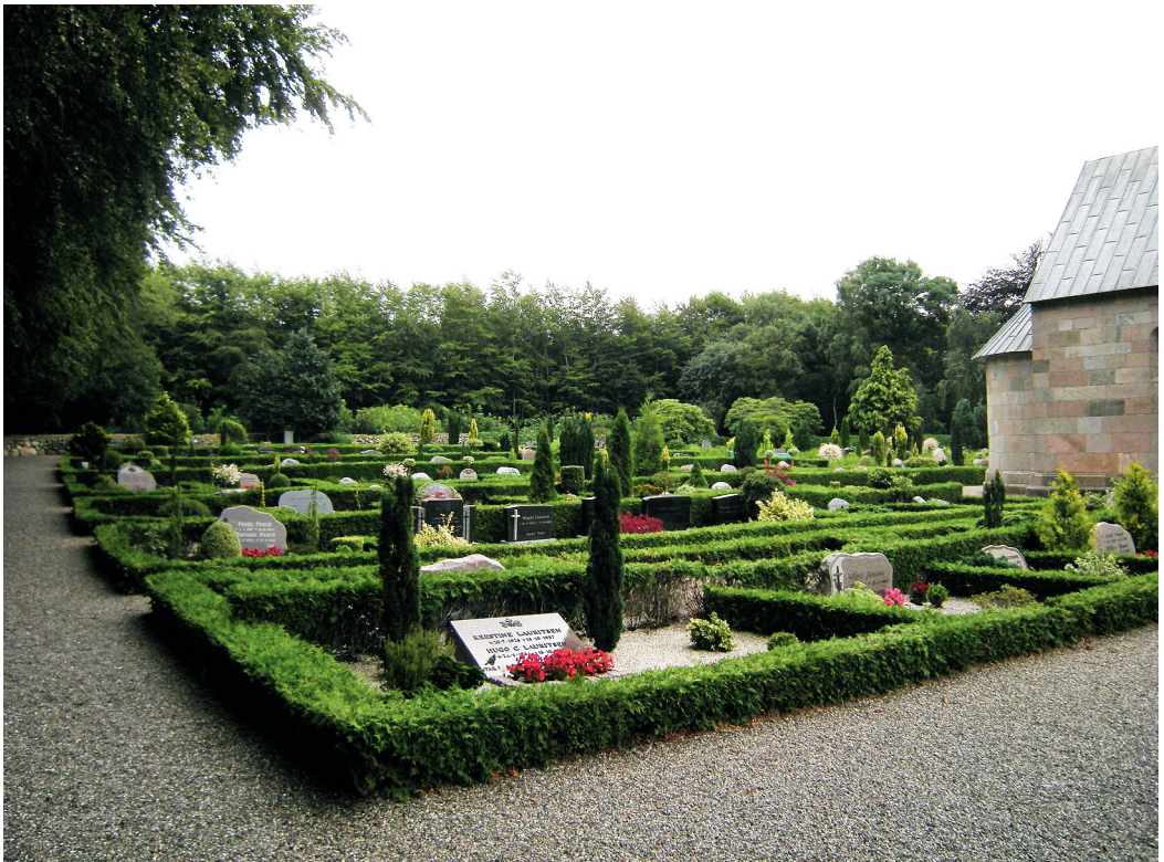
Foto: Kirkegårdens mangfoldighed.

På kirkegården er vi vidner til 'det langsomme skuespil'. Anlægget er bundet af fredningstider og traditioner, og vi får det indtryk, at tiden står stille. Det fascinerer de fleste. Vi oplever vores historie fortalt gennem gravstedernes inskriptioner og form, og vi føler kirkegården som både natur, kultur, historie og ånd, når vi bevæger sig ind i det rum, der afgrænses af kirkegårdsmuren.