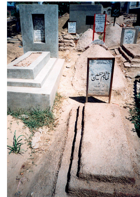
Opphøyning av graver i Punjab

holdsarbeid (som gressklipping). Murkanter, opphøyning av graver eller mye pynt ble av representanten fra Islamsk Råd Norge raskt definert som tradisjon og følgelig noe som ikke var en nødvendig del av en islamsk gravlund.