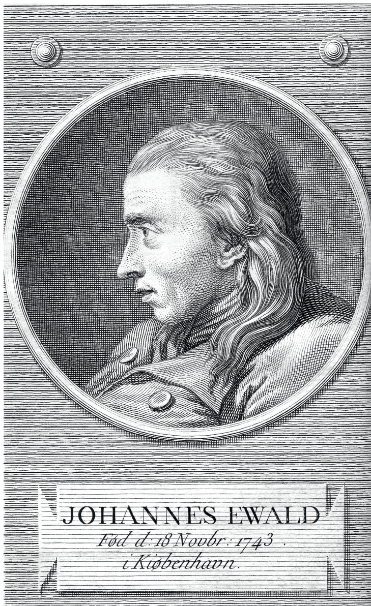
Fig. 2. J.F. Clemens, Johannes Ewald, titelblad fra Samtlige Skrifter, Bd. 1, 1780.

6. Thi den som Phoebus tilig lærte Sin underlige Harmonie Hans varme, fulde store Hjerte Udbrede himlene sig i Hans sjæl ompænder soelene Hans stærke Tanke griber Tiden Og nu og da og før og siden Adspredet ey hans følelse 5