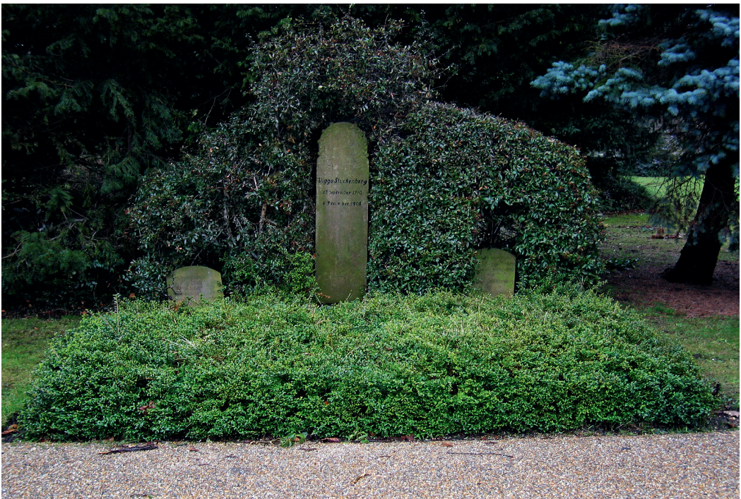
Fig. 3. Viggo Stuckenbergs grav Assistens Kirkegård.

To af digtene; "Vestre Kirkegaard" 13 og "Assistens Kirke-