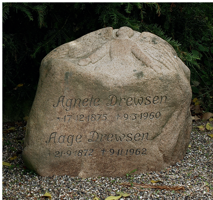
Ill. side 13: Husby Kirkegård.

Hvad er egentlig ideen med at placere en engel på en gravsten? Englenes funktioner er flere, men de er først og fremmest budbringere. Englene er med i evangeliets beretninger om Jesu liv. De er med fra begyndelsen til slutningen. En engel viser sig således julenat for hyrderne på marken uden for Betlehem, og en engel møder påskemorgen de kvinder, som står foran Jesu tomme grav. Englen vidner om det skete, og