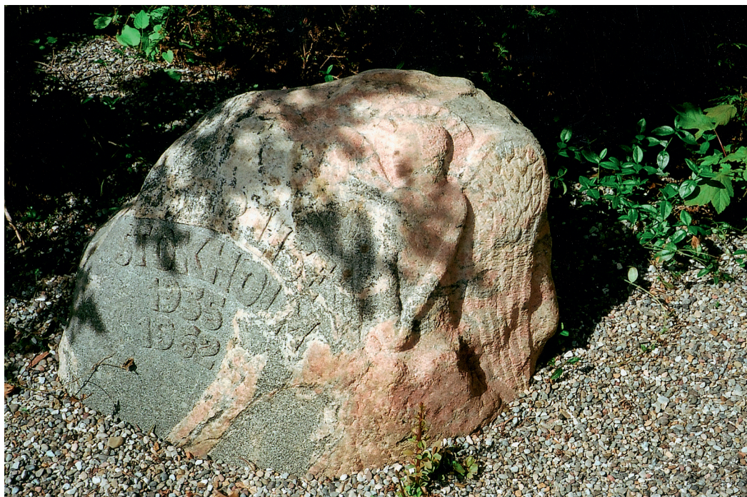
Engelse Stokholm, Lemvig Kirkegård.