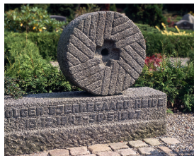
Heide gravsten. Ansgar Kirkegård, Øster Jølby.