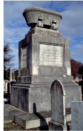
Thomas Drummonds monument.

Selvom der er mange andre victorianske kirkegårde i Irland, er det kun Belfast City Cemetery, der kan måle sig med de ovennævnte. Den første begravelse her fandt sted i 1869, og