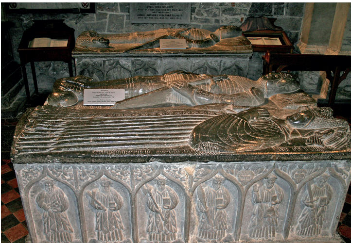
St. Canice's Cathedral, Kilkenny.

Relativt få 1700-tals grave har overlevet, og mange af dem er enten blevet skamferet, fjernet og genrejst andetsteds eller restaureret. Den største koncentration findes i County Kilkenny. Påvirkninger fra overklassens store europæiske dannelsesrejser i 1800-tallet kan spores i periodens monumenter placeret