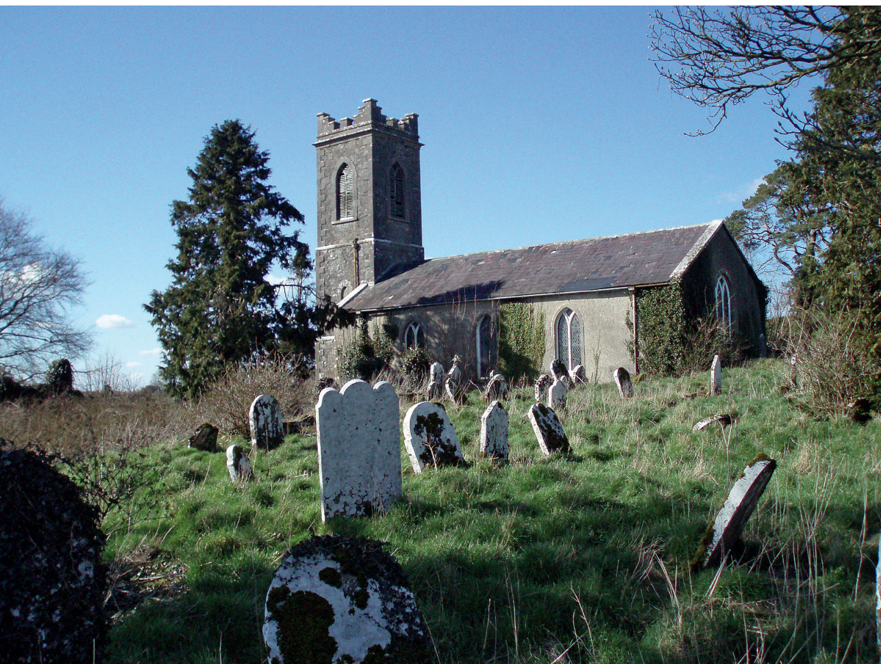
Westmeath Church.

Det store flertal af befolkningen blev naturligvis ikke begravet inden for kirkernes mure, men på de tilstødende kirkegårde. Kirkegårdene er altid spændende lokaliteter, ikke bare pga. selve gravminderne, men også pga. de historier, de fortæller. I forrige århundrede groede mange af kirkegårdene til og blev taget ud af brug, men de er stadig meget pittoreske og romantiske. Og efterhånden har omgivende lokalsamfund indset de gamle kirkegårdes kulturhistoriske værdi og er gået i gang med at redde dem fra buske, ukrudt og vedbend.