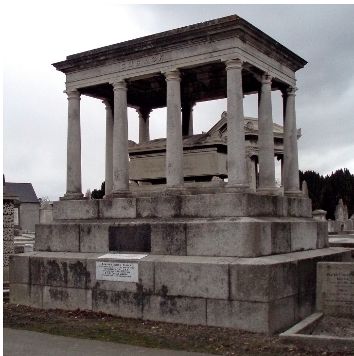
James William Cusacks monument.

Det mest imponerende monument rejst af denne sammenslutning er en gruppe på tre figurer rejst på en afdeling forbeholdt Fenians (irske nationalister, red.). Figureerne repræsenterer Pa-