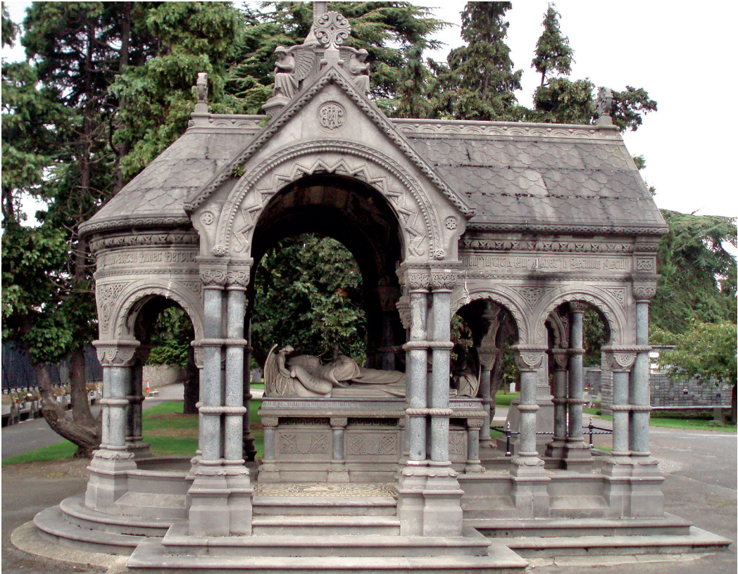
Kardinal McCabes monument.