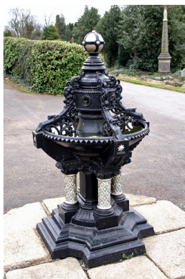
Belfast City Cemetery.

kirkegården var oprindeligt tiltænkt katolikker, dissenter og medlemmer af statskirken. Den katolske del skulle adskilles fra de øvrige afdelinger af en 3 meter høj, underjordisk mur! Kirkegården var også i socialt henseende opdelt - fattigfolk skulle have deres egen indgang og begraves bagest på kirkegården.