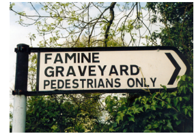
Afvisning til sultkirkegård.

Beliggenheden er bevaret i den lokale erindring, selv hvor der ingen markering er for de tusindvis af mennesker, der blev begravet der. I de senere år er der i mange lokalsamfund på disse sultens marker blevet rejst et enkelt kors og en mindeplade med information samt en anmodning om at bede en bøn for de døde.