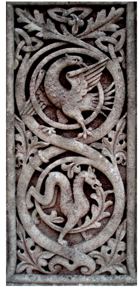
Keltisk kors, detalje.

De førømtalte nationale symboler stimulerede ikke bare irsk selvtillid og stolthed, men afspejlede også en grundfæstet modstand mod det britiske styre. Symbolerne ses ofte på gra-