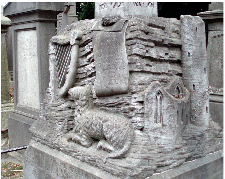
John Keegan Caseys monument.

Det keltiske kors, der trækker på det foregående årtusindes højkors, var en rammende markering af både religiøst og nationalt tilhørsforhold. Højkorsene havde felter med illustrationer af bibelske scener og blev brugt af præsteskrabet til belæringer af de troende. I det 19. århundrede havde korsene tilsvarende bibelske felter eller felter fyldt med kunstfærdigt