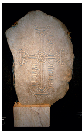
Tidlig kristen gravsten.

tre vigtigste ved Newgrange, Knowth og Dowth. Newgrange er over 5000 år gammel og er det mest besøgte arkæologiske monument i Irland med mere end 250.000 besøgende årligt. I en 4-dages periode omkring vintersolhverv gennembryder solen en åbning over indgangens dekorerede sten og oplyser langsomt gangen ind til gravkammeret, så hele kammeret til sidst er dramatisk belyst. Hovedgravkammeret i Knowth, omgivet af 17 varder, er det største i Europa med hundredvis af udsmykkede sten.