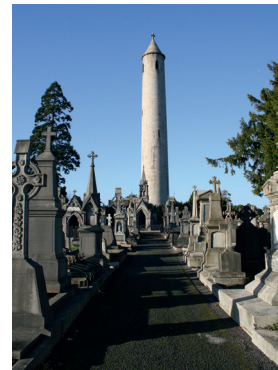
Daniel O'Connells monument.

I takt med større selvbevidsthed hos både den katolske kirke og dens fremvoksende middelklasse ses en bevægelse væk fra den nyklassicistiske stil, som blev forbundet med protestantisk og britisk overherredømme, og hen imod gotisk og romansk stil, der trak tråde tilbage til de tider, hvor den katolske kirke havde været ved magten. Der er mange fine eksempler på grave, gravkapeller og bygninger i disse stilarter. Man kan