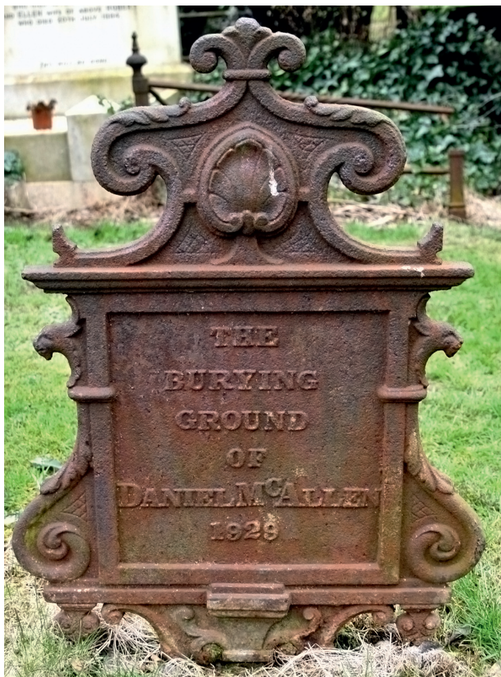
Belfast City Cemetery.

Monumenterne i den gamle del af kirkegården afspejler tidens smag med masser af urner, knækkede søjler, obelisker, keltiske kors og et stort antal engle. Her er desuden mange gravminder af jern, smedejernsgravmæler og -gitre, alle fremstillet lokalt. Denne type mindesmærker er næsten fuldstændig fraværende på de større kirkegårde i Dublin. Frimurer- og militærsymbolik er også ret udbredt.