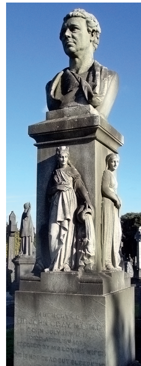
Sir John Grays monument.