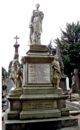
Patriotisk monument.

ve for folk, der politisk eller på anden vis ydede aktiv modstand mod briterne, men ved århundredeskiftet var de blevet så allestedsnærværende, at de mistede deres potens.