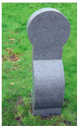
Forslag til gravminde af Bjørn Poulsen.