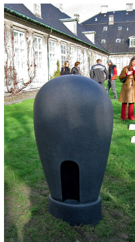
Forslag til gravminde af Bjørn Nørgaard.