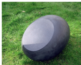
Forslag til gravminde af Sophie Kalkau.