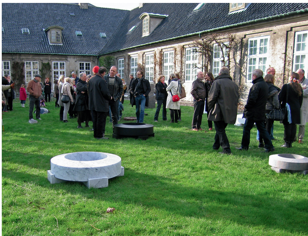
Forslag til gravminde af Morten Stræde.