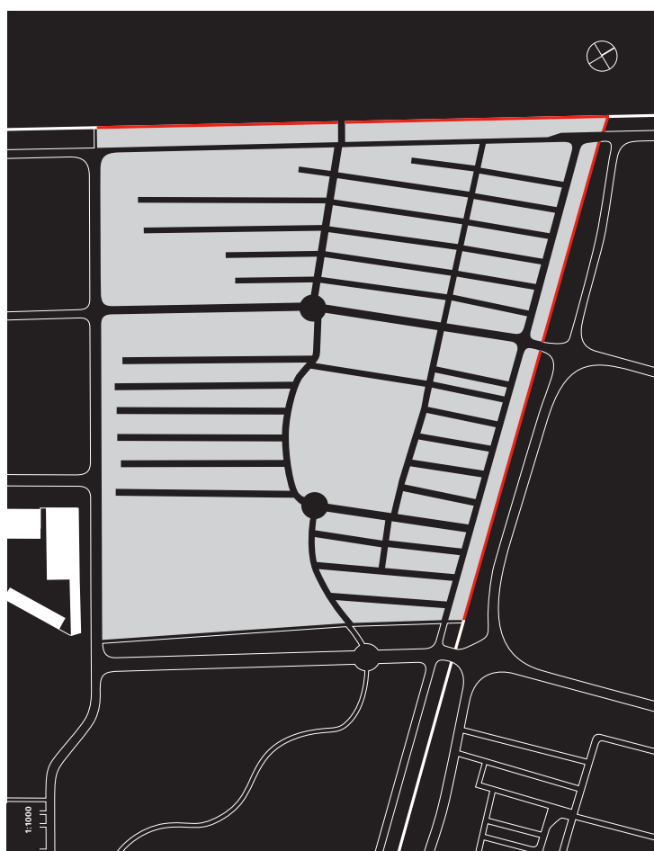
Eksempel på afdelingskort, her afdeling N.

Endelig giver kirkegårdsvejleder Stine Helweg i kapitlet "Et kort rids af Assistens Kirkegårds historie" (s. 120-131) en oplysende og velskrevet gennemgang af udviklingen fra fattigkirkegård til moderne storbykirkegård. Og det slår en, hvor få ændringer der faktisk har været gennem århundrederne, hvad angår organisering af denne store kirkegård. Overgangen i 1880 fra assistancekirkegård for indre bys gamle kirker til at være en kommunal kirkegård i "egen ret" medførte et nyt gravstedssystem i 1882 med afdelingsbetegnelser og numre, der stadig er virksomt i det 21. århundrede. Og der berettes om dispositionsplaner i forhold til den planlagte afvikling af kirkegårdsdriften, hvor det i 1988 blev bestemt, at Assistens Kirkegård fra 2020 skulle tilgodese fire hoved-