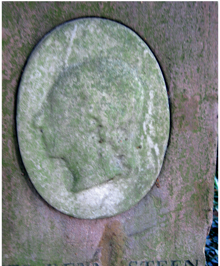
Fig. 5. Nicolai Dajon: O.J. Samsøes portræt, gravmælet Assistens Kirkegård.