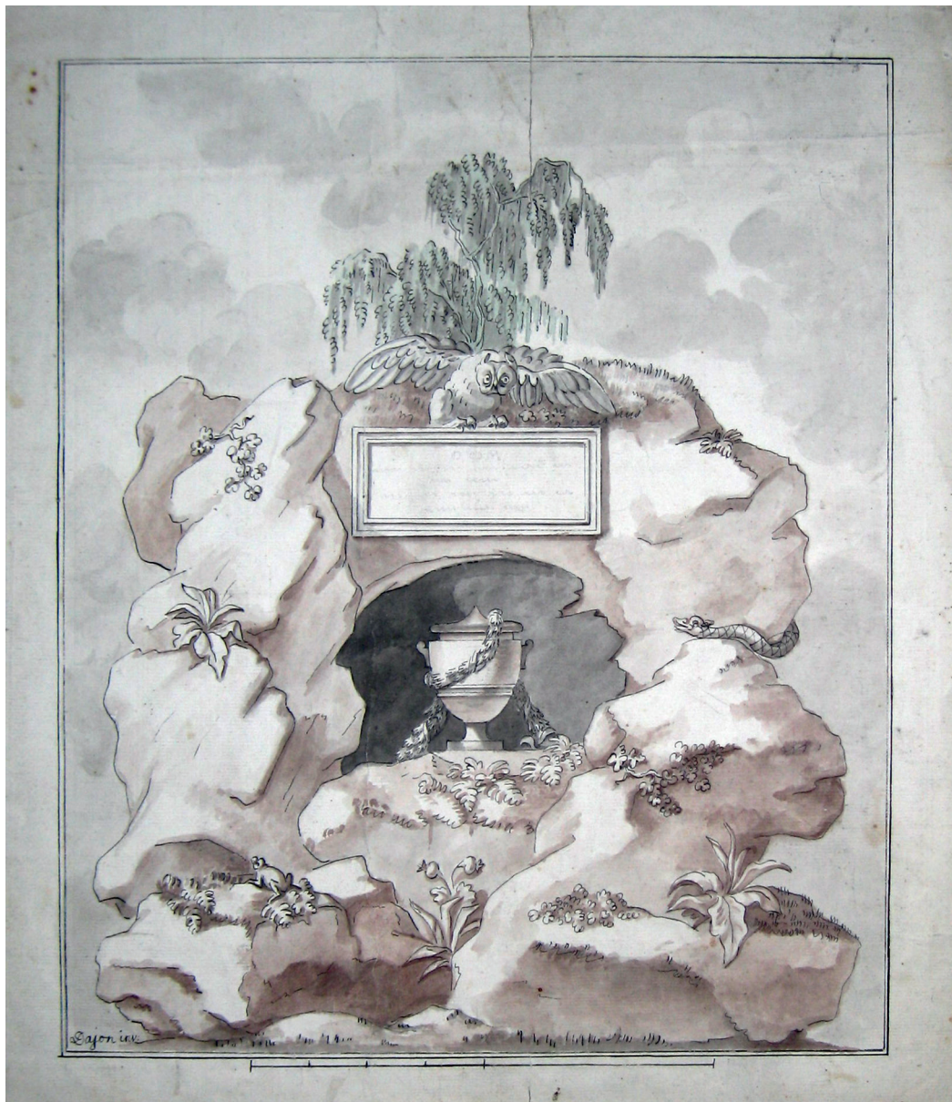
Fig. 7. Nicolai Dajon: Udkast til F. Udbyes grav- mæle, Assistens Kirkegård, 1817. Tusch, akvarel. Privateje.